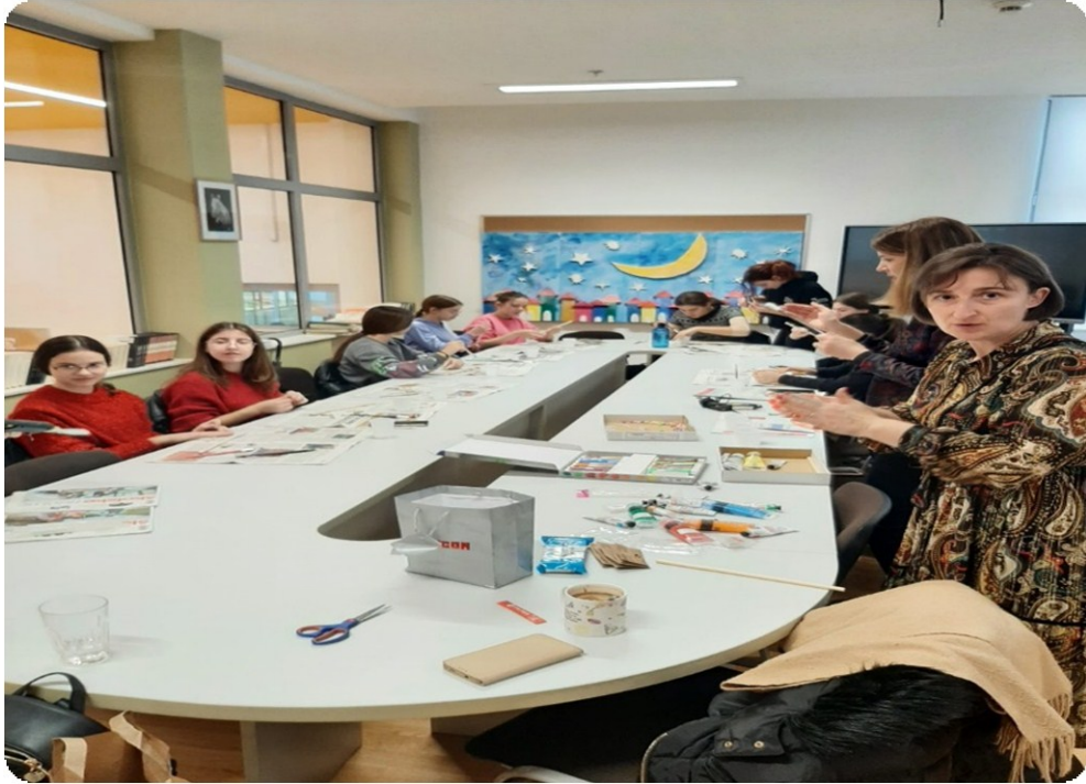
Slika 14. Izrada kreativnih i zanimljivih likovnih uradaka 65

Projekt se nastavio i izmjenom vizualnog izgleda školske knjižnice. Školska knjižnica je tako postala mjestom projekcije prvog filma o slavnom čarobnjaku. Kako bi osvojili ulaznicu za projekciju filma učenici su morali krenuti u potragu. U školskom hodniku nalazile su se skrivene fotografije, a svaka pronađena fotografija vodila je učenike do određenoga naslova u školskoj knjižnici. Uspješno riješen zadatak učenicima je osigurao ulaznicu za projekciju filma. Nakon pročitane knjige i odgledanog filma uslijedio je i kviz znanja. Najuspješniji su osvojili dodatne bodove za dom koji im je dodijeljen.