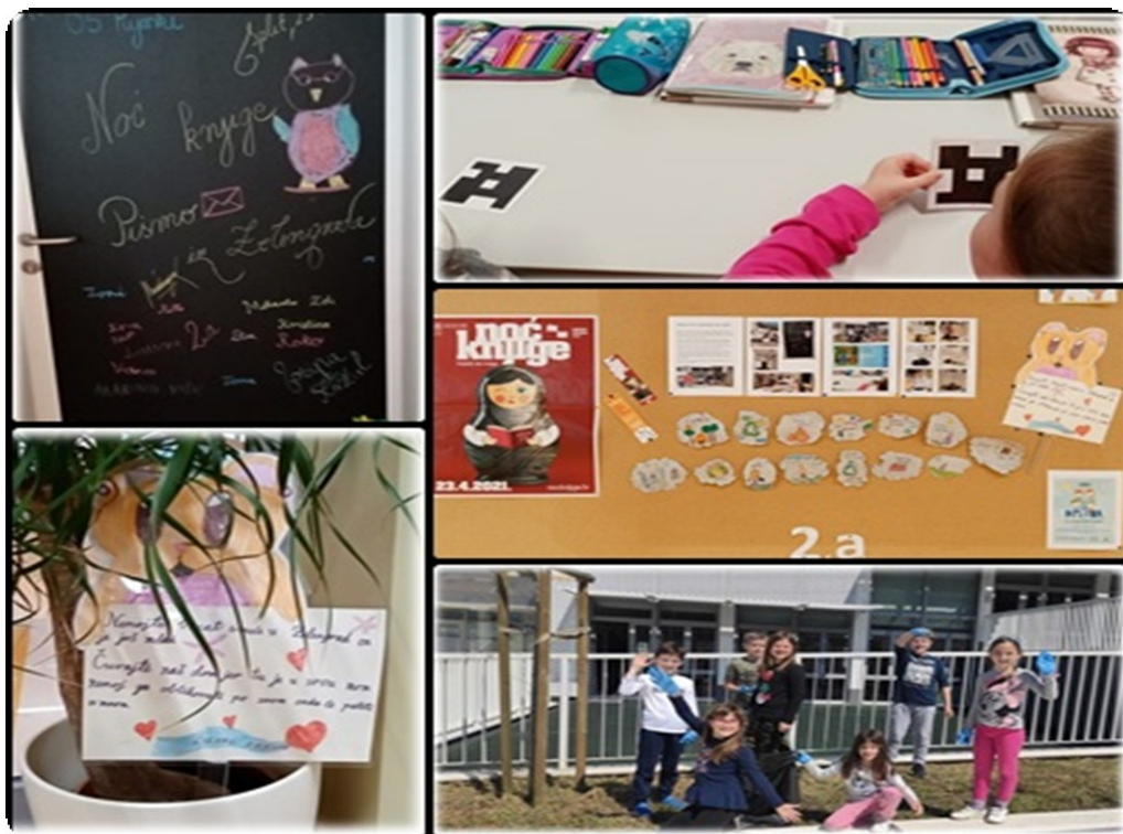
Slika 10. Provedene aktivnosti tijekom čitanja knjige Pismo iz Zelengrada 58