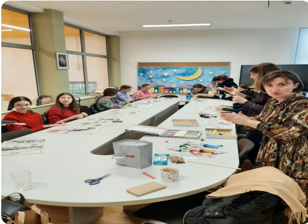
Slika 14. Izrada kreativnih i zanimljivih likovnih uradaka 65

Projekt se nastavio i izmjenom vizualnog izgleda školske knjižnice. Školska knjižnica je tako postala mjestom projekcije prvog filma o slavnom čarobnjaku. Kako bi osvojili ulaznicu za projekciju filma učenici su morali krenuti u potragu. U školskom hodniku nalazile su se skrivene fotografije, a svaka pronađena fotografija vodila je učenike do određenoga naslova u školskoj knjižnici. Uspješno riješen zadatak učenicima je osigurao ulaznicu za projekciju filma. Nakon pročitane knjige i odgledanog filma uslijedio je i kviz znanja. Najuspješniji su osvojili dodatne bodove za dom koji im je dodijeljen.