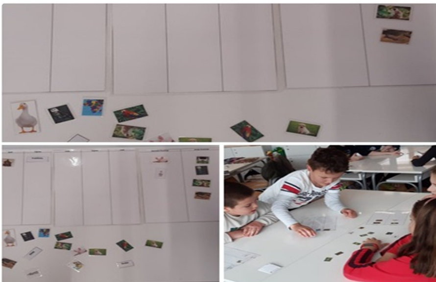
Slika 4. Životinjsko carstvo 48

Treća igra bila je Životinjsko carstvo . Učenici su na odgovarajuće mjesto u tablicama trebali smjestiti životinje i odrediti njihovo stanište. Također, učenici su trebali razvrstati novac, mjesto i ljude u posebne rubrike.