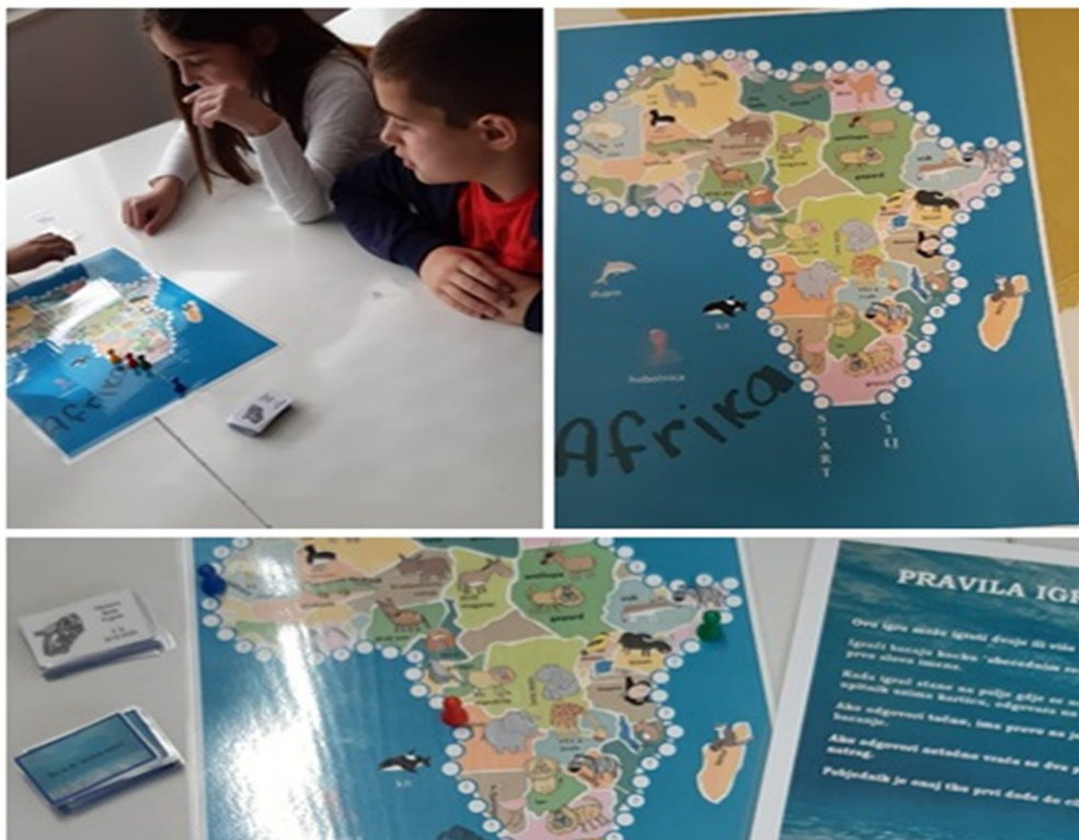
Slika 5. Put oko Afrike 50

Četvrta igra bila je Put oko Afrike . Učenici su “plovili brodom” oko Afrike, a kada bi se zaustavili na oznaci na kojoj se nalazio upitnik trebali su ponuditi točan odgovor kako bi nastavili svoju “plovidbu” do samog cilja. Ako bi netko netočno odgovorio na pitanje s kartice morao se vratiti dva polja unatrag. 49