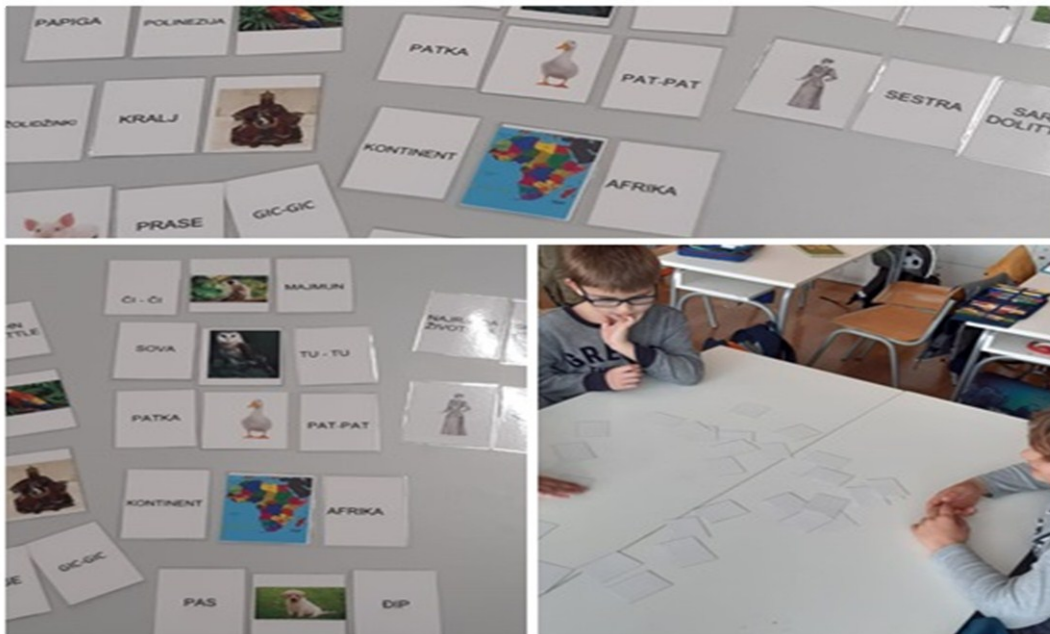
Slika 2. Memory kartice 46

Učenici najlakše uče kroz igru, stoga je knjižničarka za obradu lektirnog djela Pripovijest o dr. Dolittleu osmislila četiri društvene igre. Igre su sadržavale lektirni sadržaj. Prva igra bila je Memory . Učenici su spajali tri kartice.