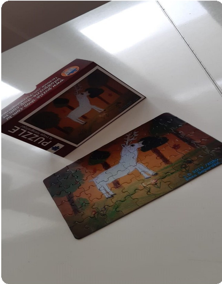
Slika 6. Personalizirane puzzle 51

djelu. Potom su oslikali memory kartice. Na jednoj su kartici nacrtali životinju, a na drugoj su napisali podatke o njoj. Učenici su samostalno osmišljavali pitanja koja će se postavljati u igri. Potom su dobili zadatak da nacrtaju bijelog jelena, a nagrada za najbolji rad bile su personalizirane puzzle.