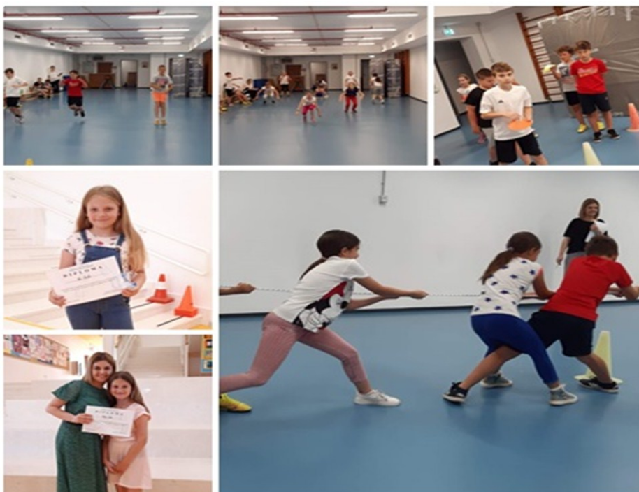
Slika 11. Aktivnosti u OŠ Pujanki tijekom sudjelovanja u projektu Čitanje ne poznaje granice / Branje ne pozna meja 61