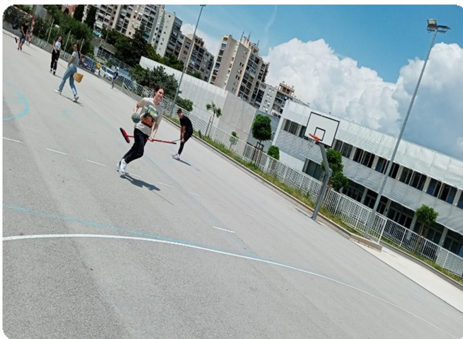
Slika 16. Metloboj 68