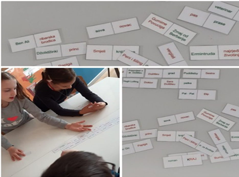
Slika 3. Domino 47

Treća igra bila je Životinjsko carstvo . Učenici su na odgovarajuće mjesto u tablicama trebali smjestiti životinje i odrediti njihovo stanište. Također, učenici su trebali razvrstati novac, mjesto i ljude u posebne rubrike.