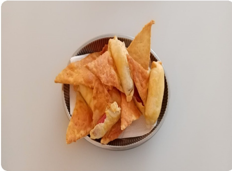
Slika 15. Čarobnjački šeširi 66

Na školskom dvorištu odigrali su i igru Metloboj . Kreirali su i male predstave temeljene na pročitanim knjigama. Nakon što je projekt završio učenicama su dodijeljene i zahvalnice za sudjelovanje. 67