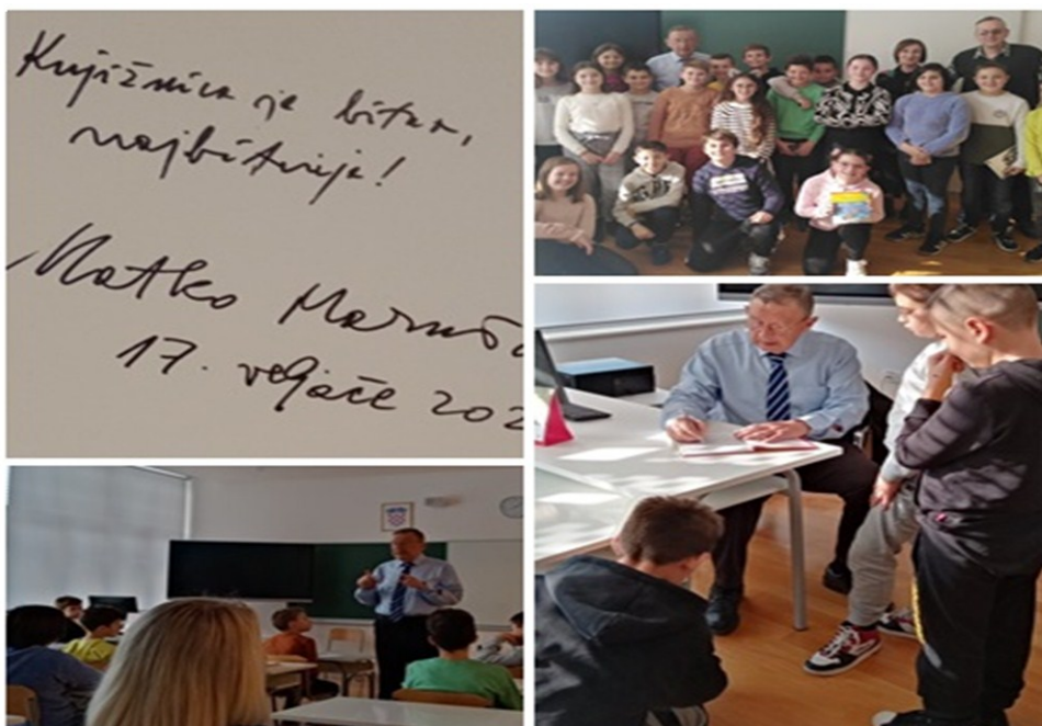
Slika 8. Posjet književnika Matka Marušića 54

Školsku knjižnicu je u veljači posjetio književnik Matko Marušić. Svojim je životnim iskustvom i pričama oduševio učenike četvrtoga razreda. Naglasio je važnost knjižnice u njihovom obrazovanju.