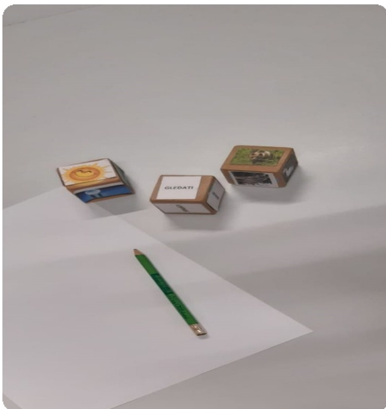
Slika 7. Tri kockice 53