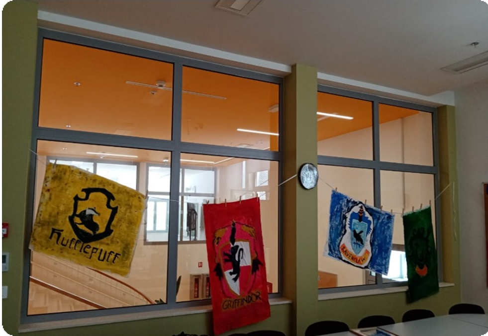
Slika 13. Zastave četiriju domova u školi Hogwarts 64

domova. Svaki je tim oslikao grb svoga doma. Kako bi prikazali pripadnost određenom domu učenici su izradili i bedževe te su ih nosili zakačene na svojim majicama.