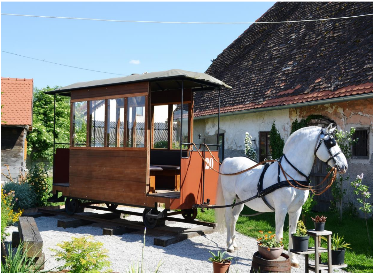
Slika 5. Rekonstrukcija kojnače u Novom Čiču