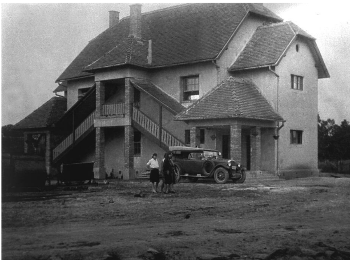
Slika 7. Zgrada zdravstvene stanice u Mraclinu

Mraclin je tako dobio novu zdravstvenu stanicu, podigla se higijena zdenaca, gnojnica, zahoda, popravila se odvodnja i kanalizacija. Zdravstvena stanica radila je od 7 do 19, a pregledi i liječenje nisu se naplaćivali. Kako vidimo iz govora dr. Štampara, krenulo se i u isušivanje bara, izgradnju pločnika i odvodnih kanala. Radovi na asanaciji Mraclina na kraju su potrajali do 1935. godine, ali posljedice tog čina su bile dalekosežne. Mraclin je postao ogledni primjer asanacije sela, ne samo u Hrvatskoj nego i u svijetu. 86 Ono što je također pomoglo osvješćivanju seljaka o važnosti higijene bili su tečajevi, predavanja i filmske projekcije koje je između ostalih vodio i Drago Chloupek. Osobito zanimljivi i posjećeni bili su tečajevi iz domaćinstva. Govorilo se i o higijeni prehrane, bolestima koje mogu biti uvjetovane lošom prehranom, o njezi djece, o osobnoj higijeni, prvoj pomoći, povrtlarstvu, konzerviranju hrane, mljekarstvu i ponašanju u društvu. 87 Osim takvih tečajeva, Škola narodnog zdravlja organizirala je i Seljačko sveučilište na prijedlog Andrije Štampara. Rad sveučilišta je krenuo 1928. godine i predavanja su vodili stručnjaci Škole narodnog zdravlja i