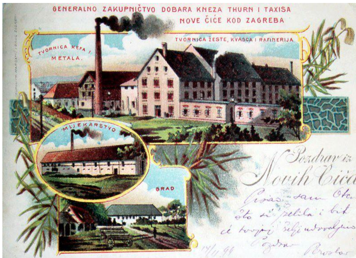
Slika 4. Razglednica iz 1899. godine

Među mnogim posjedima bogate njemačke obitelji Thurn Taxis bila je i tvornica žeste, kefa i četki u Novom Čiču. Osim toga, na području Turopolja imala je obitelj Thurn Taxis još nekoliko posjeda u Velikoj Buni, Kozjači, Kravarskom, Podvornici, Šiljakovini, Starom Čiču, Bukevju, Strmcu, Veleševcu, Drnku, Lazini, Čičkoj Poljani i Ribnici. 57