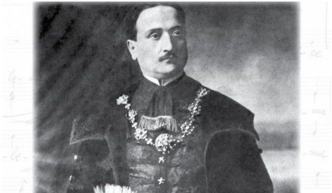
Slika 2. Franjo pl. Lučić

knjižnica, čitaonica i škola, a osnovao je i Turopoljsku štedionicu u Velikoj Gorici. 27 Nadzornu vlast nad zemljišnom zajednicom Plemenite općine Turopolja obavljala je Zagrebačka oblast, odnosno Kraljevska banska uprava Savske banovine, a kasnije banska vlast Banovine Hrvatske. Protiv odluka navedenih nadzornih tijela mogla se Plemenita općina turopoljska žaliti Ministarstvu poljoprivrede kao višoj instanci. 28 Za župovanja Franje Lučića otvorene su škole u selima Kuče, Mraclin i Buševac, kao i 15 čitaonica i knjižnica. 29 Osnovao je i muzejsku zbirku, doduše malih razmjera, između ostalog zbirku je činilo oružje, glazbeni instrumenti, uniforme, zastave i slični predmeti. 30 Nažalost, ta je zbirka nakon Drugog svjetskog rata izgubljena. Oni dokumenti koji su bili čuvani u arhivu Plemenite općine Turopolja su 1947. godine premješteni u Hrvatski državni arhiv, te se tamo i danas nalaze. Lučić je i između ostaloga poticao i osnivanje ranih pjevačkih, tamburaških i folklornih društava, kao i vatrogasnih društva i njihovih spremišta. Već je 1919. predlagao skupštini izgradnju ciglane, salaša i osnutak vlastite štedioničke zadruge. Sve se to kroz nekoliko godina i obistinilo.