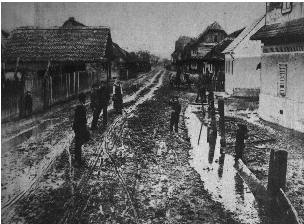
Slika 6. Selo Mraclin prije asanacije