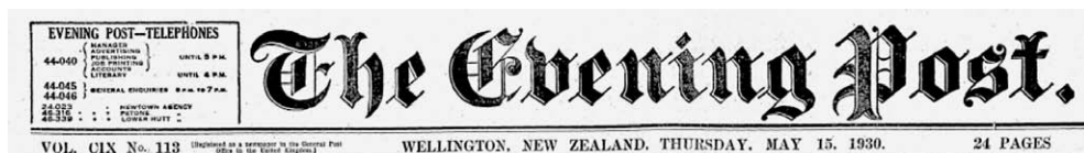
Slika 5. Zaglavlje broja 113 iz 1930. godine novina The Evening Post u kojima je objavljen tekst o T. Pavlović

https://paperspast.natlib.govt.nz/newspapers/EP19300515.2.119 .