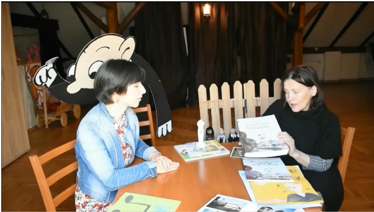
Slika 9. Videolekcija Češki jezik i kultura 8. r. OŠ - České besedy v Chorvatsku

Videolekcije za osmi razred sadrže nove oblike komunikacije, a učenici trebaju upotrebljavati vokabular koji su učili cijelu osnovnu školu te sve poznate gramatičke strukture. Iako videolekcije nisu dovoljne da se sve to ostvari, nastavnice pomno biraju sredstva kojima će učenike zainteresirati.