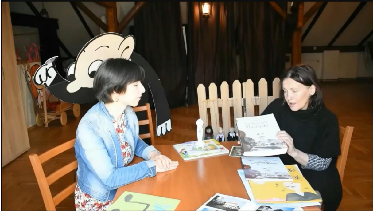
Slika 9. Videolekcija Češki jezik i kultura 8. r. OŠ - České besedy v Chorvatsku

Videolekcije za osmi razred sadrže nove oblike komunikacije, a učenici trebaju upotrebljavati vokabular koji su učili cijelu osnovnu školu te sve poznate gramatičke strukture. Iako videolekcije nisu dovoljne da se sve to ostvari, nastavnice pomno biraju sredstva kojima će učenike zainteresirati.