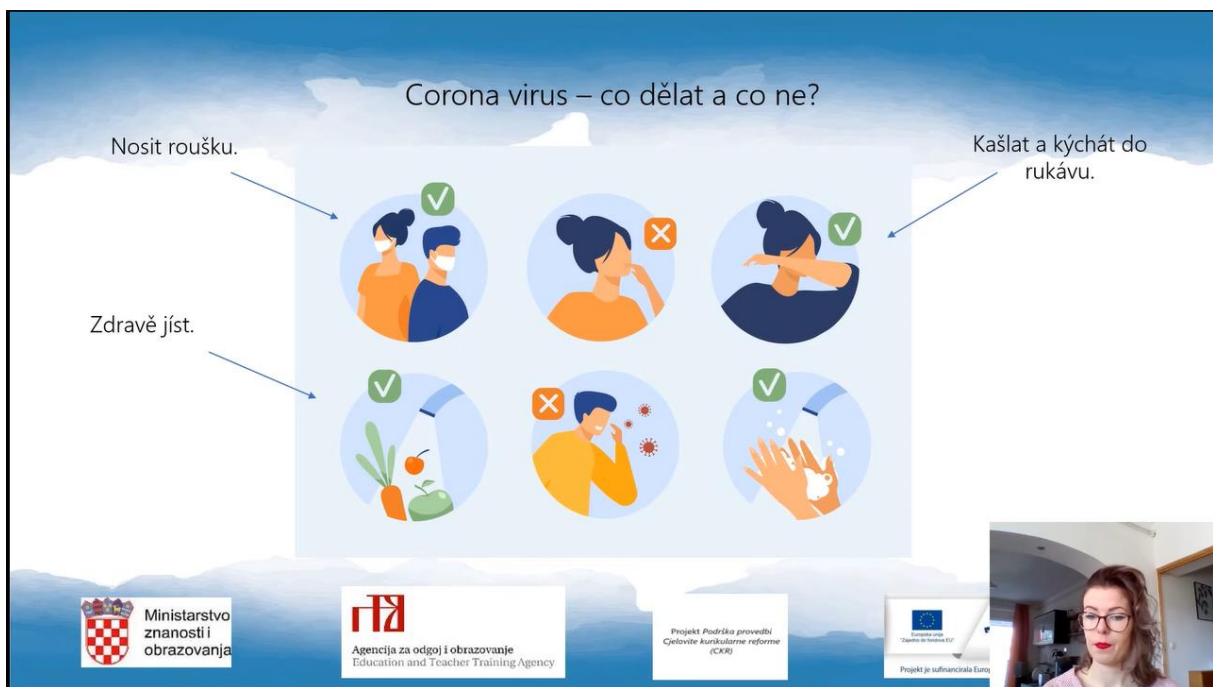
Slika 7. Videolekcija Češki jezik i kultura, 6. r. OŠ - Co potřebuješ, když jsi nemocný a když máš zranění

U 10. minuti videolekcije Co potřebuješ, když jsi nemocný a když máš zranění nastavnica na slajdu predaje o koronavirusu 38 , što prije nije predviđeno kao gradivo 6. razreda osnovne škole, ali zbog okolnosti i zdravstvene situacije u Republici Hrvatskoj, ipak je uvršteno u videolekciju.