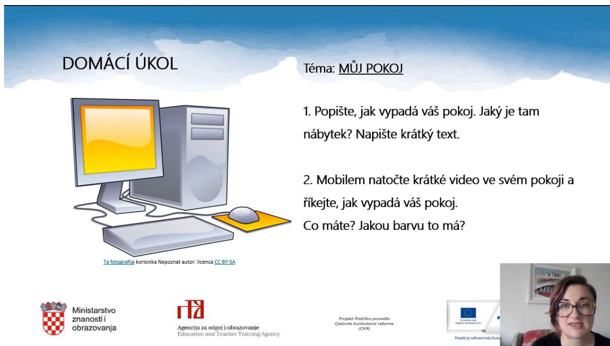
Slika 6. Videolekcija Češki jezik i kultura, 5.r. OŠ - Můj pokoj (nábytek a barvy)

Budući da učenici petoga razreda imaju veće iskustvo s tehnologijom od učenika nižih razreda osnovne škole, očekuje se da se koriste mobitelom u svrhu obavljanja zadatka za domaću zadaću. Gradivo o češkoj kulturi u petome je razredu zastupljenije, stoga se učenici trebaju pobliže upoznati s češkom poviješću, arhitekturom i sl.