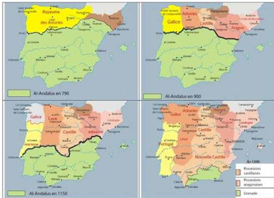
Mapa 3. Cronología de la Reconquista

llevando consigo su romance bastante innovador en comparación con el romance arabizado del sur. Fue de estos pequeños puntos católicos en el norte montañoso de la Península donde partió la reconquista, con la batalla de Covadonga en el 718 en la que el ejército musulmán sufrió una gran derrota y con la cual se liberó de toda sumisión musulmana la región de Oviedo y se creó un pequeño reino de Asturias.