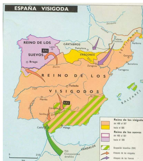
Mapa 2. Península bajo los germanos

En el año 409, los primeros pueblos germánicos, los vándalos, suevos y alanos atraviesan los Pirineos, seguidos por los visigodos en el 416. Los alanos se asientan en Lusitania, pero son aniquilados en poco tiempo (en la nomenclatura, dejan huellas como Puerto del Alano > Huesca) por los visigodos, y los vándalos se asientan en la Bética, pero en poco, expulsados también por los visigodos, pasan a África. Embarcan cerca de Tarifa, por eso se supone que el nombre de Andalucía se refiere a los vándalos: *[Portu] Wandalu , pronunciado por los griegos como *[Portu W] andalusiu , el término en el que origina el árabe al-Ándalus (Lapesa, 1980: 116). Por otro lado, los suevos, situados en Gallaecia, resisten a los visigodos por mucho tiempo. En los comienzos, su reino, con la capital en Braga, es extenso, pero ya alrededor del 570 se va reduciendo bajo la presión visigoda (ver mapa 2).