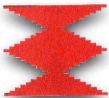
Slika 1: Simbol Pravde

Svaku od 27 energija prati pokret, simbol i zagovor. Tih 27 energija također nazivamo i Beregjinjama i arhetipovima. Osoba ima svoju glavnu Beregjinju, odnosno glavnu energiju, te niz podupirućih energija. Simboli tih energije su nešto što će većina ljudi s našeg područja prepoznati, primjerice, u vezovima na tradicijskoj odjeći, stolnjacima itd. Zagovori su također nešto što postoji u našem jeziku, kroz poštapalice, stihove, izreke i slično. Primjerice, na slici 1 je simbol Pravde, točnije prevedeno s ruskog Istine, sa zagovorom: „Uvijek se sjeti, kako siješ tako ćeš i žeti!“