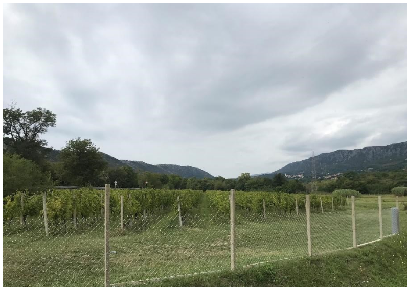
Slika 9. Pogled na vinograde u Pavlomiru, Novi Vinodolski