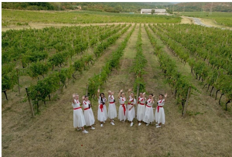
Slika 8. Djevojke “Ružice Vinodola” u vinogradima u Pavlomiru. Objavljeno: 21.8.2022.