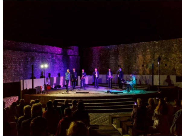
Slika 3.: Prikaz Ljetnog karnevala u Novom Vinodolskom. Objavljeno: 3.7.2022.