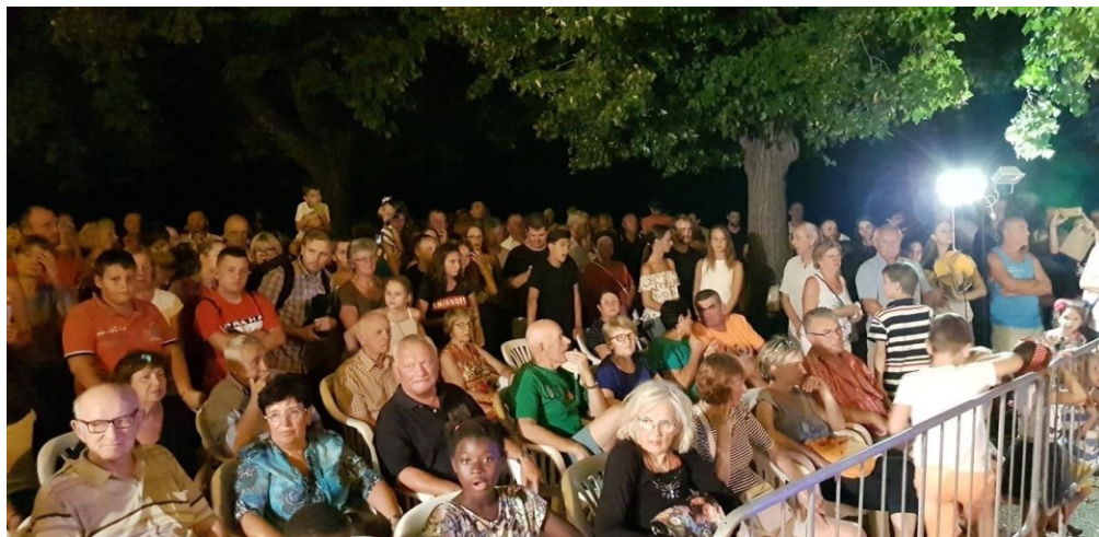
Slika 19. Posjetioци na trgu Precrikva, ispred pozornice. Objavljeno: 19.8.2018.

Drugi dan manifestacije započinje povorkom u središtu grada Novog Vinodolskog, točnije na krajnjoj točki Korza hrvatskih branitelja. Simboličnom povorkom kroz grad, članovi KUD-a “Ilija