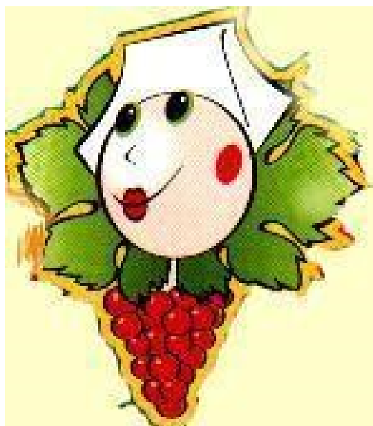
Slika 5. Logo manifestacije “Ružica Vinodola“.