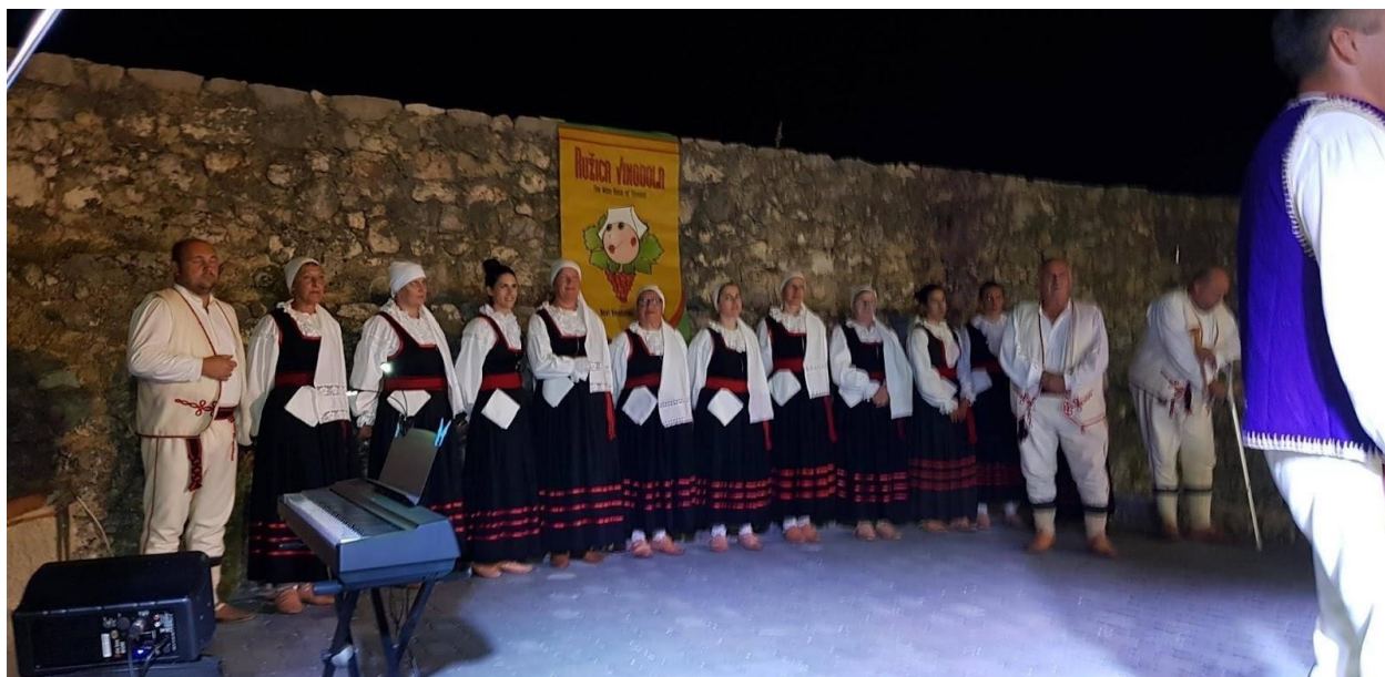
Slika 29. KUD „Bribir“ na ceremoniji predstavljanja natjecateljica ispred bribirske gradine. Objavljeno: 11.8.2018.