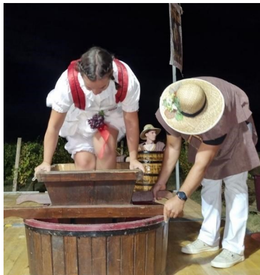
Slika 17. Treća igra: Nožno mašćenje grožđa uz pratnju sudaca. Objavljeno: 19.8.2022.