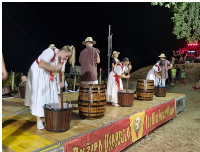
Slika 16. Druga igra: Ručno mašćenje grožđa uz provjeru sudaca. Objavljeno: 19.8.2022.