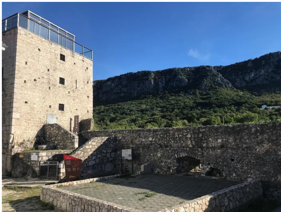
Slika 11. Pogled na bibrsku kulu Turan i ostatke gradine, te pozornicu na kojoj se predstavljaju Ružice