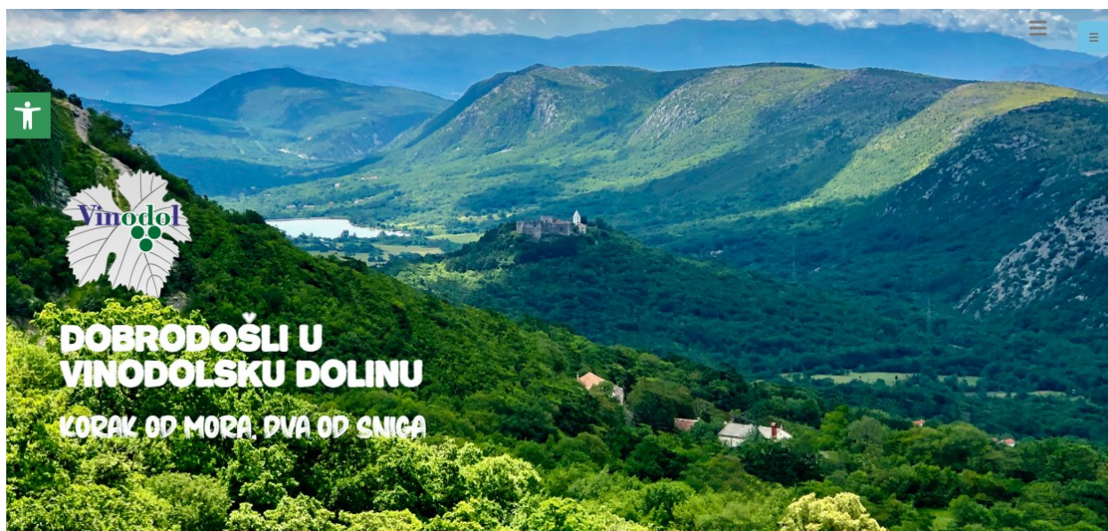
Slika 2.: Prikaz naslovne strane internetske stranice Turističke zajednice Vinodolske općine.

Tek u nekoliko natuknica HTZ predstavlja kulturno nasljeđe Vinodola spominjući glavne ljetne manifestacije Vinodolske ljetne večeri i Ružica Vinodola te zimski Mesopust, zatim muzejsku zbirku važne povijesne umjetničke ličnosti Jurja Julija Klovića i graditeljsku baštinu starih Vinodolaca - vrela i perila. Jednako tako, kulturno nasljeđe je predstavljeno i za grad Novi Vinodolski, naglašavajući najvažniji narodni običaj Novljanski mesopust i kolo kao stoljetnu tradiciju koja se mora doživjeti te posjet Starom gradu, župnoj crkvi, Kaštelu i kuli Kvadrac kao svjedokom frankopanskog razdoblja. Također su navedene i najistaknutije ljetne manifestacije vezane uz povijesno nasljeđe grada i/ili gastronomsku ponudu: Ljetni karneval, Okolotorno, Fešta od kilometra, Ružica Vinodola te Novljanski gušti.