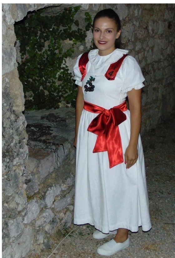
Slika 32. Natjecateljica “Ružice Vinodola” u radnoj nošnji. Objavljeno: 11.8.2018.