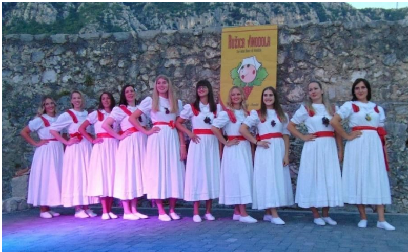
Slika 10. Predstavljanje Ružica na pozornici pred bribirskim Kaštelom. Objavljeno: 10. 8. 2019.