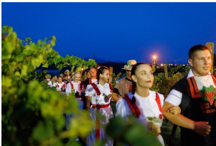
Slika 31. Povorka u Pavlomiru, prvi dan natjecanja. Objavljeno: 21.8.2022.

Kako odjevni predmeti predstavljaju specifičan vizualni element kojim se dodatno naglašava značaj i posebnost “Ružice Vinodola”, svim sudionicima manifestacije propisano je nošenje simboličnih kostima, ali i odore oblikovane po tradiciji novljanske narodne nošnje. 9 Osim KUD-a odjevenog u narodnu nošnju, djevojke koje se natječu za Ružicu odjevene su u bijelu tzv. “radnu odoru”, stiliziranu prema tradiciji ženske novljanske narodne nošnje 10 , točnije berhana . Berhan je nošnja bijele boje, izrađena od pamučnog pikea, koju su nosile mlade djevojke i snahe, a nekada su se u njoj i vjenčale mladenke (Internetski izvor 62). Radna odora Ružice sastoji se od bijele košulje kratkih rukava obrubljenih čipkom, ovratnik i rukavi izvezeni su “na blage