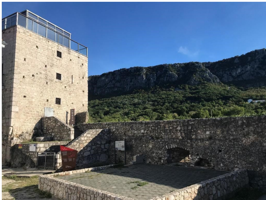
Slika 11. Pogled na bibrirsku kulu Turan i ostatke gradine, te pozornicu na kojoj se predstavljaju Ružice