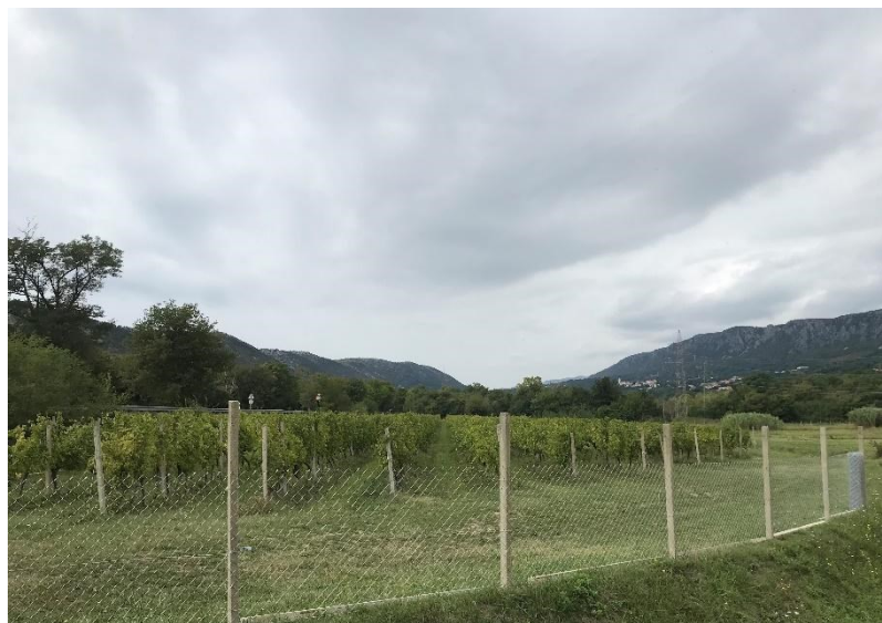
Slika 9. Pogled na vinograde u Pavlomisiru, Novi Vinodolski