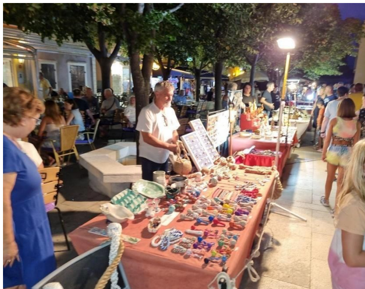
Slika 27. Sajam na Trgu Vinodolskog zakona tijekom manifestacije. Objavljeno: 20.8.2022.

Nadalje, postoji nekoliko primjera obrta predstavljenih na “sajmu” koji su vezani uz srednjovjekovno razdoblje odnosno baziraju se na povijesnom nasljeđu koje aludira na razdoblje frankopanske vladavine ovim prostorima. Na štandovima se nude proizvodi, točnije suveniri koji su tematski oblikovani prema starohrvatskom pismu glagoljici, značajnom kulturno-povijesnom elementu Vinodola. Osim glagoljice, povratak u srednjovjekovno razdoblje Frankopana predstavljaju obrtnici kovači koji u tematski kostimiranoj odjeći nude proizvode načinjene od željeza.