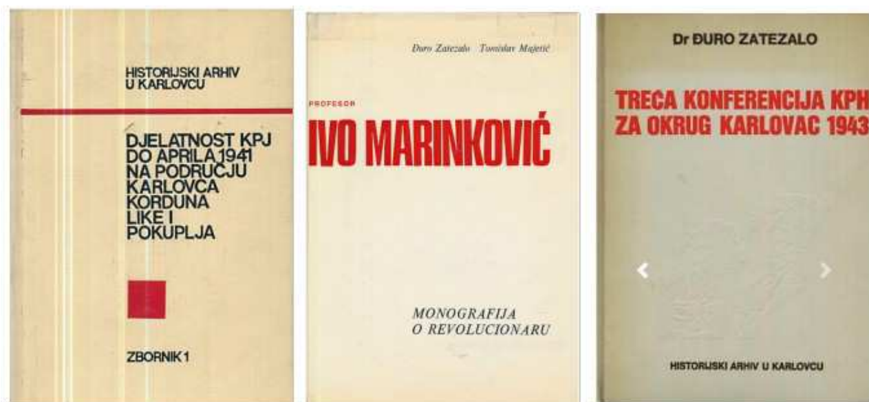
Slika 4. Neka od izdanja Odjela za historiju radničkog pokreta, NOB-a i društveno-političkih organizacija Državnog arhiva Karlovac

ostala izdanja iz ovog razdoblja uključuju posebno izdanje zbornika o Karlovcu, fotomonografiju, katalog izložbe i obljetnička izdanja, za dvadesetu i tridesetu godišnjicu Arhiva. Izdanje za tridesetu obljetnicu iz 1990. godine uvršteno je u ovaj period jer se sljedeća izdanja Arhiva tematski razlikuju. Naime, Arhiv tada započinje sa sustavnim objavljivanjem arhivskih pomagala i zbirki izvornog gradiva.