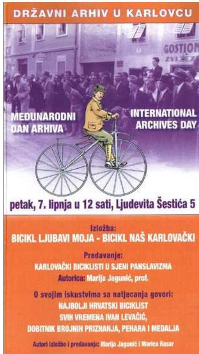
Slika 3. Plakat kojim se promovirao Međunarodni dan arhiva 2019. godine

Nakladnička djelatnost DAKA može se podijeliti u dva razdoblja, od 1969. do 1990. godine kad objavljuje izdanja s povijesnom tematikom s naglaskom na narodnooslobodilačku borbu i socijalističko razdoblje koje je uslijedilo, i na razdoblje od 1990. godine do danas kad DAKA u najvećoj mjeri objavljuje inventare, izvorno gradivo i izdanja kojima obilježava obljetnice Arhiva ili povijesnih događaja.