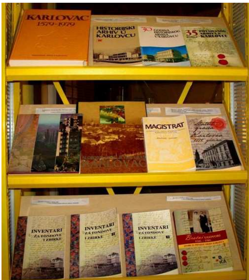
Slika 5. Izdanja Državnog arhiva Karlovac

Nakladnička djelatnost DAKA od 1990. godine orijentirana je na objavljivanje izvornog gradiva, popise gradiva koje Arhiv pohranjuje te na arhivska pomagala poput inventara. Naglasak je na upoznavanju javnosti s građom koju Arhiv čuva, s djelatnostima koje obavlja te na olakšavanju početnog istraživanja korisnicima Arhiva.