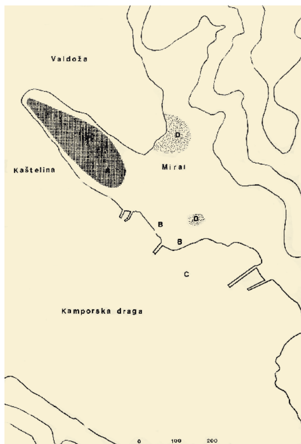
1. Plan širega područja oko poluotoka Kaštelina s naznačenim položajem nepokretnih arheoloških nalaza i toponima po Ž. Tomičiću (Ž. TOMIČIĆ, 1990.)

Map of a wider area around the Kaštelin peninsula, with the indicated location of immovable archaeological finds and toponyms after Ž. Tomičić