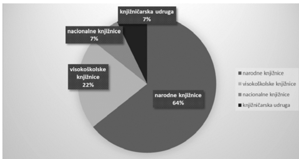
Slika 2. Mrežna mjesta prema institucijama

S obzirom na to da teorijska i istraživačka osnovica za određivanje inkluzivnosti jednoga informacijskog sustava poput mrežnih mjesta sa zavičajnom građom kao takva ne postoji, na ovome istraživačkom korpusu upotrijebljena je kvalitativna metodologija utemeljene teorije (engl. grounded theory ) kako bi se kroz podatke generirane iz analize mrežnih mjesta, postupcima opisivanja, bilježenja, metodom stalne usporedbe i, u konačnici, kodiranja, izveli indikatori inkluzivnosti na temelju kojih je naposljetku moguće zaključivati o inkluzivnosti određenoga informacijskog sustava.