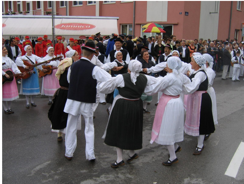
Slika 14: Revijalni nastup tijekom 10. Smotre izvornog folklora Karlovačke županije "Igra kolo". 2006. godina.

Ovisno o odluci organizatora prije ulaska u Frankopanski kaštel, gdje se odvijaju središnji nastupi, kulturno-umjetnička društva ili kraj Parka kralja Tomislava ili unutar samog parka odrade revijalni nastup gdje publici pokazuju dio (najčešće jedno kolo) programa koji će moći kasnije vidjeti kod središnjih nastupa u Frankopanskom kaštelu (Slika 14 i 15).