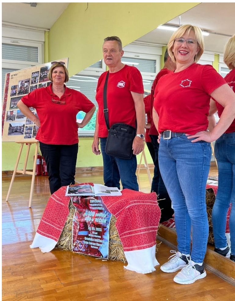
Slika 4: Izložba KUD-a “Rečica” tijekom 27. Smotre izvornog folklora Karlovačke županije “Igra kolo”. 2023. godina.