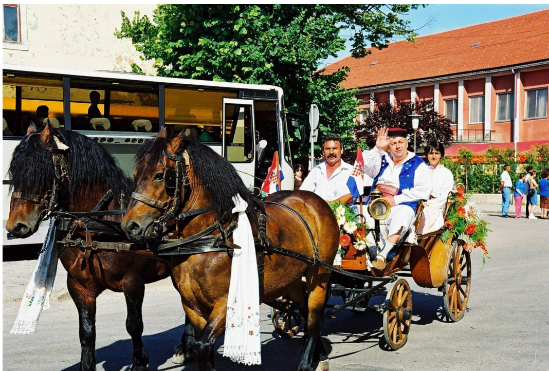
Slika 12: Konjska zaprega tijekom 3. Smotre izvornog folklora Karlovačke županije “Igra kolo”. 1999. godina.