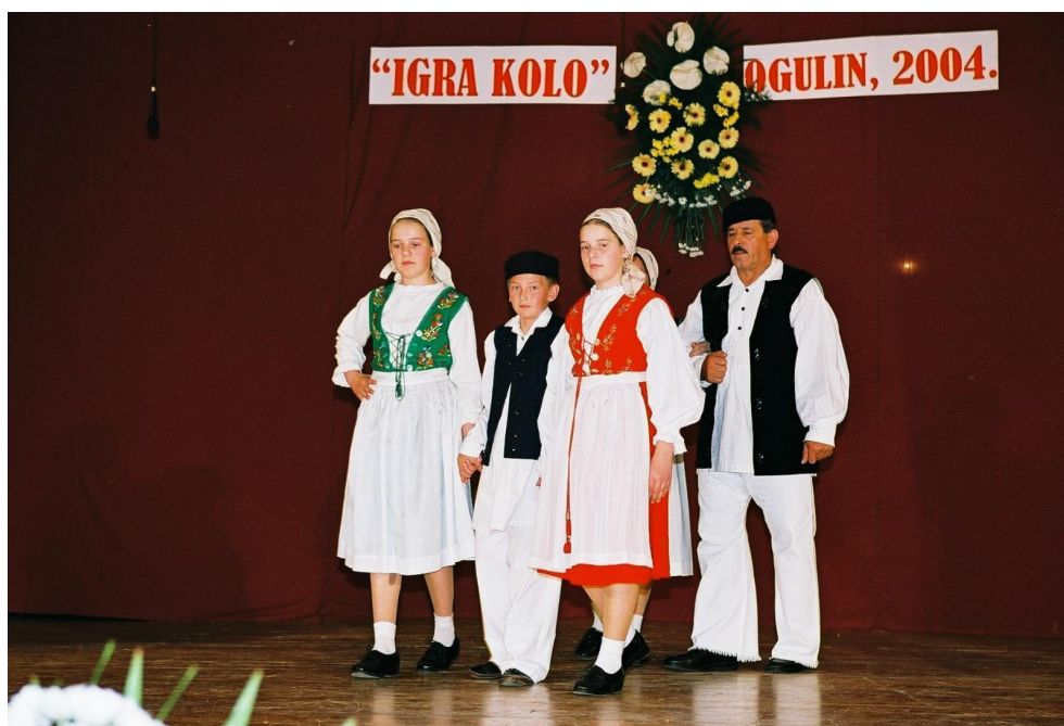
Slika 5: Revija narodnih nošnji tijekom 8. Smotre izvornog folklor Karlovačke županije "Igra kolo". 2004. godina.