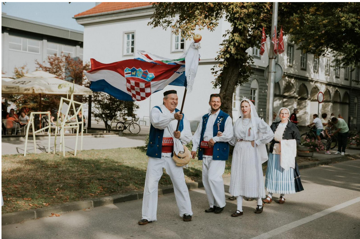
Slika 26: Svadbeni mimohod tijekom 25. Smotre izvornog folklor Karlovačke županije "Igra kolo". 2021. godina.