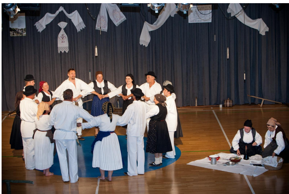
Slika 19: Središnji nastup tijekom 15. Smotre izvornog folklora Karlovačke županije "Igra kolo". 2011. godina.