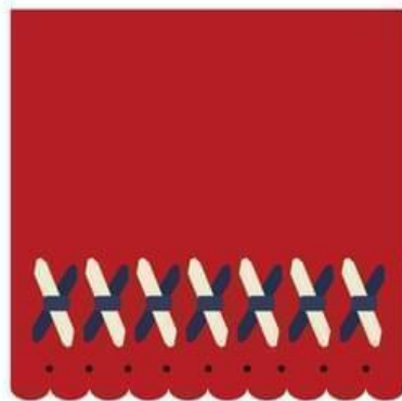
Slika 20: Kvadratić koji simbolizira manifestaciju “Igra kolo”. Autorica Blanka Poljak Franjković.