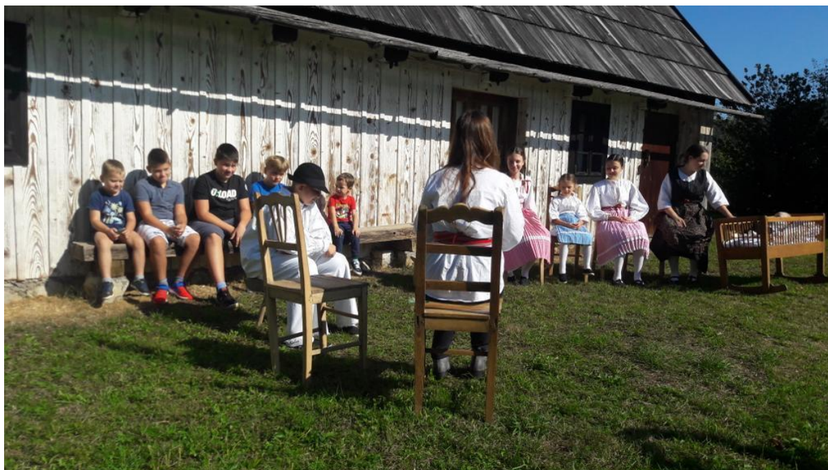
Slika 10: “Priča kolo” tijekom 25. Smotre izvornog folklora Karlovačke županije “Igra kolo” kraj “Etno kuće” u Zagorju Ogulinskom. 2021. godina.