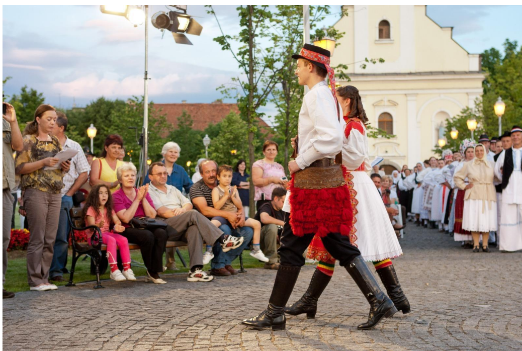
Slika 6: Revija narodnih nošnji tijekom 15. Smotre izvornog folklor Karlovačke županije "Igra kolo". 2011. godina.