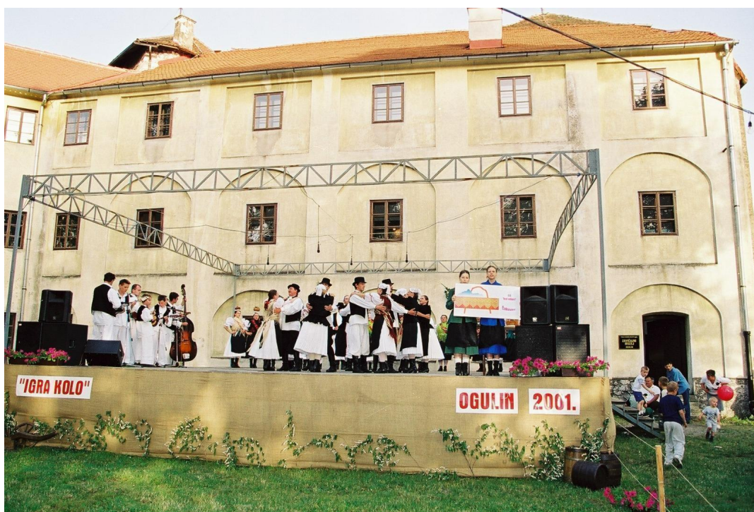
Slika 18: Središnji nastup tijekom 5. Smotre izvornog folklora Karlovačke županije "Igra kolo". 2001. godina.