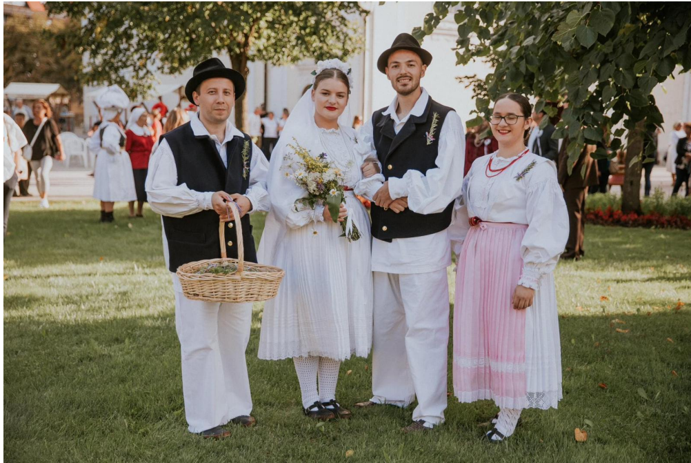
Slika 25: Mladenci, zastavnik i druga tijekom 25. Smotre izvornog folklor Karlovačke županije "Igra kolo". 2021. godina.