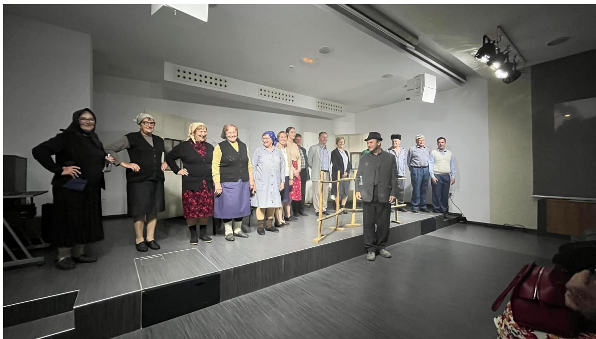
Slika 2: Pučka predstava tijekom 27. Smotre izvornog folklora Karlovačke županije “Igra kolo”. 2023. godina.