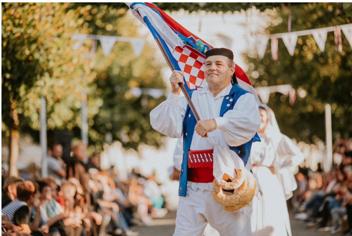
Slika 17: Sudionici uprizorenja svadbenih običaja tijekom 25. Smotre izvornog folklor Karlovačke županije "Igra kolo". 2021. godina.

Zadnjih godina 20. stoljeća lokalne i županijske smotre folklor uvele su ocjenjivački sud koji se sastoji od tri člana, jedan od članova stručnog žirija zadužen je za glazbu, drugi za ples, a treći za narodnu nošnju (Zebec 2008:274). U Hrvatskom leksikonu za smotru navodi se da je "nenatjecateljskog" karaktera (usp. Kelemen i Škrbić Alempijević 2012:28), iako postoji stručni žiri koji procjenjuje kvalitetu nastupa kulturno-umjetničkih društava. Samim time što izvođači dobivaju povratnu informaciju na njihovu izvedbu, postiže se dojam natjecanja. Jednako tako nema dodjele prva tri mjesta, ali često se napravi distinkcija između uspješno i manje uspješno izvedenih nastupa (Zebec 2008:274), što je vidljivo na primjeru Smotre izvornog folklor "Igra kolo". Članovi stručnog žirija su etnolozi, etnomuzikolozi te etnokoreolozi. Oni prate nastupe svih kulturno-umjetničkih društava od početka do kraja te na temelju viđenog daju svoj osobni osvrt na sam nastup (Slika 18 i 19). U Izvješčaju se stručni žiri osvrne na svaku izvedenu pjesmu ili kolo te urednost narodnih nošnji. Također pozornost usmjeravaju na usklađenost plesača i pjevača s tamburašima što je opisala Ružica Salopek: