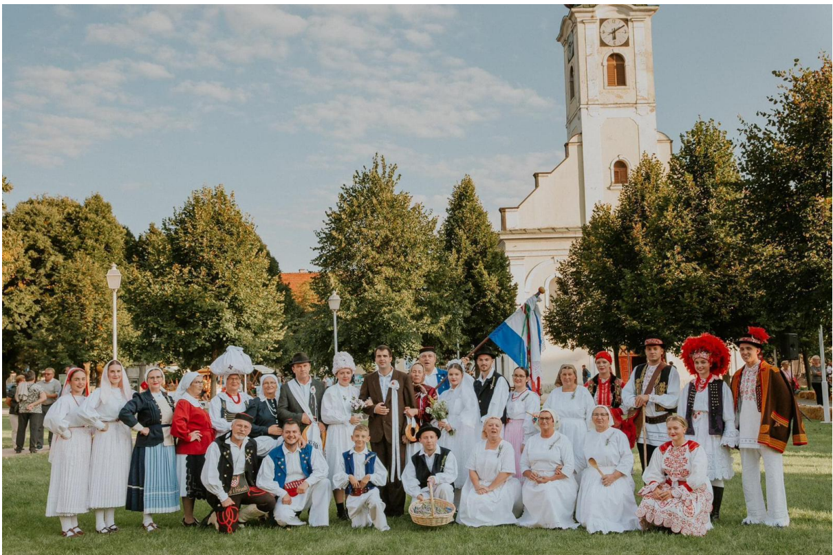
Slika 16: Sudionici uprizorenja svadbenih običaja tijekom 25. Smotre izvornog folkloru Karlovačke županije “Igra kolo”. 2021. godina.

Važan vid izvedbe kojim kulturno-umjetnička društva predstavljaju svoju tradicijsku baštinu središnji su nastupi. Svako društvo koje se prijavi za sudjelovanje na Smotri izvornog folkloru “Igra kolo” mora pripremiti, točnije osmisliti splet pjesama i kola specifičnih za njihov kraj od kuda dolaze. Smotre su najčešće bile bez predodređene tematike, no bilo je i godina gdje su sudionici dobili tematiku te su prema temi Smotre trebali izabrati repertoar s kojim će nastupiti. Jedan od boljih primjera je 25. Smotra izvornog folkloru Karlovačke županije “Igra kolo” kada je Organizacijski odbor za temu odabrao svadbene običaje (Slika 16 i 17). Kako je 25. godina bila jubilarna godina organizatori su htjeli cijelu manifestaciju uveličati i učiniti posebno svečanom. Iz tog razloga odabrali su svadbene običaje jer, kako je Ružica Salopek navela, “što je svečanije od svadbe”.