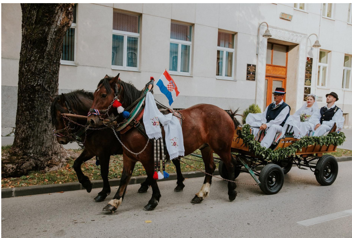
Slika 13: Konjska zaprega tijekom 25. Smotre izvornog folklora Karlovačke županije “Igra kolo”. 2021. godina.