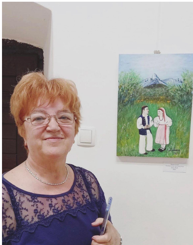
Slika 27: Izložba nastala u suradnji ULAK Karlovac i LD Frankopan tijekom 26. Smotre izvornog folklor Karlovačke županije “Igra kolo”. 2022. godina.

Jedan od primjera kratki je video koji je složio Kino klub Ogulin gdje su u nekoliko minuta prikazali i saželi cijelu 27. Smotru 16 ili izložba “Igra boja” u suradnji ULAK Karlovac i LD Frankopan gdje su prikazani tradicijski motivi (Slika 27). Na ovaj način Pučko otvoreno učilište Ogulin radi na populariziranju tradicijske baštine, približavanju baštine djeci i mladima. Ovim primjerima se tradicijska baština na suvremen način rekreira te pronalazi svoje mjesto kod mlađih generacija i popularnih aktivnosti.