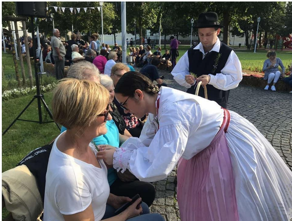
Slika 24: Stavljanje ružmarina publici ("kićenje svadbe") tijekom 25. Smotre izvornog folkloru Karlovačke županije "Igra kolo". 2021. godina.

Održavanjem jubilarne 25. Smotre izvornog folkloru "Igra kolo" postavljena je tema svadbenih običaja kako bi se što svečanije upriličila Smotra. Na dan održavanja revije svadbenog ruha Karlovačke županije publika je imala priliku biti dio "svadbe". Dok je išla zaprega, a na zaprezi mlada i mladoženja, dvoje mladih je kitilo ružmarinom cijelu "svadbu", točnije publiku. Svi gledatelji bili su okićeni ružmarinom te su na taj način postali uzvanicima "svadbe" (Slika 24, 25 i 26).