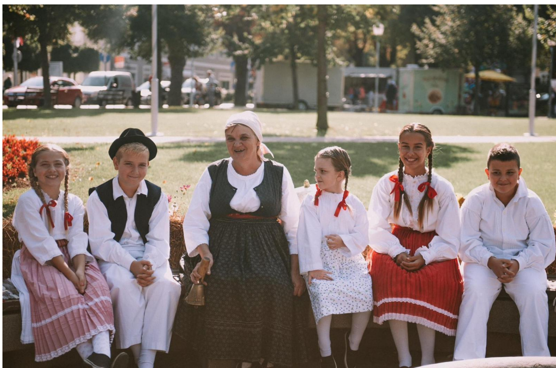
Slika 9: “Priča kolo” tijekom 24. Smotre izvornog folklora Karlovačke županije “Igra kolo” u Parku kralja Tomislava u Ogulinu. 2020. godina.

Događanju “Priča kolo” se iz godine u godinu mijenjala lokacija održavanja. “Priča kolo” se održavalo u centru grada (Slika 9), no zatim je prebačeno u Zagorje Ogulinsko kraj Etno kuće (Slika 10). Samim time je prostor (zapravo priroda) još više dočarao priče i legende koje su se prepričavale. Ovim putem se dio baštine ogulinskog kraja približava djeci već od malih nogu, čime se osigurava njen kontinuitet i promocija.