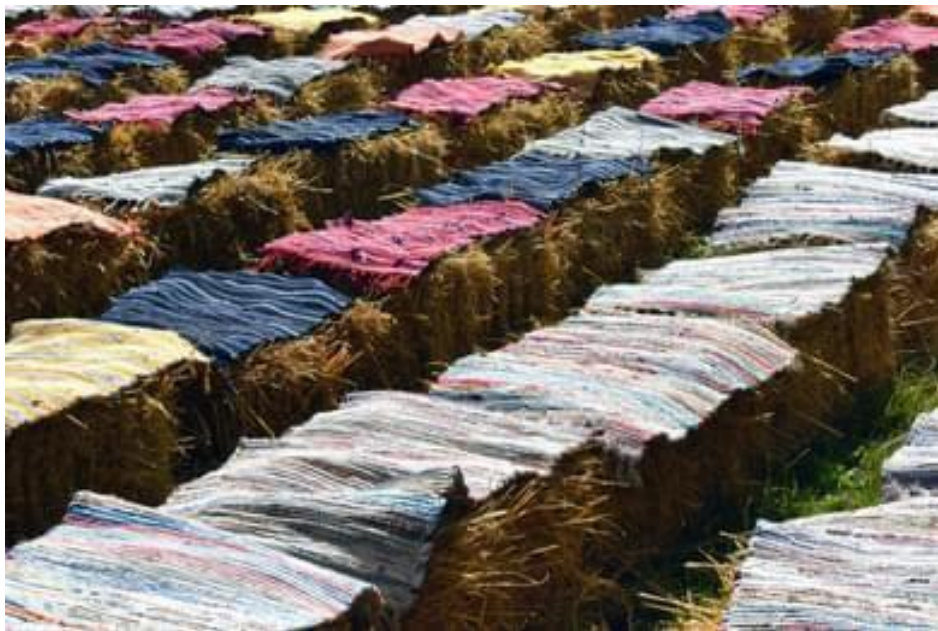
Slika 23: Bale sijena s ručno rađenim tepisima tijekom 26. Smotre izvornog folklora Karlovačke županije “Igra kolo”. 2022. godina.

Nadalje, od 2020. godine počelo se sve više ulagati u izgled grada tijekom manifestacije “Igra kolo”. Već sam navela kako tjelesno iskustvo i percepcija postaju konkretni u prostoru kada iskustvo preoblikujemo u simbole, a simbole u objekte poput “artefakata, gesti ili riječi”, prostor postaje utjelovljen (Richardson 1982, 1984; prema Low i Lawrence-Zuniga 2003:5). Na taj način publici se daje mogućnost da dobiju osjećaj barem jednim dijelom da se nalaze u drugom vremenu, ali i da urbani prostor u kojem svakodnevno borave dožive na drugačiji način. Tijekom 25. Smotra izvornog folklora “Igra kolo” održana je svečana svadbena povorka. Osim što su članovi kulturno-umjetničkih društava doprinijeli svojim narodnim nošnjama izgledu grada, Organizacijski odbor odlučio je postaviti bale sijena za sjedenje. Preko tih bala stavljeni su i tradicijski tepisi. Navedeni rekviziti ostali su dio Smotre i nakon 2021. godine (Slika 23). Osim što su postavljene bale za sjedenje, iste godine započelo se i s održavanjem natjecanja u izradi najbolje ogulinske masnice 15 koja pripada tradicijskim jelima ogulinskog kraja. Na taj je način publika mogla okusiti tradicijsko jelo, sjedeći na balama sijena te gledajući reviju narodnih nošnji. Na taj je način grad „izišao” iz svoje svakodnevne rutine te postao nešto nesvakidašnje.