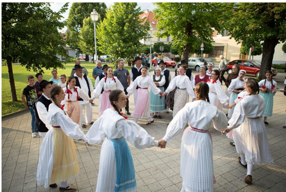
Slika 15: Revijalni nastup tijekom 21. Smotre izvornog folklora Karlovačke županije "Igra kolo". 2017. godina.