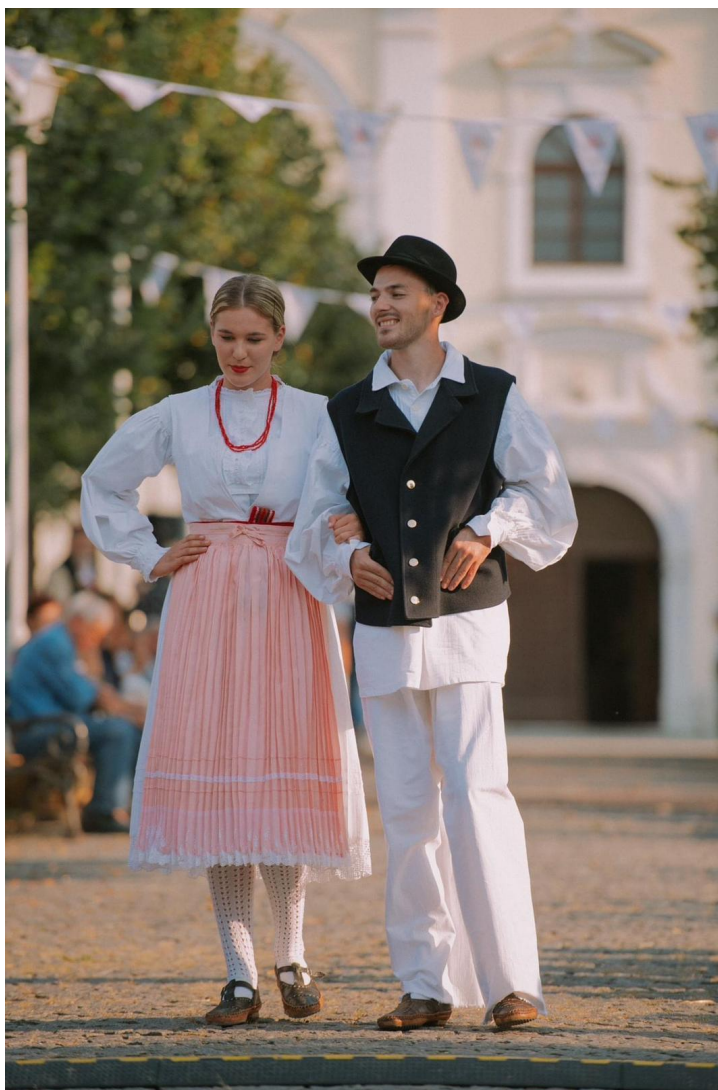
Slika 7: Revija narodnih nošnji tijekom 24. Smotre izvornog folklora Karlovačke županije "Igra kolo". 2020. godina.

Na fotografijama koje prikazuju revije narodnih nošnji (Slika 5, 6, 7) vidljivo je kako su se tijekom 27 godina revije održavale u različitim ambijentima, otvorenim i zatvorenim prostorima kao što su gradski parkovi ili dvorane. Održavanje revija tradicijskog ruha na otvorenom, odnosno u zatvorenom prostoru ima svoje specifične karakteristike. Revija tradicijskog ruha na otvorenom prostoru, prema doživljaju sudionika, omogućuje autentičnu atmosferu, povezanost s prirodnim okolišem. To može dodatno naglasiti autentično iskustvo pojavljivanja u narodnim nošnjama, iako se revija održava u gradskoj sredini. Otvoreni prostori su također prostraniji od dvorana pa samim time može primiti veći broj gledatelja i sudionika, ali i privući slučajne prolaznike. Ipak, zatvoreni prostor pruža prednost u slučaju vremenskih nepogoda.