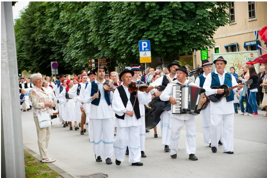
Slika 11: Svečani mimohod tijekom 15. Smotre izvornog folklora Karlovačke županije “Igra kolo”. 2011. godina.

Na prvim Smotrama mimohod je uvijek sadržavao zaprege (Slika 12), no kako je sve manje ljudi imalo konje, došlo je do toga da zaprege više nisu bile sastavni dio manifestacije “Igra kolo”. Sve se promijenilo 2021. godine kada je je zaprega opet uvedena (Slika 13). No od 2021. godine najčešće samo jedna konjska zaprega sudjeluje u manifestaciji, što je povezano sa smanjenjem broja kućanstava koje se primarno oslanjaju na primarni sektor djelatnosti, odnosno smanjenjem broja kućanstava koja imaju konje.