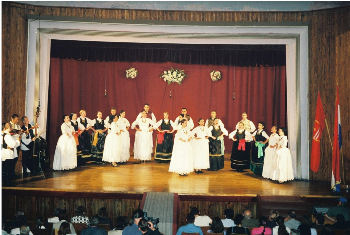
Slika 8: Koncert tijekom 5. Smotre izvornog folklora Karlovačke županije “Igra kolo”. 2001. godina.

Od 1997. do 2002. te 2010. godine sastavni dio Smotre bili su koncerti na kojima su nastupala kulturno-umjetnička društva unutar i van Karlovačke županije izvodeći svoje običaje, pjesme i kola , pri čemu su zabavljali publiku te uveličali cijelu manifestaciju posvećenu tradicijskoj baštini 8 (Slika 8).