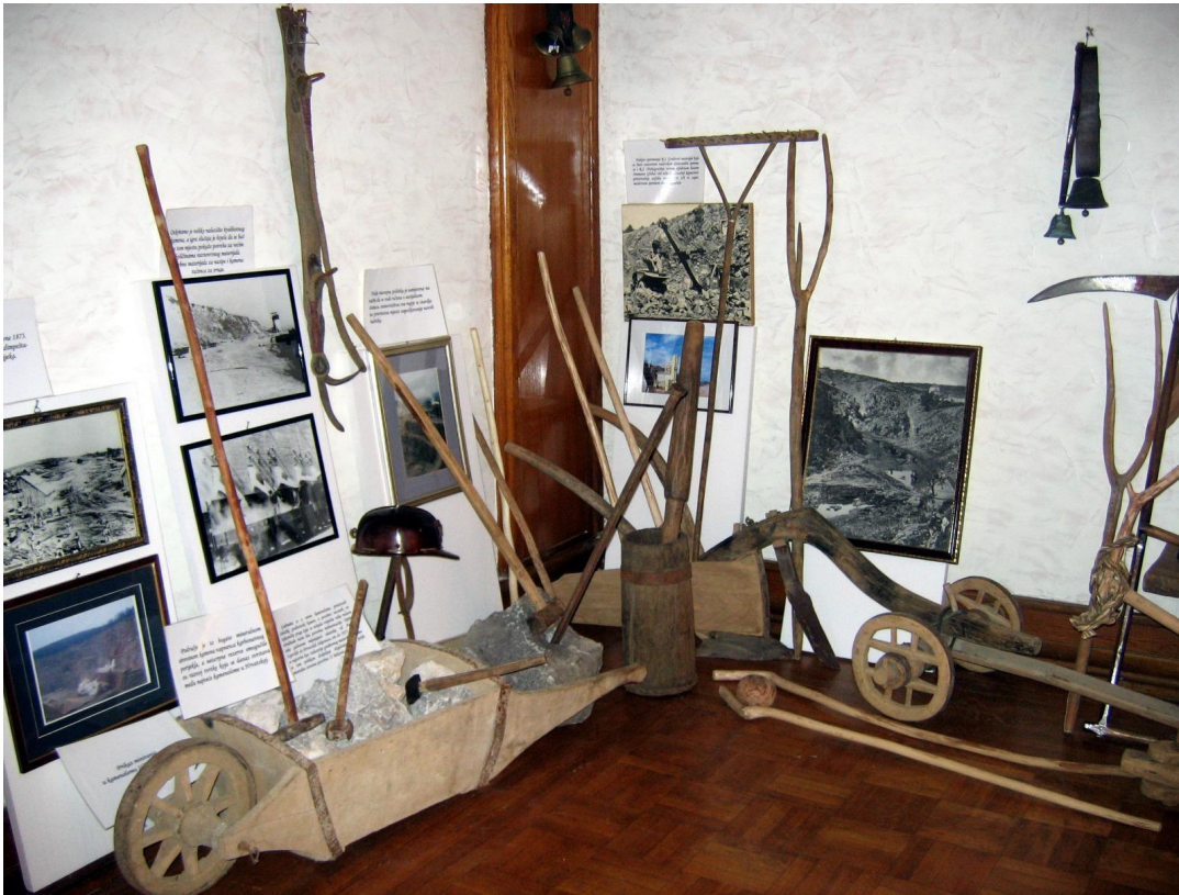
Slika 3: Izložba KUD-a "Tounjčica" Tounj tijekom 10. Smotre izvornog folklora Karlovačke županije "Igra kolo". 2006. godina.

zavičaja. Na taj način izložbe postaju medij kojima se tradicijska baština prenosi u suvremenost.