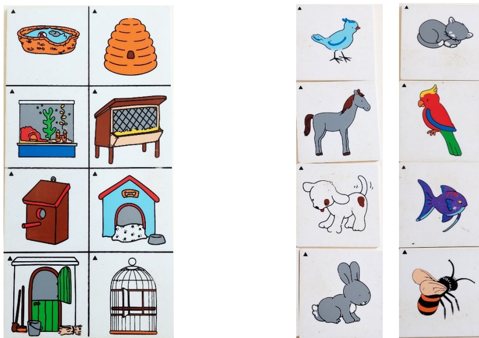
Prilog 2. Materijal za prikupljanje podataka predškolskih skupina ispitanika – memory ploča (lijevo) i kartice (desno) tko gdje spava/živi .