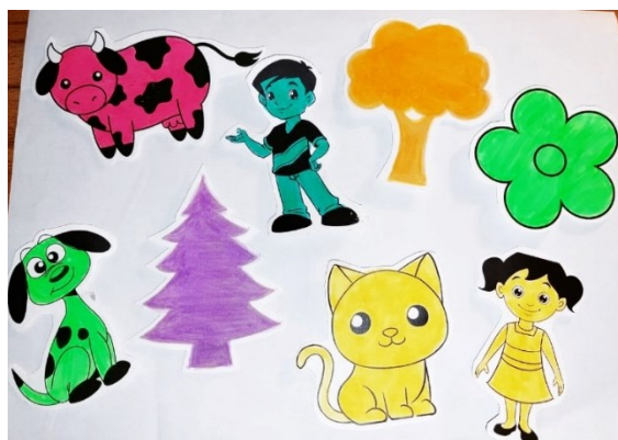
Prilog 4. Materijal za prikupljanje podataka predškolskih skupina ispitanika – smještanje likova životinja, biljaka i ljudi na papir A4 formata.