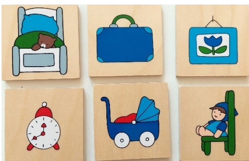
Prilog 5. Materijal za prikupljanje podataka predškolskih skupina ispitanika – ploča s prikazom prostorije (spavaća soba) (lijevo), pločice s predmetima (desno).