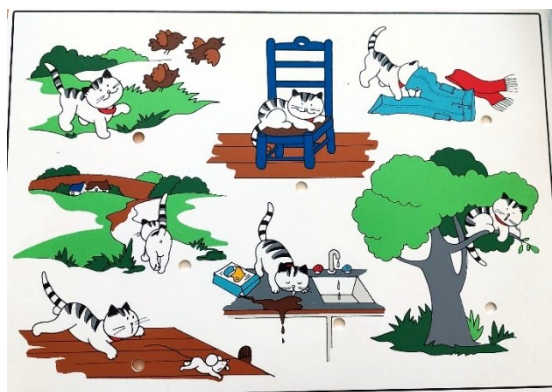
Prilog 3. Materijal za prikupljanje podataka predškolskih skupina ispitanika – slikovna priča na ploči Maca u prirodi .