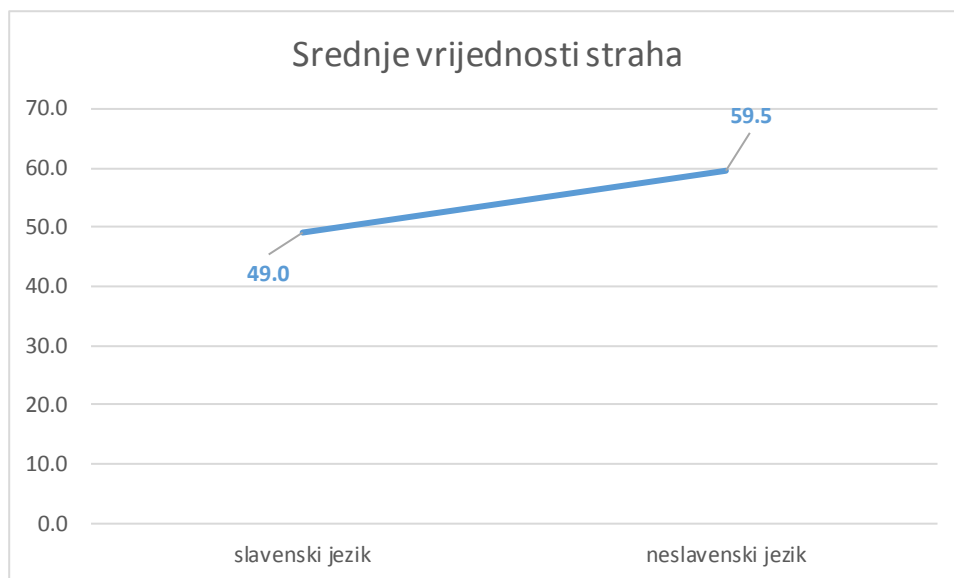
Slika 2. Razlika u srednjim vrijednostima straha od jezika kod polaznika Croaticuma koji su govornici slavenskih i neslavenskih jezika

Na Slici 2 vidimo smjer razlike koji potvrđuje našu hipotezu da je strah od jezika kod polaznika Croaticuma manji kod onih koji su govornici slavenskih jezika nego kod onih koji nisu.