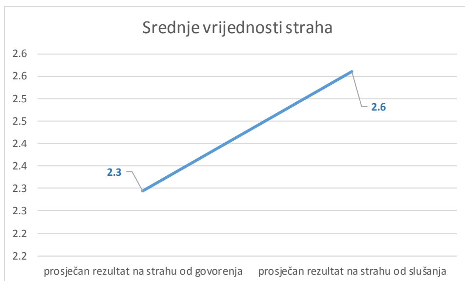
Slika 1. Razlika u srednjim vrijednostima straha od govorenja i straha od slušanja kod polaznika Croaticuma.