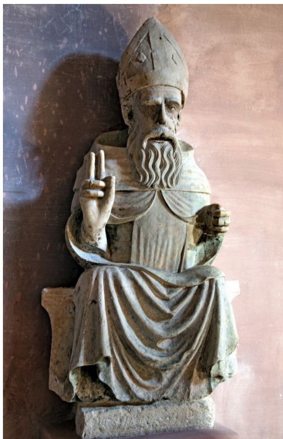
Slika 21: Sv. Antun Opat , XV. – XVI. stoljeće, kamen, Kripta župne crkve Pohodjenja Blažene Djevice Marije, Bale

Kameni kip sv. Antuna Opata koja se nalazi u kriпти župne crkve u jedna je od manje istraženih skulptura gotičkog razdoblja u Balama. Iako je njezin trenutni smještaj u kriпти župne crkve, ona se originalno nalazila u prostorima stare župne crkve, iako njezin točan položaj nije poznat. Pretpostavlja se da se tijekom izgradnje nove crkve 1882. godine ta skulptura premjestila iz svojeg izvornog smještaja u kriptu, 94 gdje sad stoji kao jedan od glavnih izložaka crkvenoga lapidarija, koji je otvoren za posjetitelje.