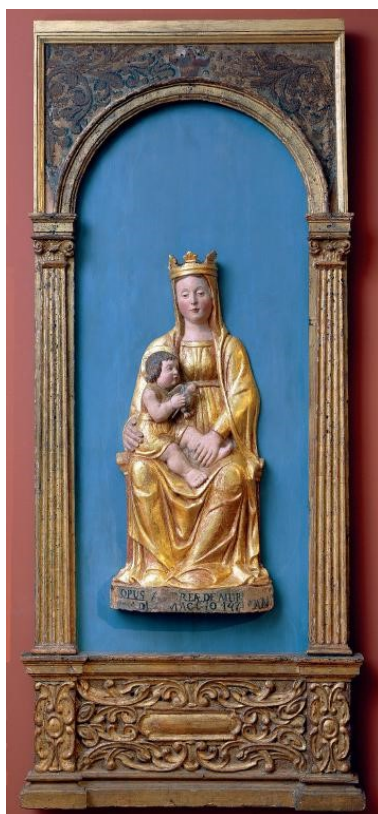
Slika 12: Andrea da Murano, Bogorodica s Djetetom , kraj XV. stoljeća, Samostan i crkva svetog Frane, Cres