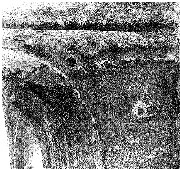
Slika 20: Reljef ljudske glave na kapitelu kvadrifore, početak XVI. stoljeća, Palača Soardo-Bembo, Bale

Prikaz lava svetog Marka je relativno uobičajen primjer skulpture ove tematike. Tankom, zupčastom trakom uokviren je krilati lav sv. Marka, koji kao simbol Mletačke Republike, drži tri noge na tlu te prednjom lijevom nogom pridržava knjigu na kojoj u pravilu piše Pax tibi Marce, evangelista meus (lat.: Mir tebi, Marko, moj evanđeliste), 92 što se u slučaju baljanskog reljefa ne može razaznati. Lav je relativno spretno proporcioniran, te su mu noge vješto i pravilno isklesane. Glava kruškolikog oblika je na vrhu obrasla stiliziranim početkom lavlje grive koja se u pravilnom usmjerenju spušta niz leđa i prednje noge. Glavu također krasi pomalo nespretno isklesane oči, te trapezoidna njuška sa dvije nosnice, koje su (pretpostavlja se) izrađene sa svrdlom. 93 Klasično za prikaz mletačkog lava, isklesana su mu također i krila, čije su proporcije i položaj podređene ograničenom pravokutnom formatu. Lav također stoji na tek naznačenom odsječku tla, koji je isklesan u donjem desnom kutu reljefa.