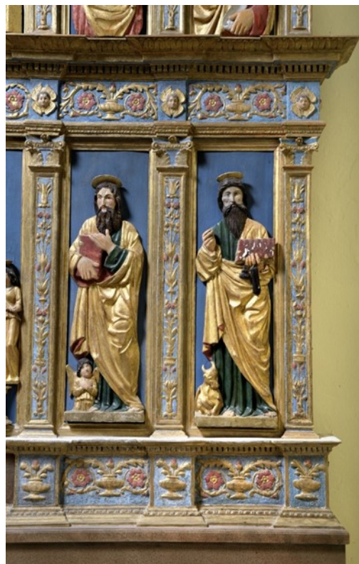
Slike 25 i 26: Oltarni poliptih (detalj), početak XVI. stoljeća, drvo, polikromirano, pozlaćeno, župna crkva Pohodenja Blažene Djevice Marije, Bale

U gornjoj zoni poliptiha se u centralnom dijelu nalazi prikaz Imago pietatis , mrtvog Kristovog tijela kojeg iz grobnog sarkofaga izvlače i pridržavaju sv. Ivan i Marija. 101 Lik krista je anatomski relativno vješto izrađen te je težina mrtvog tijela prikazana uvjerljivo. Na desnoj se strani tijela ističe rana od koplja iz koje teče krv. Donji dio Kristova tijela prekriven je plavkastom draperijom, s nizom vodoravnih, blago lomljenih nabora. Lice mu je nježno i spokojno, a glavu mu uokviruju valovita smeđa kosa i brada, što prati obradu kose i brade ostalih skulptura na poliptihu. Likovi Marije i Ivana prate način izrade likova Bogorodice i