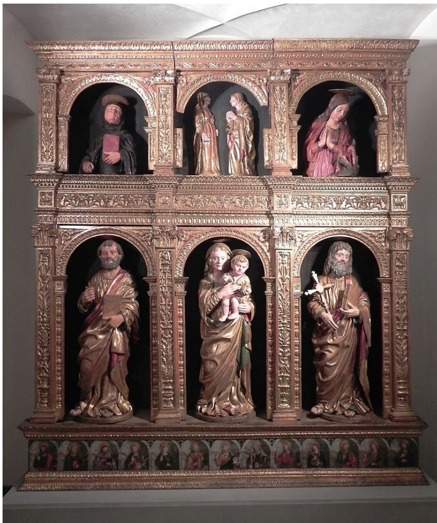
Slika 30: Pietro Bussolo, Poliptih sv. Andrije , 1495. – 1501., Museo Adriano Bernareggi, Bergamo

Naravno, u usporedbi Bussolovih i baljanskog poliptiha, nalazimo i mnoge razlike: primjerice u obradi lica kod Bussola uočava se veća doza realizma i individualizacije likova, dok na baljanskom poliptihu možemo razaznati određenu idealizaciju, zaglađenost i manjak »duboke« individualizacije. Naravno, i u ovom slučaju usporedbe moramo biti svjesni mnogih preinaka koje je baljanski poliptih pretrpio kroz stoljeća, što ostavlja otvorenu mogućnost veće sličnosti baljanskog poliptiha sa drugim skulpturama iz Bussolova repertoara, ali i šire. Ivan Matejčić navodi kako u kontekstu reljefa na baljanskom poliptihu, sličniji reljefi od Bussolovih nisu još otkriveni. Ta činjenica navodi na mogućnost izrade baljanskog poliptiha u krug lombardsko-venetskog drvorezbarstva. Međutim, to je pitanje još otvoreno i neodgovoreno. 128