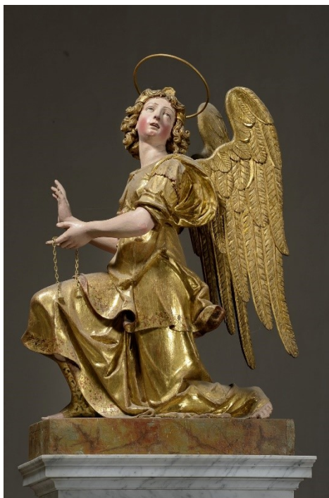
Slika 2: Francesco Terilli, Glavni oltar (detalj: kip desnog anđela), 1616., Vodnjan, župna crkva svetog Blaža

skraćenjima na skulpturama, svježi zrak renesanse se također može primjetiti u ponovnom uvođenju mitoloških tema i likova, kao na portalu južnog zida pulske katedrale. 21 Također, u tom se razdoblju javljaju kiparske radionice koje su nadahnutne novim stilom, kao što je radionica Paola Campse, za koju se smatra da je bila najproduktivnija venecijanska radionica figuralne skulpture toga razdoblja, a koja je i prije izrađivala skulpture u gotičko-renesansom stilu. 22 Ako se osvrnemo na skulpturu kasne renesanse u Istri, možemo govoriti o relativno limitiranom broju skulptura nastalih krajem XVI. i početkom XVII. stoljeća. Međuz njima se kakvoćom izvedbe ističe par anđela u župnoj crkvi u Vodnjanu, pripisan Francescu Terilliju, no te su skulpture u Vodnjan najvjerojatnije dospjele iz neke venecijanske crkve tek u XIX. stoljeću. 23 Iako je broj renesansnih skulptura u Istri podosta manji od gotičkih kiparskih ostvarenja, te su skulpture kvalitetne izrade i većinom djelo sposobnih i iskusnih ruku.