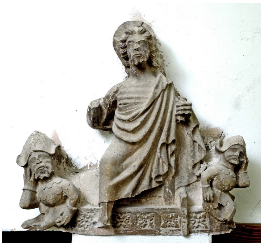
Slika 6: Uskrsnuće Kristovo , sredina XV. stoljeća, vapnenac, župna crkva Pohodenja Blažene Djevice Marije, Bale

Kao što je već prethodno spomenuto, župna je crkva u Balama prošla kroz fazu obogaćivanja i obnavljanja crkvene opreme tijekom XV. stoljeća. Iz tog je razdoblja, kao jedan od najbolje sačuvanih svjedočanstava te faze, sačuvana spomenuta skulptura Arkandžela Gabrijela iz 40-ih godina XV. stoljeća, dok drugo predstavlja upravo ova skulptura koja prikazuje Uskrsnuće Kristovo. 43 Ona se trenutno nalazi iznad vrata koja vode u kriptu i sakristiju, u hodniku u sjevernoj strani crkve. Kao i u slučaju skulpture Arkandžela Gabrijela, rukopisni zapis iz vremena gradnje nove baljanske župne crkve koji prenosi Branko Marušić (1983.) otkriva kako je i ovaj reljef bio dio portala stare crkve. 44