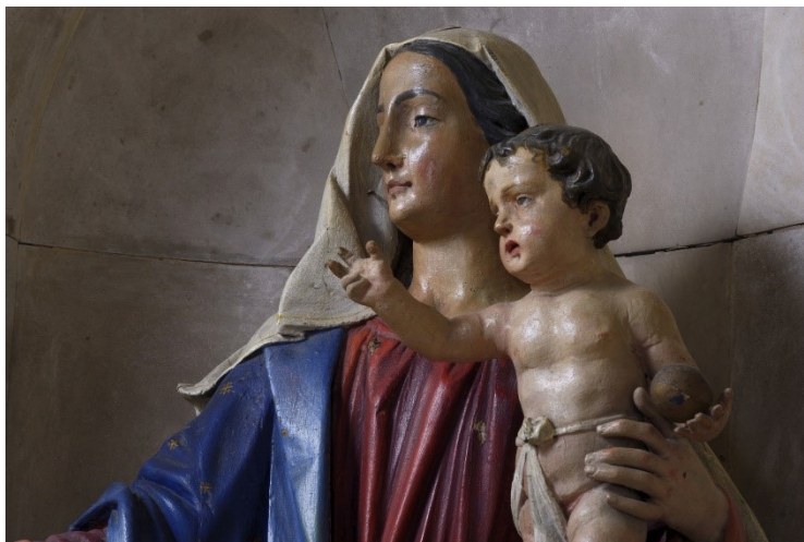
Slika 31: Gospa od Karmela (detalj), sredina XVIII. stoljeća, drvo, polikromirano, župna crkva Pohodaenja Blažene Djevice Marije, Bale

Zanimljivo je da pozicija ove skulpture prati tendencije koje su već poznate iz drugih crkava u Istri, primjerice u Pazinu i Rovinju, a to je nasuprotno postavljanje bratovštinskih oltara. Naime, oltar Gospe od Karmela u novoj župnoj crkvi u Balama bio je postavljen točno nasuprot onome Gospe od Ružarija. Damir Tulić (2017.) navodi kako je pri tome riječ o svjedočanstvu »pučkog pijeteta«, ali i još jednog »ljudskijeg« razloga, a to je konstantno i konzistentno nadmetanje dvaju bratovština koje ujedno predstavljaju i dvije najvažnije poslijetridentske marijanske pobožnosti. 131