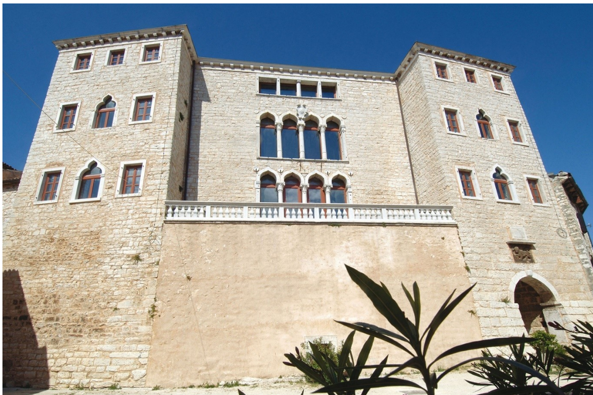
Slika 19: Palača Soardo-Bembo, prva polovica XVI. stoljeća, Bale

Ono što bi hipotetski moglo kronološki povezati ovaj reljef s izgradnjom palače je sličnost izrade lavlje glave i male ljudske glave, uklesane na središnjem kapitelu gornje kvadrifore. 90 Ta je mala skulptura okarakterizirana kruškolikom glavom, trapezoidnim nosom, gustim čupercima kose, te karakterističnim izbušenim rupicama kod usta i nosa, što je prisutno i kod reljefa lava, što navodi Predraga Markovića na dvije različite teze. Prva teza je da je reljef lava nastao istovremeno kao i reljef na kapitelu, što bi smjestilo dataciju reljefa lava u prvu četvrtinu XVI. stoljeća. Druga teza je da je ipak reljef lava nastao nešto ranije (vjerojatno 1497. godine) te da su kipari koji su radili na rekonstrukciji i gradnji palače koristili reljef lava kao predložak za druge skulpture na pročelju palače. 91 Marković se više priklanja tezi da je reljef lava nastao ipak nešto ranije te da se koristio kao predložak za skulpture koje su nastale u nadolazećim desetljećima, međutim ne isključuje prvu tezu kao mogućnost, s obzirom na ograničene povijesne podatke.