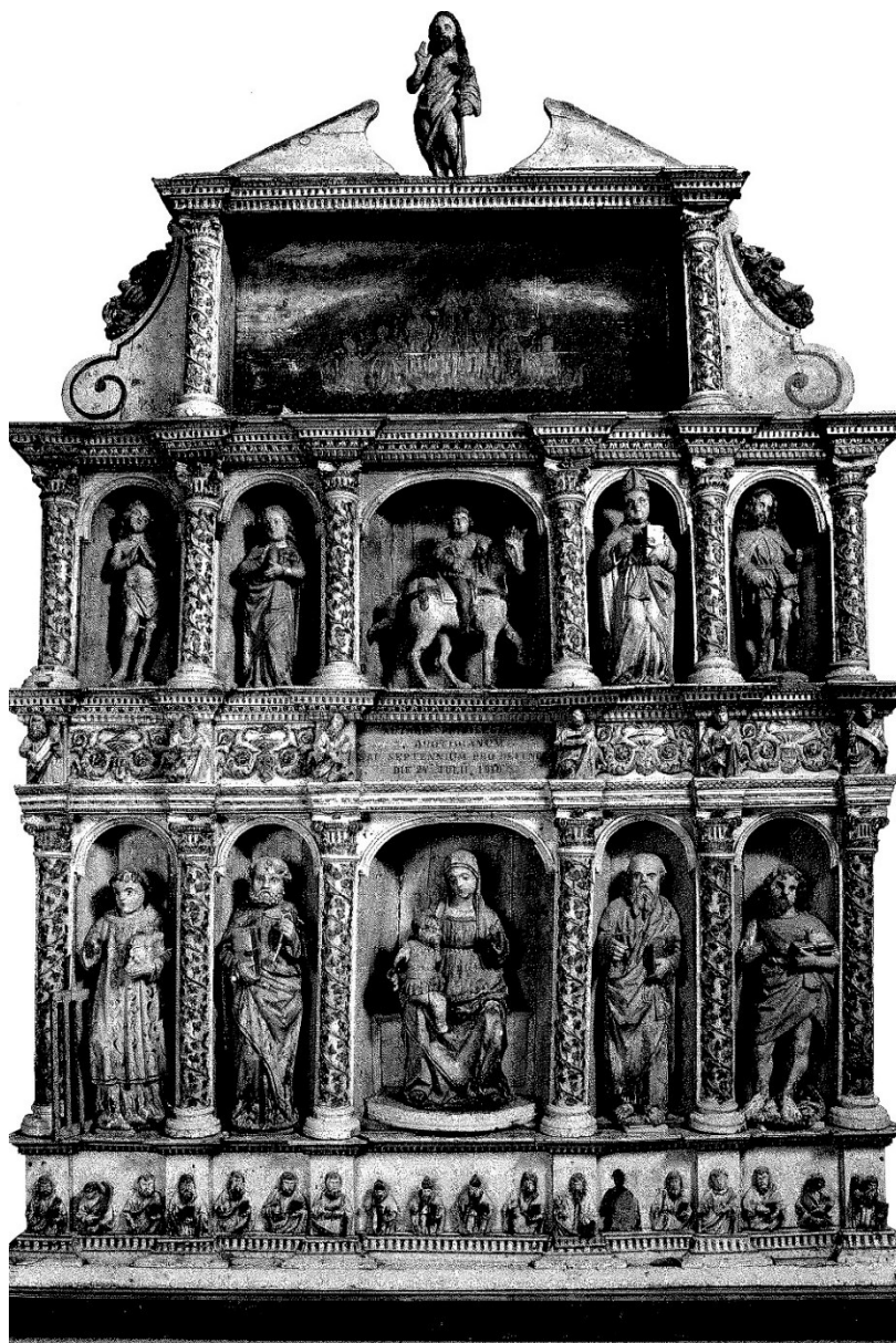
Slika 17: Poliptih, kraj XV. ili početak XVI. stoljeća, župna crkva sv. Martina, Sveti Lovreč

zajedno s predelom bile dio poliptiha, na kojem je središnji prikaz bio upravo već spomenuti reljef Bogorodice s Djetetom ili takozvana Madona od Mon Perina . Ono što dodatno osnažuje ovu tezu je podudaranje u veličinama, načinima oblikovanja lica figura na reljefima i način obrade odjeće. 79 Također, reljef Poklonstva kraljeva je jednake širine kao i reljef Bogorodice s Djetetom, što bi ga u hipotetskoj rekonstrukciji poliptiha smjestilo kao središnju ploču predele. 80