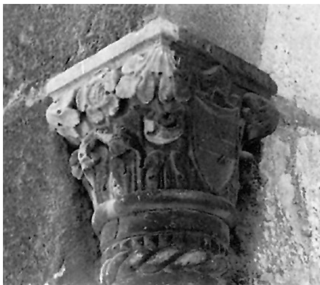
Slika 5: Kapitel s grbom biskupa Domenicha de Luschija, 1431. godina, bočni ulaz trijema Komunalne palače, Pula

akantov list, koji je simetrično razdijeljen. Vrhovi resa su kuglastog oblika i ukrašeni su svojevrsnim plodovima koji podsjećaju na grožđe te su razdijeljeni na vanjski dio konzole, dok se po samoj sredini ističe isklesani cvijet sa tučkom u sredini poveće glave cvijeta. 37 Predrag Marković smatra kako skulptura svojim krutim stavom i mekim modeliranjem volumena, te karakterističnim oblikovanjem lica Arkandela Gabrijela, odiše arhaičnošću, tj. mletačkim kiparstvom sredine XIV. stoljeća. 38 Međutim, ono što odmiče ovu skulpturu od venecijanskog skulpturalnog trecenta je karakteristično oblikovanje detalja na lisnatoj konzoli, koje se počelo javljati od 30-ih godina XV. stoljeća duž istočne jadranske obale, a najbliži primjer je na kapitelima bočnih vrata trijema Komunalne palače u Puli iz 1431. godine. 39