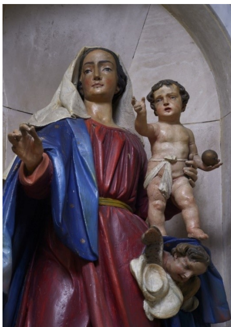
Slika 33: Gospa od Karmela (detalj), sredina XVIII. stoljeća, drvo, polikromirano, župna crkva Pohoda Blažene Djevice Marije, Bale

smatra da je majstor skulpture iz Bala dobro upoznat upravo s djelima i rješenjima Venecijanskog seicenta , poglavito djelima Giusta Le Courta i Giacomina Piazzette. Upravo su Piazzetine skulpture Gospe od Ružarija iz Museo Diocesiano u Feltreu ili iz crkve San Larazzo u Trevisu mogle služiti kao predložak za kerubina koji istovremeno drži Gospin plašt i tvori postolje za malog Isusa. Međutim, očit je i određeni odmak skulpture iz Bala od primjera venecijanskog seicenta . Draperija je naglašeno manje voluminozna od Venecijanskih skulptura druge polovice XVII. stoljeća te su nabori umjereni i nedramatični, a plašt i veo su rezbareni u jednostavnijim plohama. Marijino je lice pravilno i neekspresivno, a pokret joj je suptilan, umjeren i umirujući. Upravo su te razlike ono što odmiče skulpturu iz Bala od venecijanskog seicenta i približava je venecijanskom klasicizmu sredine XVIII. stoljeća. Važno je napomenuti, kako i Damir Tulić navodi, da je ova skulptura zbog svih svojih već navedenih karakteristika možda i najmonumentalnija skulptura Djevice Marije iz XVIII. stoljeća u Istri. 133