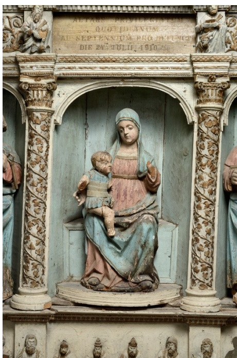
Slika 11: Bogorodica s Djetetom (detalj oltarnog retabla), XV. – XVI. stoljeće, župna crkva svetog Martina, Sveti Lovreč