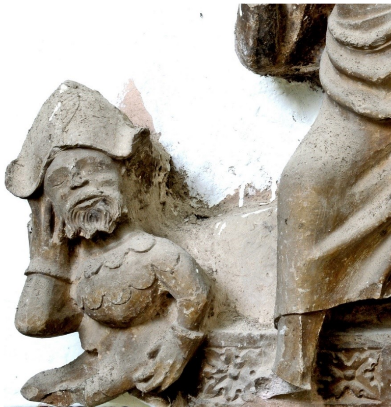
Slika 7: Uskrsnuće Kristovo (detalj), sredina XV. stoljeća, vapnenac, župna crkva Pohodenja Blažene Djevice Marije, Bale

Oblikovanje kose lika Krista može se usporediti s obradom kose reljefa Arkandela Gabrijela iz 40-ih godina XV. stoljeća. Međutim, u usporedbi s reljefom Arkandela Gabrijela, ova je skulptura niže kvalitete izrade i slabijeg pristupa volumenu i proporcijama likova, što navodi na pretpostavku da se radi o majstoru slabijih sposobnosti koji je djelovao u isto vrijeme, što smješta dataciju izrade ove skulpture u sredinu XV. stoljeća. 51