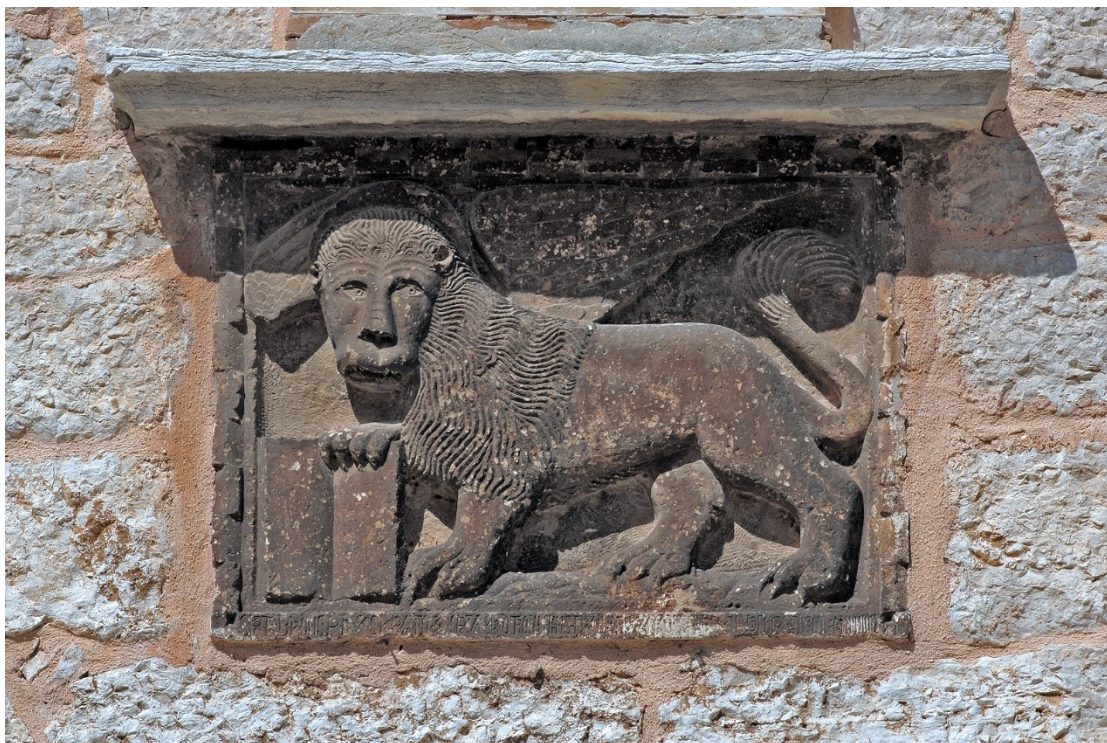
Slika 18: Lav sv. Marka, 1457. (?); prva četvrtina XV. stoljeća (?), kamen, Palača Soardo-Bembo, Bale

Unutar konteksta nastanka nove palače kroz jedinstvenu rekonstrukcijsku fazu nalazi se upravo nastanak reljefa lava svetog Marka na pročelju južnog krila palače, iznad volte i prolaza koji vodi u stari grad. Upravo je na ovom očitom i dobro vidljivom mjestu postavljen ovaj reljef, kao svojevrsan simbol i potvrda istinskog vlasnika i graditelja ove palače – Serenissima . 87 Na rubnoj traci koja uokviruje reljef nalazimo oštećen natpis, izrađen u stilu gotičkih velikih slova nepravilnog oblika. S obzirom na razinu oštećenja natpisa, on nikada nije bio razazan u potpunosti, tako da se ni sa sigurnošću ne može dokučiti period u kojemu je ovaj reljef nastao. 88 Međutim, kroz oštećenja mogu se razaznati određene linije te se nazire najvjerojatnija godina nastanka 1457. godine. 89