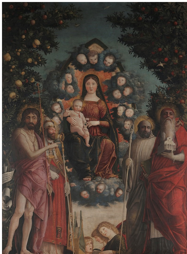
Slika 29: Andrea Mantegna, Pala Trivulzio , 1497. godina, Pinacoteca del Castello Sforzesco, Milano

Upravo je u toj regiji krajem XV. i početkom XVI. stoljeća djelovao kipar Pietro Bussolo, koji je izrađivao rezbarene poliptihe s pozlatom, koji se u određenim elementima mogu usporediti s poliptihom iz Bala. Kompozicija, dekorativni motivi na okvirima, način na koji su se rezbarili tanki reljefi te detalji na pilastrima iz Bussolovih poliptiha se mogu blisko usporediti sa poliptihom iz Bala. Na Bussolovu se Poliptihu sv. Andrije , koji se trenutno nalazi u Museo Andrea Bernareggi u Bergamu, mogu očitati neke sličnosti, kao što su motivi »kandelabra« na pilastrima na oba poliptiha. Još jedan usporediv element ovih poliptiha je oblikovanje draperije – Mantegnin dojam »mokre« draperije je prisutan na oba poliptiha. 127