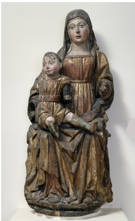
Slika 10: Bogorodica s Djetetom (Labinska Madona) , kraj XV. stoljeća, Zbirka crkvene umjetnosti Eufrazijana, Poreč