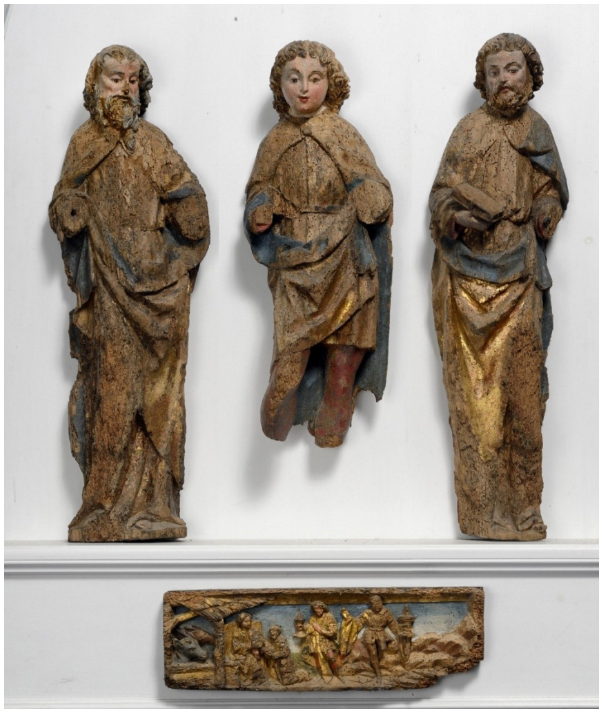
Slika 15: Tri sveca i Poklonstva kraljeva, kraj XV. stoljeća, drvo, polikromirano, pozlaćeno, župna crkva Pohodenja Blažene Djevice Marije, Bale

formom ovih skulptura. 72 Reljefna ploča, za koju se smatra da je bila dio predele oltara, je zadnja skulptura u ovoj grupi. Na njoj je izrezbaren prikaz Poklonstva kraljeva, na kojoj se nalaze minijaturene figure kraljeva, postavljenih u stiliziran krajolik. Također se može razaznati Bogorodica s Djetetom ispred štalice u kojoj se nalaze figure vola i magarca. 73