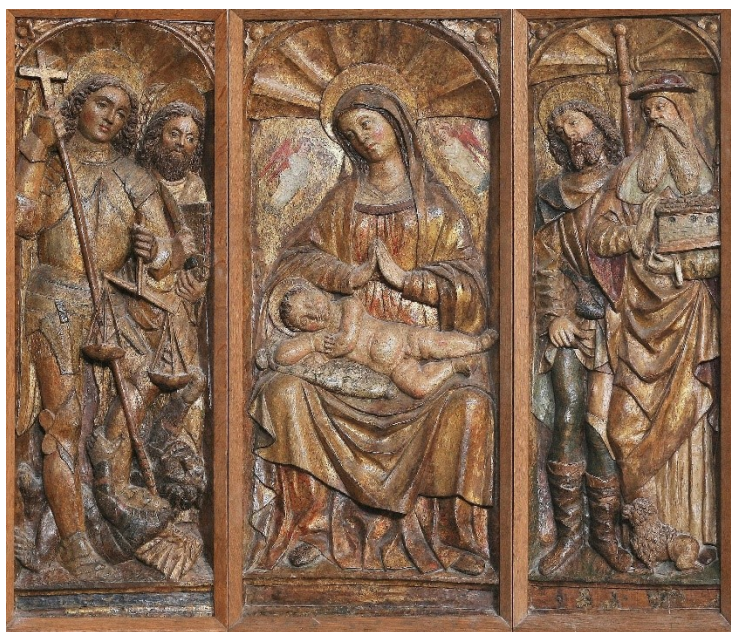
Slika 13: Paolo Campsa, Triptih Bogorodice s Djetetom i svecima , 1514. godina, župna crkva Presvetog Trojstva, Baška