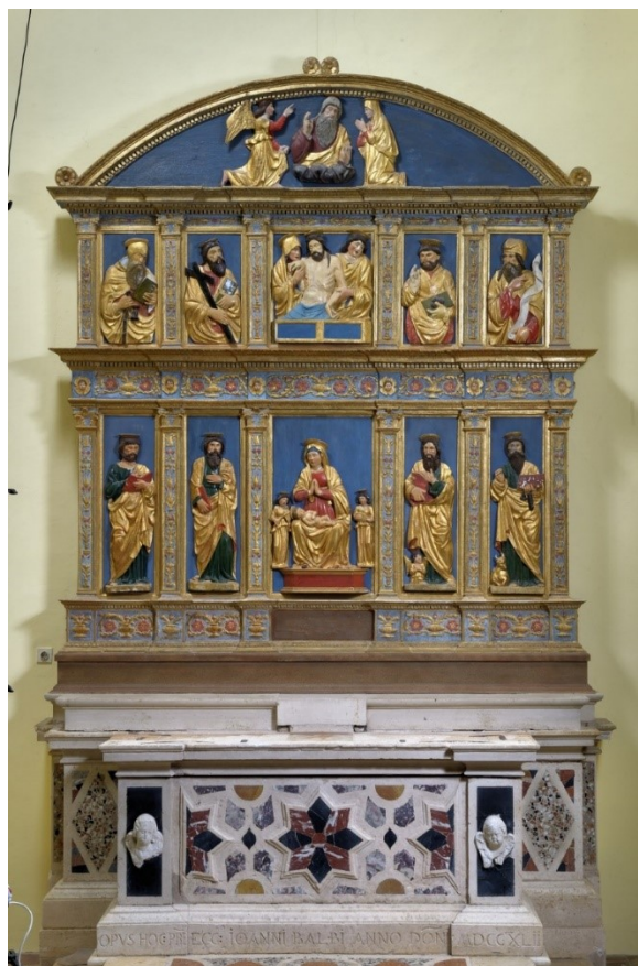
Slika 23: Oltarni poliptih, početak XVI. stoljeća, drvo, polikromirano, pozlaćeno, župna crkva Pohođenja Blažene Djevice Marije, Bale

U trećoj kapeli s južne strane trobodne župne crkve nalazi se oltar na kojemu je postavljen ovaj poliptih. Svojim je dimenzijama poliptih (321 x 282 cm) najmonoumentalniji primjer renesansne skulpture u Balama. On se, kao i mnoge druge umjetnine u župnoj crkvi, prethodno nalazio u staroj župnoj crkvi koja se nalazila na istom mjestu prije 1882. godine, kada je nova crkva sagrađena (tj. 1871., kada je stara crkva bila porušena). 97 Poliptih je postavljen na noviju bazu izrađenu od mramora. Čeona strana mramornoga stipesa ukrašena je intarzijama, a na crne stupce koji je flankiraju aplicirane su dvije krilate anđeoske glavice od bijeloga mramora. Duž baze stipesa može se iščitati natpis »OPVS HOC PRE / ECC IOANNI BALBI ANNO DONI / MDCCXLII«, što navodi na njegovu dataciju tek u sredinu XVIII. stoljeća, tj. u 1742. godinu.