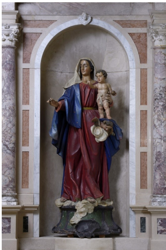
Slika 32: Gospa od Karmela , sredina XVIII. stoljeća, drvo, polikromirano, župna crkva Pohodenja Blažene Djevice Marije, Bale

Kip Gospe od Karmela je 149 cm visok prikaz impozantnog lika Djevice Marije u dugačkoj crvenoj tunici. Bijeli veo krase joj glavu, a ispod njega se oko torza omata plašt pod kojim, s lijeve Djevičine strane, pri njenom lijevom boku, izviruje krilata anđeoska glavica koja lebdi na oblaku. Zanimljivo je kako upravo taj kerubin ima dvojnu funkciju u ovoj kompoziciji – s donje strane on drži Djevičin plašt te istovremeno tvori svojevrsan postament za dijete Isusa, kojeg grli i pridržava Djevica lijevom rukom. Krist ima desnu ruku uzdignutu u blagoslov, dok u lijevoj ruci drži mali globus. Pod Marijinim nogama su vješto oblikovani oblaci, među kojima se nekada nalazio još jedna krilata anđeoska glavica, koja je u međuvremenu izgubljena. 132