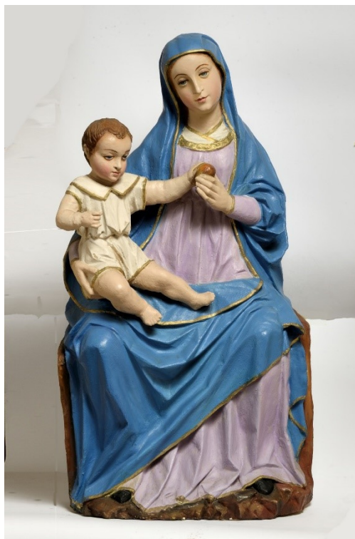
Slika 9: Bogorodica s Djetetom, XV. stoljeće, Crkva svete Marije na Muntu, Ližnjan

U Istri i okolici još se i svojom sličnošću ovoj skulpturi ističu skulptura Bogorodice u središtu poliptiha u župnoj crkvi sv. Martina u Lovreču; takozvana Labinska Madona , koja je originalno bila smještena u grobljanskoj crkvi u Labinu, a trenutno se nalazi u Zbirci crkvene umjetnosti Biskupije u Poreču; reljef Bogorodice s Djetetom u samostanu benediktinki u Cresu te reljef iste tematike u župnoj crkvi Presvetog Trojstva u Baškoj na Krku. 56 Ivan Matejčić smatra da sličnosti u klasičnoj obradi draperije, kompoziciji i rješenjima primijenjenima pri izradi lica Bogorodice i Djeteta ukazuju na veliku mogućnost postojanja jedne radionice koja je zaslužna za izradu spomenutih skulptura. 57