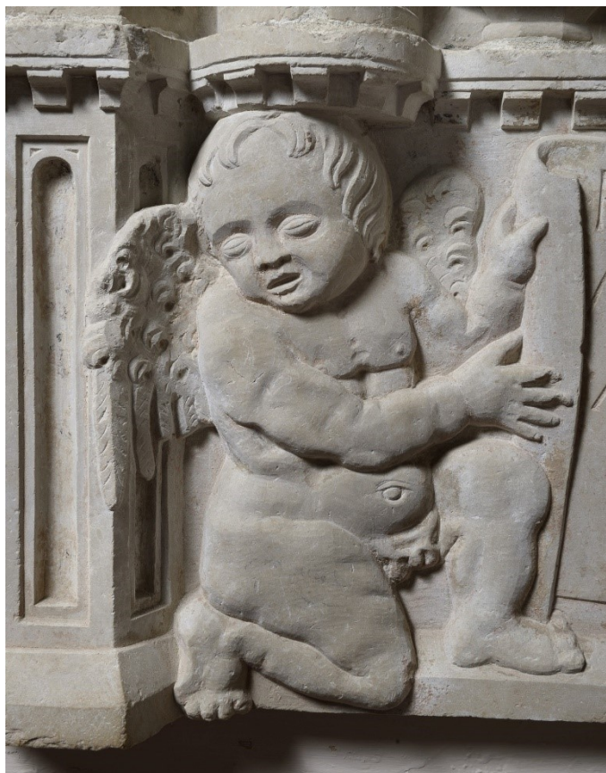
Slika 1: Svetohranište (detalj: putto), 1451., Vodnjan, župna crkva sv. Blaža

iz Vodnjana iz 1451. godine, gdje se na puttima vidi usvajanje renesansnog izražaja u mišičavosti njihovih tijela i suptilnosti njihovih pokreta. 18