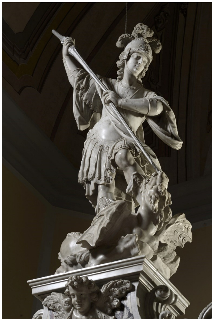
Slika 3: Alvise Tagliapietra, Giuseppe Tagliapietra, Carlo Tagliapietra, Glavni oltar (detalj: Sv. Juraj), 1750-te, Rovinj, župna crkva svetih Jurja i Eufemije