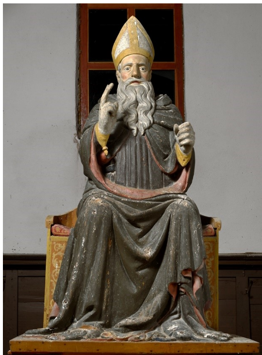
Slika 14: Sv. Antun Opat, kraj XV. stoljeća, drvo, polikromirano, pozlačeno, crkva sv. Antuna Opata, Bale

ili čak početak XVI. stoljeća, što dodatno oslabljuje njezinu izravnu poveznicu sa skulpturom iz Bala. 63