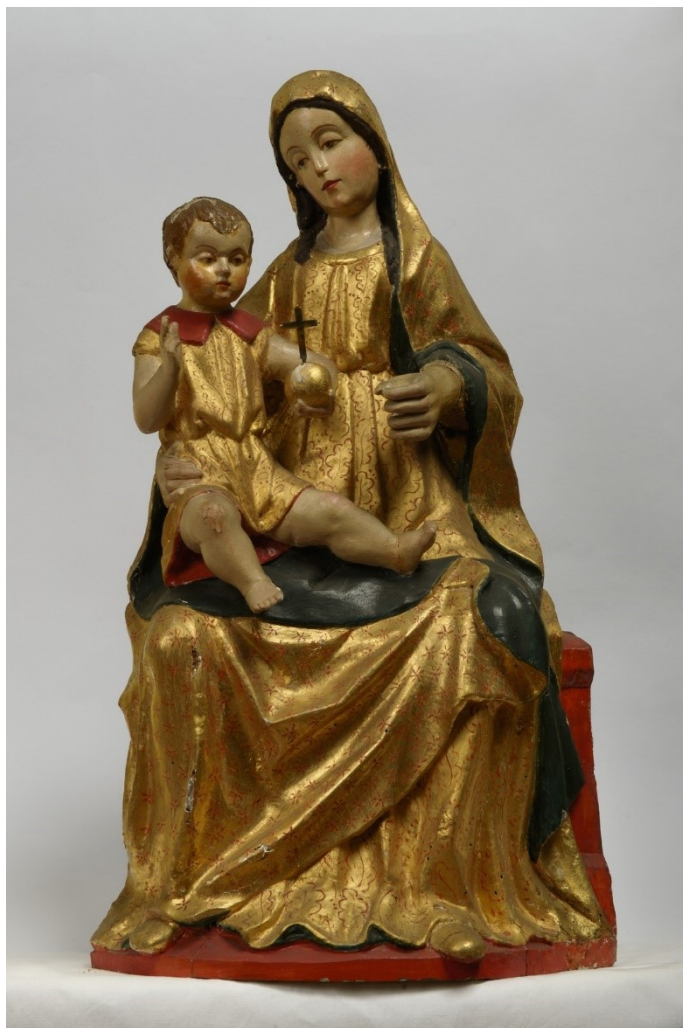
Slika 8: Bogorodica s Djetetom (Bogorodica od Monperina) , kasno XV. stoljeće, drvo, polikromirano, pozlačeno, župna crkva Pohodenja Blažene Djevice Marije, Bale

Vanda Ekl (1982.) predlaže dataciju ove skulpture u kasno XV. stoljeće. 55 Međutim, u svojem šturom obrazloženju te datacije ne fokusira se na renesansna obilježja skulpture, no upućuje na njezine moguće poveznice s drugim drvenim skulpturama u Istri. Ivan Matejčić (2017.) pak smatra kako se može povući poveznica između ove i nekolicine drugih skulptura koje se nalaze u Istri ili u široj okolici regije, a čije se autorstvo možda može pripisati istoj radionici koja je izradila baljansku Bogorodicu s Djetetom. Kip Bogorodice s Djetetom koji se nalazi u crkvi sv. Marije na Muntu u Ližnjanu je u svojoj kompoziciji i detaljima veoma sličan onom baljanskom. Kombinacija iste tematike i čvrste kompozicije tvori solidnu bazu na koju možemo nadodati sličnost između izrade ljupkih lica i Bogorodice i Djeteta, sličnih nabora odjeće te velik ovratnik na košuljici koja krasi malog Krista.