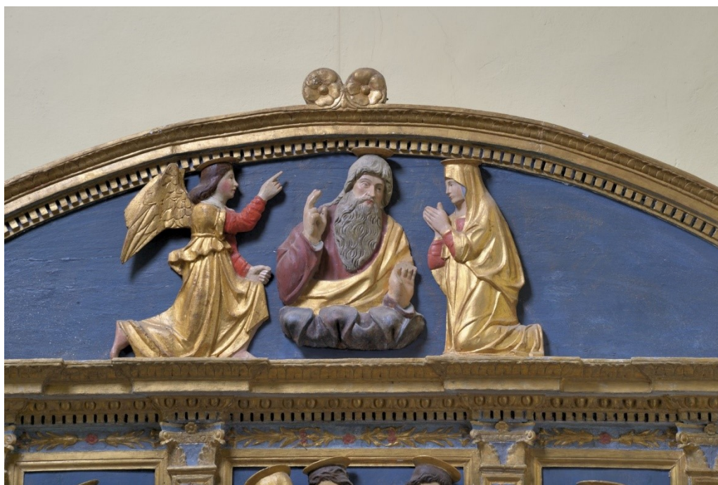
Slika 28: Oltarni poliptih (detalj), početak XVI. stoljeća, drvo, polikromirano, pozlaćeno, župna crkva Pohoda Blažene Djevice Marije, Bale

na isti način kao i kod drugih likova, dok se zbog svjetlije boje brade bolje primjećuju oštri i zmijoliki potezi kojima su se oblikovale kovrče u bradi. S lijeve strane Boga Oca kleči bočno prikazan lik Marije, čiji izgled i draperija prate oba njezina prikaza u nižim dijelovima poliptiha. U bočnom se prikazu razaznaje pomalo nespretan spoj aureole i plašta. S desne strane Boga Oca, na jednom koljenu kleči lik arkandela Gabrijela čija obrada također prati obradu ostalih likova na poliptihu. Pozlaćeni plašt i aureola su upotpunjeni pozlaćenim krilima, koja na sebi imaju kružne i ovalne poteze koji tvore različite dijelove krila. Desna mu je ruka podignuta i kažiprstom pokazuje prema gore, dok mu je lijeva stisnuta u šaku i sljubljena uz pokleknuto koljeno. Arkandelova je draperija ponešto drukčija od ostatka likova – njegov pozlaćeni plašt ima dva dijela, prvi koji ima svoj valovit završetak ispod arkandelovih ruku, te drugi dio koji se nastavlja iz prvog dijela i ima klasičnu padajuću obradu kao i kod drugih likova. Njegovo je lice dječaćko, ljupko i bez brade, dok su mu obrazi rumeni a kosa ravna i homogeno obrađena, bez istaknutih čuperaka i kovrča, osim pri vratu.