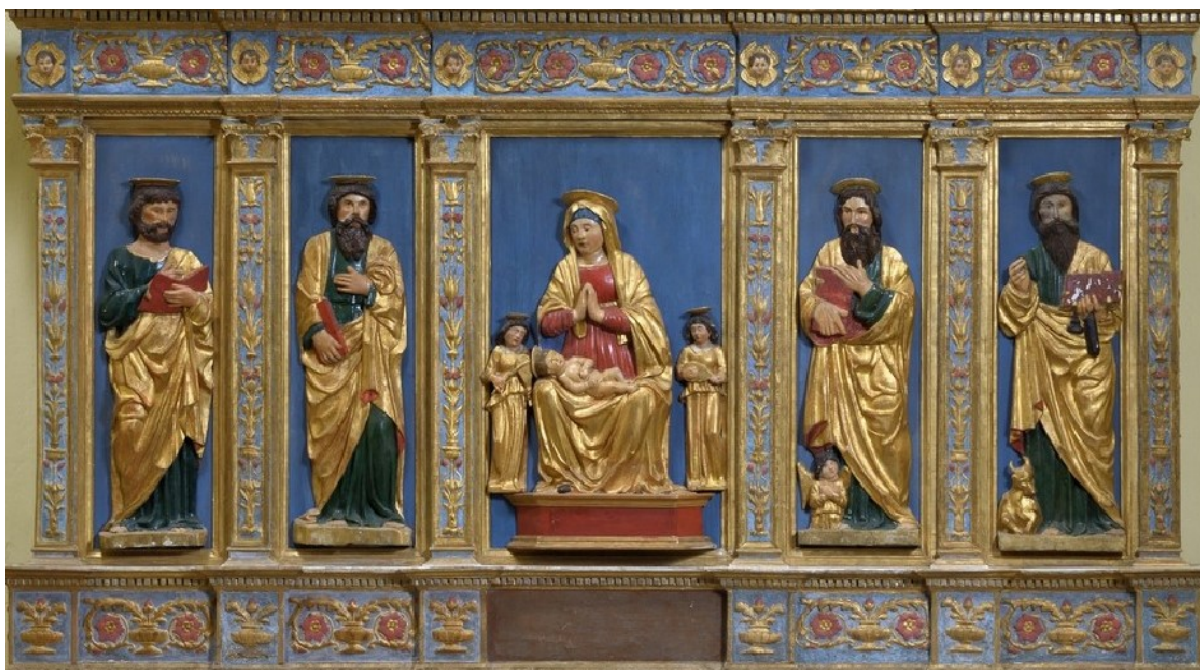
Slika 24: Oltarni poliptih (detalj), početak XVI. stoljeća, drvo, polikromirano, pozlaćeno, župna crkva Pohoda Blažene Djevice Marije, Bale

Baljanski poliptih je podijeljen u dvije horizontalne zone (sa zaključkom u obliku segmentnoga zabata). Donja zona je viša, dok je gornja nešto kraća, što se očituje u činjenici da su svecima donje zone tijela u potpunosti prikazana, dok su sveci u gornjoj zoni prikazani samo do pojasa. Obe su zone razdijeljene pilastrima na pet manjih polja. 98 Friz razdjelnoga gređa dekoriran je simetrično postavljenim vazama s cvijećem, dok je vijenac ukrašen nizovima listićima, ovulima i zupcima. U ukladama duž tijela pilstara nižu se stručci listova i cvijeća. 99 Središnje polje u donjoj zoni je reljef Bogorodice s Djetetom i dva anđela svirača. Bogorodica je najveći lik u tom prikazu i nalazi se u sjedećem položaju i rukama u molitvi, dok je dijete Isus položen, tj. polegnut u njeno krilo. Odjevena je u crvenu tuniku, a oko tijela i glave joj se u pravilnim naborima omotava pozlaćeni plašt, koji je također prebačen preko njenih nogu i služi kao potpora za malog Isusa, na kojem je jedini dodan detalj pozlaćena aureola. Anđeli svirači su također ukrašeni pozlaćenim tunikama i instrumentima, koji svojim pravilnim naborima prate njihov suptilan pokret tijela i kontrapost.