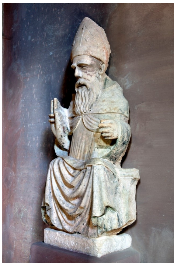
Slika 22: Sv. Antun Opat, XV. – XVI. stoljeće, kamen, Kripta župne crkve Pohođenja Blažene Djevice Marije, Bale

prikazom. Desna je ruka podignuta u gesti blagoslova, dok je lijeva poluspuštena i sa stisnutom šakom koja je vjerojatno некоć držala pastoral. Lice mu je anatomski korektno i čvrsto modelirano, a usta otvorena. Krasi ga duga brada koja je isklesana u valovitim uvojcima sa tanjim linijama koje tvore izgled individualnih pramenova. lica sv. antuna upućuje na iskustvo renesansne skulpture. Kao mitronosni opat, na glavi nosi zašiljenu mitru. Pogled mu je oštar i smiren, te cjelokupna skulptura ima svojevrsan stav važnosti i autoriteta. Način odmjereno realistične (gotovo klasične) obrade lica, draperije te brade sveca navodi na potencijalne tendencije prema renesansom načinu oblikovanja skulpture, no ona je istidbno svojim cjelokupnim izgledom još uvijek veoma statična, rigidna, i srodna istarskim gotičkim skulpturama XV. stoljeća.