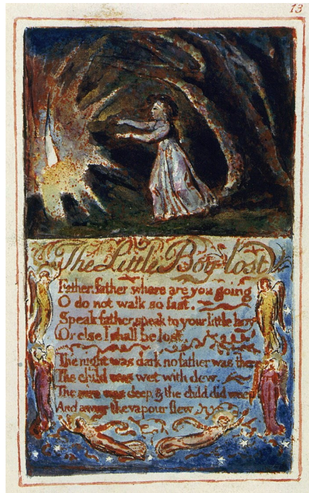
William Blake: The Little Boy Lost (izvor: Wikisource, https://en.wikisource.org/wiki/Songs_of_Innocence_and_of_Experience_(1826)/Songs_of_Innocence/The_Little_Boy_Lost , datum pristupa: 17. 7. 2023.)

reduplikaciji tekstema) ili kao njezina adaptacija/ilustracija, dolazi se do točke onkraj mogućnosti većine analiza.