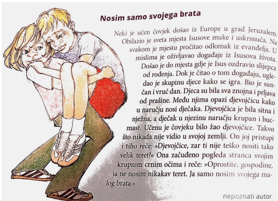
Slika 1., ilustracija djevojčice koja nosi dječaka uz tekst koji likovima pridaje osobine „sitna i nježna” te „krupan i bucmast”. Preuzeto iz udžbenika za 4. razred, Darovi vjere i zajedništva 4 , str. 76.