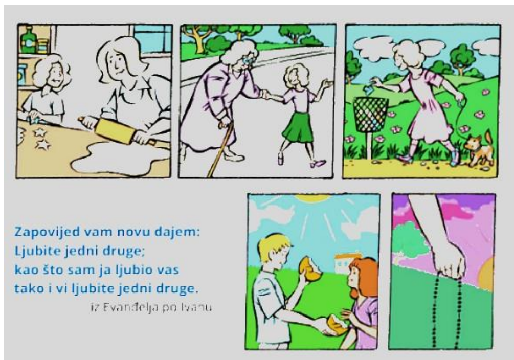
Slika 4., ilustracije na kojima su prikazane moguće aktivnosti na praznicima na rodno stereotipan način. Preuzeto iz udžbenika za 3. razred, U ljubavi i pomirenju 3 , str. 100.