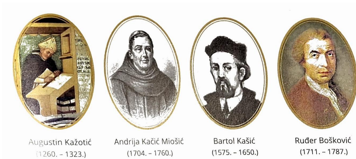
Slika 5., ilustracije muškaraca čije su zasluge navedene u kontekstu hrvatskog školstva, kulture i znanosti. Preuzeto iz udžbenika za 8. razred, Ukorak s Isusom , str. 85.