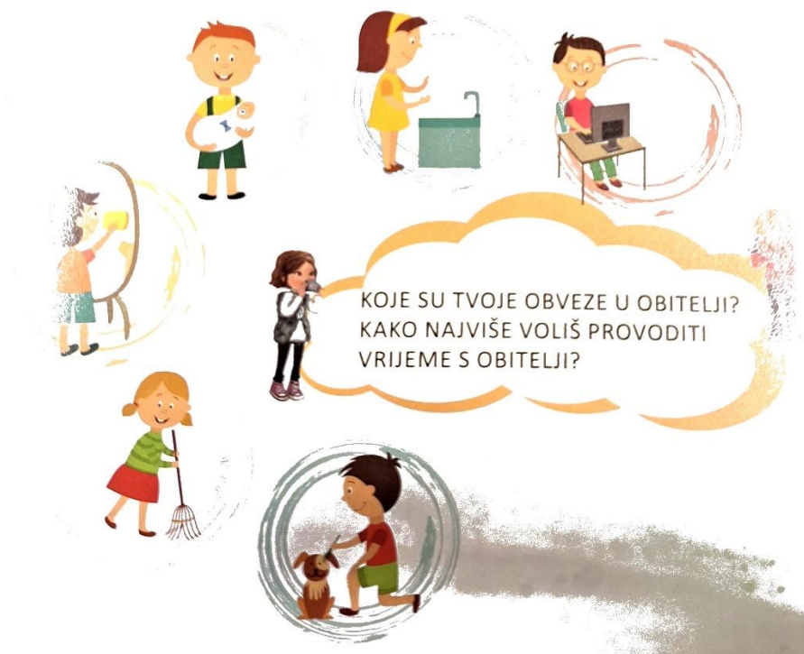
Slika 2., ilustracije na kojima je prikazana podjela kućanskih poslova. Preuzeta iz udžbenika za 1. razred, U Božjoj ljubavi 1 , str.