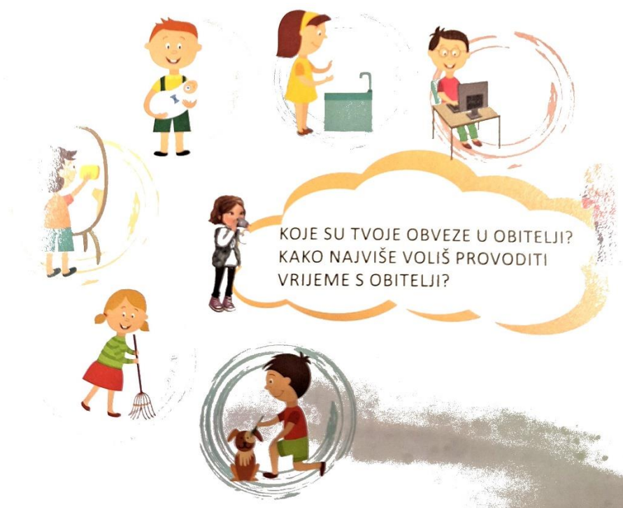
Slika 2., ilustracije na kojima je prikazana podjela kućanskih poslova. Preuzeta iz udžbenika za 1. razred, U Božjoj ljubavi 1 , str.