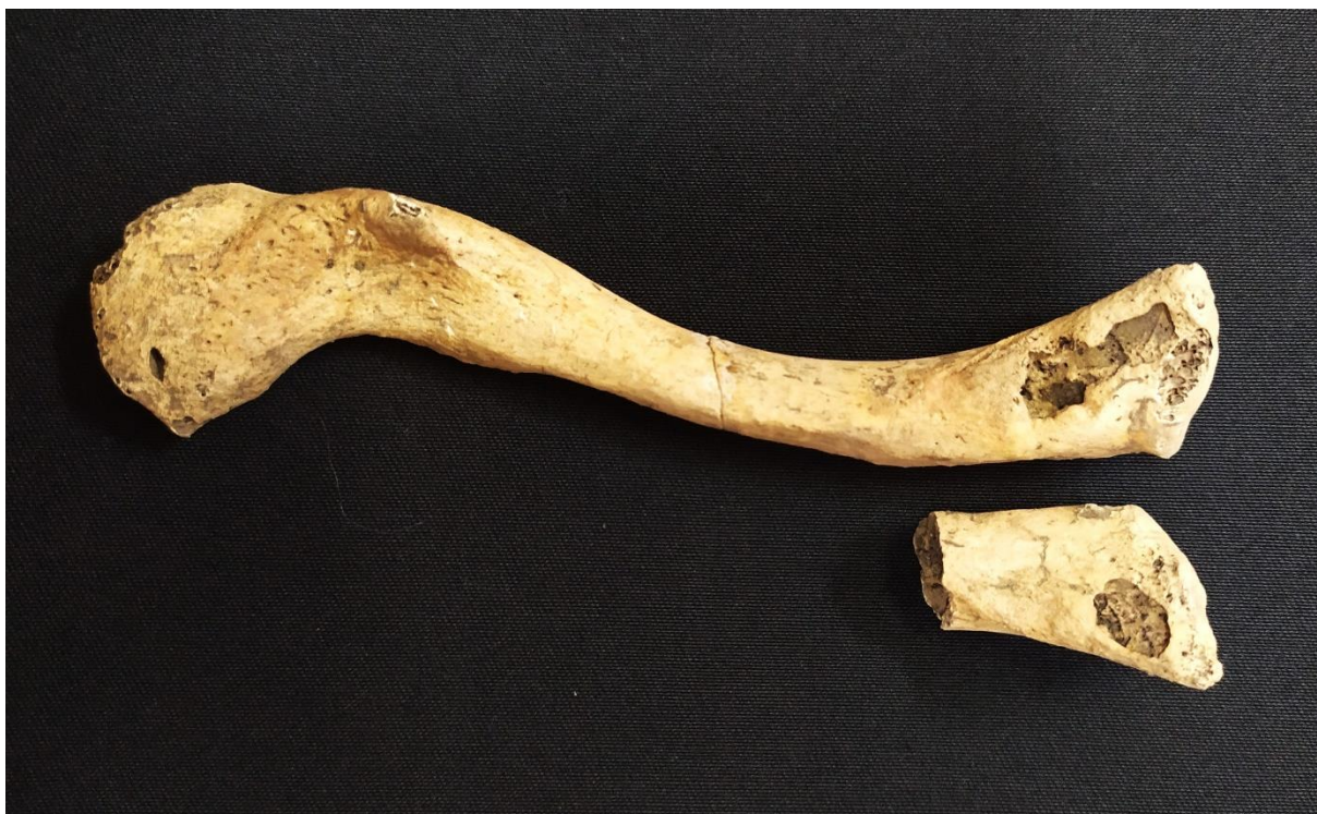
Slika 7 Rhomboidne fosse kod pokojnika iz groba 10

Blaža pojava identificirana je kod ženske osobe u grobu 8.