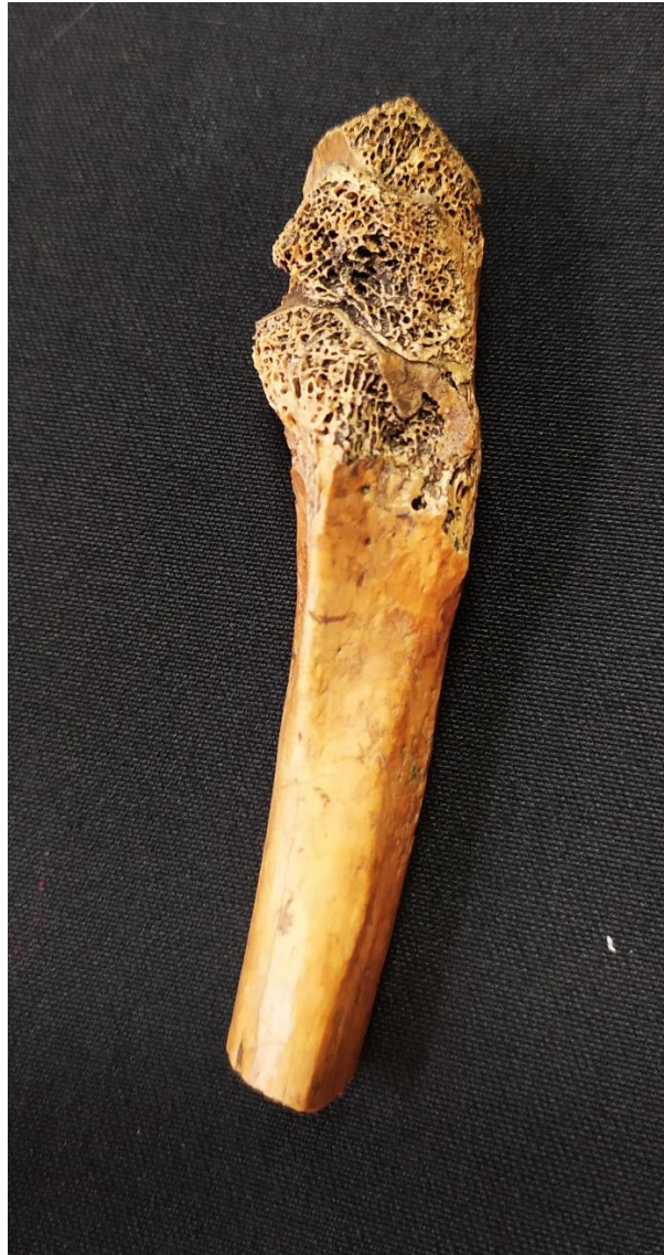
Slika 5 Koštana ankiloza lijevog lakatnog zgloba kod pokojnice iz groba 4

Istraživanjem na lokalitetu Vukovar – Gimnazija utvrđene su blage osteoartrične promjene na lijevoj lopatici kod muškarca starosti između 35 i 40 godina u grobu 1.