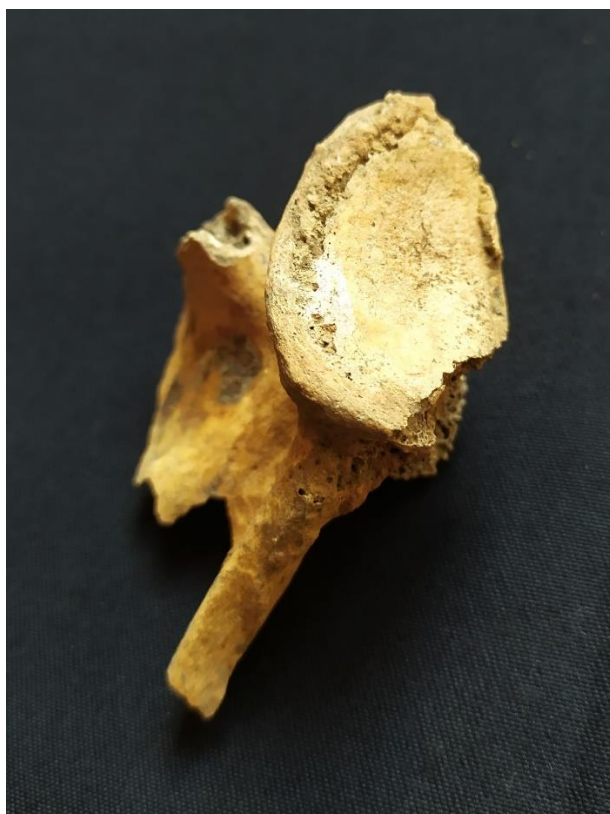
Slika 3 Polirana površina za zglobnoj plohi desne lopatice pokojnice iz groba 3

Ono što je zanimljivo kod pokojnice u grobu 3, a što može i ne mora biti povezano sa pojavom eburnizacije na ramenom zglobu, je činjenica kako je ona imala desnu nadlaktičnu kost kraću od lijeve. Kost nije cjelovita te nije moglo biti izmjereno kolika je točno razlika u duljini, no gruba usporedba kosti položenih paralelno jedna uz drugu pokazuje jasnu razliku.