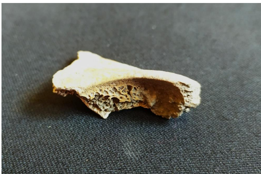
Slika 1 Cribra orbitalia kod djeteta iz groba 1

Zamjećujemo kako su u uzorku od šest pokojnika sa lokaliteta Vinkovci – Ervenica, čiji su fragmenti lubanja pronađeni, kod svih šest identificirane lezije u obliku cribrae orbitalie i / ili ektokranijalne poroznosti.