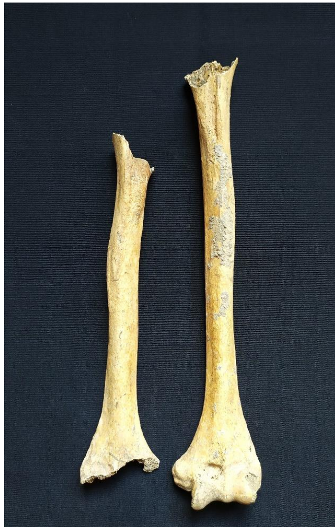
Slika 4 Usporedba nadlaktičnih kostiju kod pokojnice iz groba 3

Ukoliko se radi o frakturi kosti koja utječe na normalno funkcioniranje zgloba, može doći do posttraumatskog osteoartritisa (Šlaus 2021, 237), što bi moglo biti objašnjenje zašto se osteoartritis javlja samo na jednom ramenu u toj mjeri.