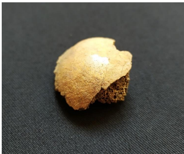
Slika 2 Polirana površina na glavi desne nadlaktične kosti pokojnice iz groba 3

Ortner (2011, 548) navodi kako su osteoartritisu u ramenom zglobu sklonije žene nego muškarci, te da se najčešće javlja u starijoj životnoj dobi.