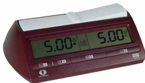
Slika 4. Digitalni šahovski sat

Šahovski turniri najčešće se igraju u 9 ili 11 kola. Ovisno o vrsti turnira, na važnijim natjecanjima igra se s tzv. olimpijskim vremenom (90 minuta po igraču) uz dodatak bonusa od 30 minuta (nakon 40. poteza) i 30 sekundi po svakom povučenom potezu. Na takvim natjecanjima, jedno kolo obično traje po nekoliko sati, a može potrajati i puno više. Najduža partija šaha trajala je 20 sati i 15 minuta i zbila se 1989. godine, ali tu se