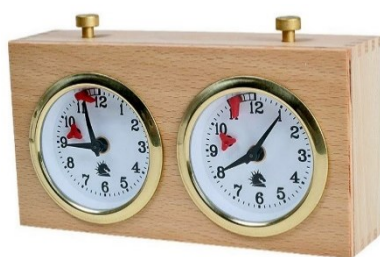
Slika 3. Analogni šahovski sat

poziciji. Treći način pobjede je istekom vremena na šahovskom satu. Protivnici naizmjenice igraju svoj potez figurom i, nakon svakog odigranog poteza, stišću svoju stranu šahovskog sata. Šahovski sat nije nužan za igranje šaha, ali je neizostavan dio šahovskih natjecanja, ali i šahovskih treninga te prijateljskih mečeva jer čini igru šaha dinamičnijom i zanimljivijom zbog vremenske ograničenosti. Nekada prije kada se šah igrao bez vremenskog ograničenja, partije su znale trajati i po nekoliko dana. Popularan je bio i tzv. dopisni šah u kojemu su protivnici igrali na daljinu i slali poteze pismom, telegrafom ili radijom. Dopisni šah i dalje se igra, ali na suvremeni način (elektronska pošta, šahovski poslužitelj ili drugi mediji). Šahovski sat nekada je bio analogni, a današnji digitalni sat ima mogućnost dodatka vremena nakon odigranog poteza.