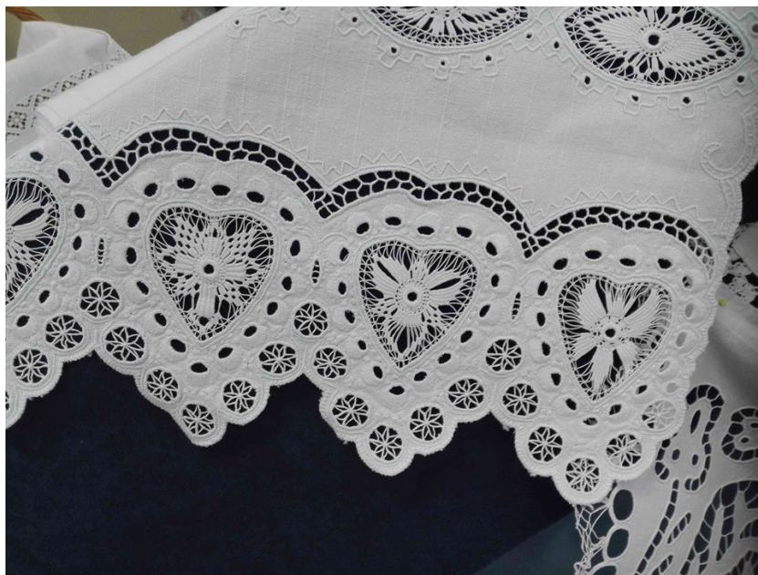
Slika 9 Sunčana čipka (M.M., 2019)