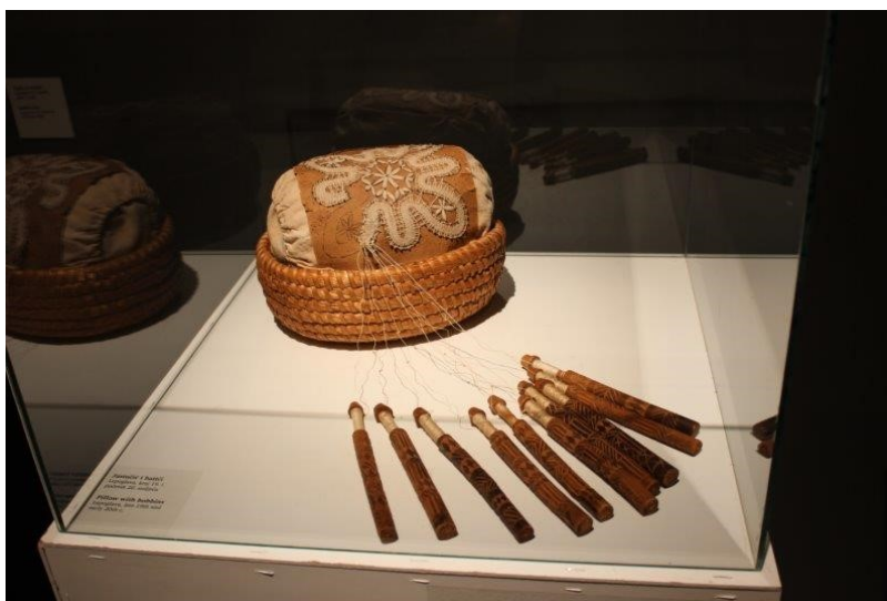
Slika 6 Primjerak iz Ekomuzeja Lepoglava (Ekomuzej Lepoglava, bez dat.)

je od 1932. do 1936. godine te je sačuvana u Etnografskom muzeju u Zagrebu čiji je Vladimir Tkalčić također bio ravnatelj (Petrović Leš, 2008:78).