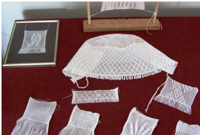
Slika 8 Jalba Ozalj