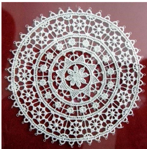
Slika 3 Paška čipka (Paška čipka, bez dat.)