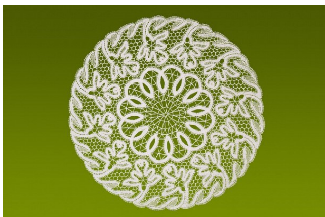
Slika 5 Lepoglavska čipka (Lepoglavska čipka, bez dat.)

poznata je po svojoj nijansiranosti, jača i slabija stezanja dovode do širih i užih prepleta (Eckhel i Barac, 2012).