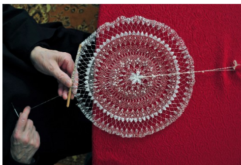
Slika 7 Čipka od agave

bez dat.). Sestre benediktinke su izrazile želju da izrada ove čipke ostane u njihovim redovima, te tehničari uče mlade redovnice koje se pridružuju redu. Čipka od agave izrađena je bez određenog uzorka ili dizajna što osigurava posebnost svakog primjerka čipke. Postoje različite tehnike po kojima se mogu razlikovati čipke od agave, to su tenerifa (nazvana po otoku Tenerifi gdje je razvijena, tehnika gdje se koristi mala šivaća igla na kartonu), tenerifa s mreškanjem (tehnika gdje se koristi mala šivaća igla i metalna igla s kojima se radi mreža s mreškanjem) i vezenje na mreži (tehnika gdje se na mreži koristi mala šivaća iglica i različitim bodovima se radi vez) (Eckhel i Barac, 2012).