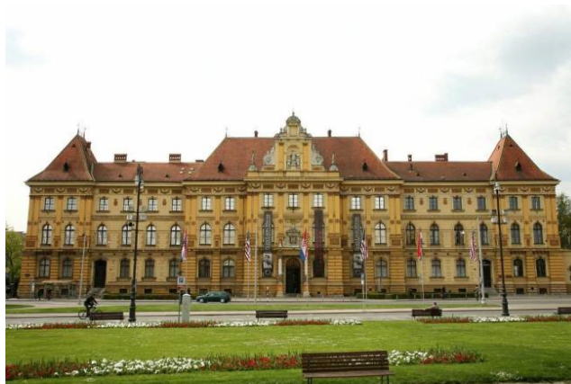
Slika 1 Muzej za umjetnost i obrt (Turistička zajednica grada Zagreba, bez dat.)