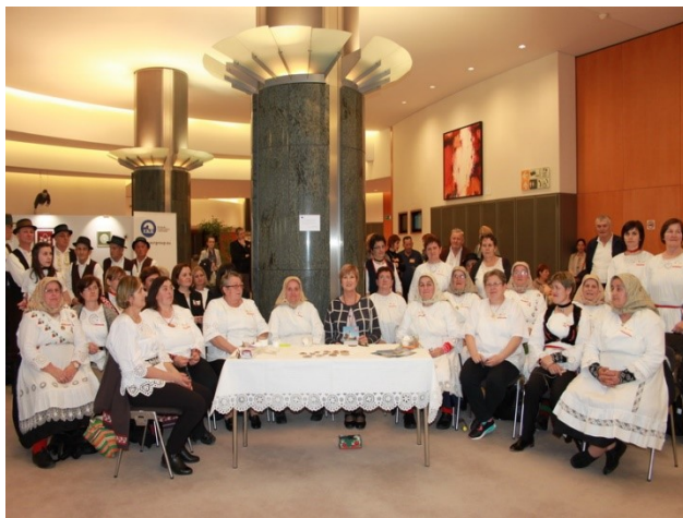
Slika 10 Udruga Sikirevački motivi u Europskom Parlamentu (HKS, 2017)

Zagrebu i Muzeju Brodskog Posavlja, kroz godine organizirali su više izložbi te su nakon toga dobili priliku sunčanu čipku trajno izložiti u Općinskoj zgradi u Sikirevcima gdje su za tu upotrebu dobili posebnu prostoriju. Udruga je također u Zavodu za intelektualno vlasništvo 2014. godine uspjela zaštititi 17 oblika motiva sunčane čipke po kojima su poznati (Udruga „Sikirevački motivi“, 2013).