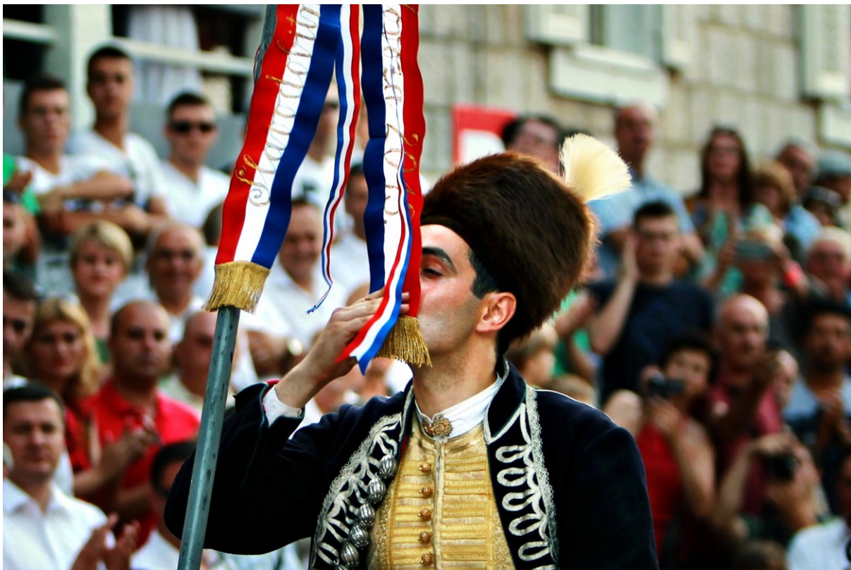
Slika 4: Sinjski alkar

odjeće, obuće i predmeta općenito. Muzejski fondus tih predmeta pohranjen je kao stalna zbirka od 2015. godine kada je na tristotu obljetnicu Sinjske alke svečano otvoren Muzej Sinjske alke. Kroz razne multimedijske instalacije i interaktivne sadržaje prezentiraju odore, opremu i oružja, a time lokalnoj zajednici i turistima pružaju doživljaj i vrijednosti ovog kulturnog dobra. Osim predmeta postav sadrži i statične figure alkara i njihovih konja, kartu Cetinske krajine, pravila igre, povijesni pregled i još zanimljivih sadržaja. Zajednica jednom godišnje čuva i njeguje svoju tradiciju, ali njenu vrijednost moguće je vidjeti i u muzeju što je vrlo bitno za promociju kulturnog dobra. „Iako podrijetlom i formalnim obilježjima nevezana uz lokalnu tradiciju, Alka je postala jednim od načina održavanja sjećanja na slavnu pobjedu“ (Vukušić, 2005., p.99).