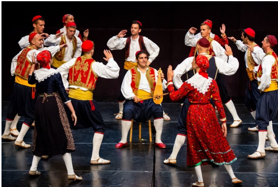
Slika 5: Dubrovačka poskočica linđo

Iako ovu tradiciju prati veliki broj zajednice svejedno je od velike važnosti znanje i praktično iskustvo prenositi na mlađe generacije. S obzirom na to da je materijalni dio kola linđo prikazan u muzeju, turistima i lokalnom društvu lakše je predstaviti i održavati svijest o očuvanju i korištenju tradicije u suvremenom vremenu. Prema izvorima vidljiva je zainteresiranost lokalnih vlasti i privatnika u obnavljanje i očuvanje tradicije financijskom pomoći, promotivnom i razvojnom području što je vrlo bitan aspekt u očuvanju (Folklorni ansambl Linđo, Povijest folklornog ansambla Linđo, s.a.).