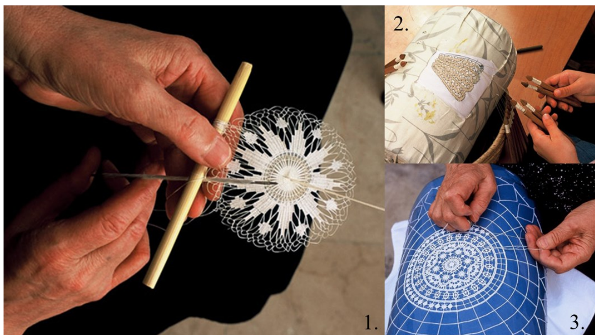
Slika 3: Hvarska čipka (1.), Lepoglavska čipka (2.) i Paška čipka (3.)

podrška za organizaciju takvih događaja. Svake godine održava se nekoliko festivala na kojima se čipka predstavlja kao tradicionalno bogatstvo, na Pagu je do danas održano 12 festivala, u Svetoj Mariji dva puta, a u Lepoglavi čak 26. Na festivalima nerijetko sudjeluju muzejski stručnjaci koji prikazuju svoje zbirke odjeće, obuće, ukrase i razne ostale predmete ukrašene čipkom, a uz njih sudjeluju i nositelji tradicija, dakle tete čipkarice koje prezentiraju svoje znanje. Osim festivala, ovo tradicionalno umijeće često je dio stalnih i povremenih muzejskih izložbi. Tako je na primjer izložba Pohvala ruci – čipkarstvo u Hrvatskoj u Etnografskom muzeju osim nematerijalne strane (tehnike, vještine) prikazala i materijalnu stranu – odnosno krajnji produkt čipku . Cilj ove, ali i sličnih izložbi je “edukacija o potrebi očuvanja i revitalizaciji te vrste kulturne baštine“, ali i pružanje mogućnosti sudjelovanja na radionicama (InfoZagreb.hr, 2012). Ako govorimo o čipki kao o materijalnoj kulturnoj baštini onda na nju gledamo kao muzeološki predmet. Čipka u tom kontekstu ima svoju estetsku i umjetničku vrijednost, a kako bi se očuvala prolazi kroz razne procese restauracije, konzervacije, pravilnog čuvanja, zaštite te naposljetku prezentacije i interpretacije u samom muzeju. Kroz kombinaciju materijalnosti i nematerijalnosti promičemo kulturni turizam, stvaramo svijest o važnosti čipkarstva te potičemo aktivno sudjelovanje.