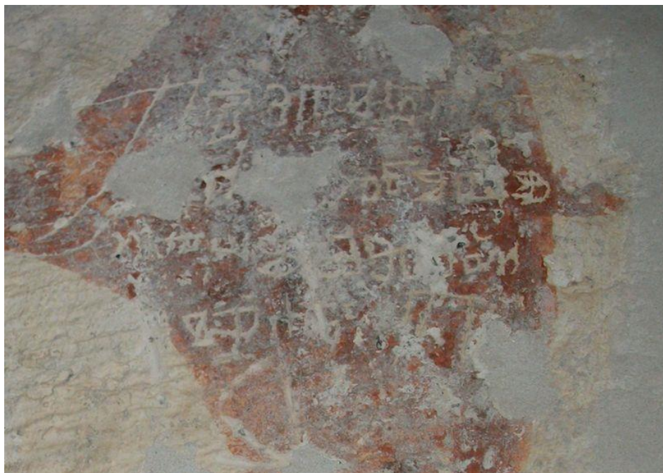
Slika 7. Grafit iz crkve sv. Ivana u Lovranu, XIV. st.

izraza dovršio. 53 U ovoj je crkvi pronađen dosad najstariji grafit ne samo u Lovranu već i na području čitavoga Sjevernog Jadrana (Slika 7.).