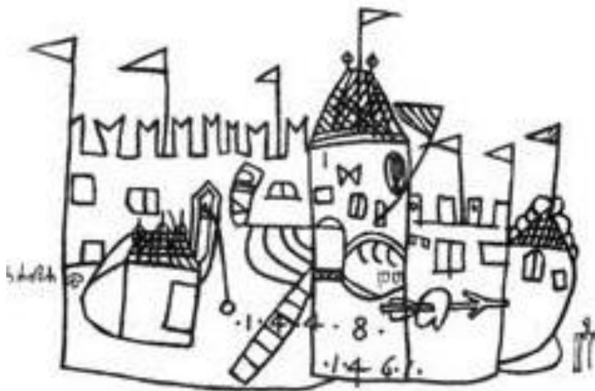
Slika 6.. Barbanski kaštel, grafit iz crkve sv. Antuna u Barbanu, XV. stoljeće

Grafitima se bilježilo sve važno što se dogodilo u mjestu, poput raznih svečanosti o čemu svjedoči i nevješt, primitivan, gotovo dječji crtež iz crkve sv. Antuna u Barbanu. Grafit prikazuje barbanski kaštel, nazubljenih grudobrana na vrhu zidina, pomičnih ljestava kojima se u njega ulazilo i sa zastavicama koje vijore, a ukazuju na to da je posrijedi vjerojatno bila nekakva svečanost 26 (vidljivo na Slici 6.).