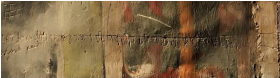
Slika 8. Potpuni glagoljski abecedarij

Jedan se nalazi na prizoru „Raspeća“, na zelenoj pozadini, s desne strane ramena trećeg vojnika. Smješta se u ¾ XV. st., nakon dovršetka zidnih slika, odnosno iza 1479. godine. Veličine je 178x185cm. Također je evidentno da je pisan rukom nekog vježbenika, početnika, s obzirom na to da je slovo „N“ napisano kao zrcalna slika, što je česta početnička greška u pisanju. Zanimljivo da je to slučaj i danas, odnosno ista je problematika pisanja slova „N“ i među današnjim učenicima koji tek počinju učiti pisati. Međutim ono što je vrlo bitno spomenuti jest da je ovo potpuni azbučni niz, odnosno da sadrži sva slova, njih 33, koja su tada bila u upotrebi. 69 (Slika 8.)