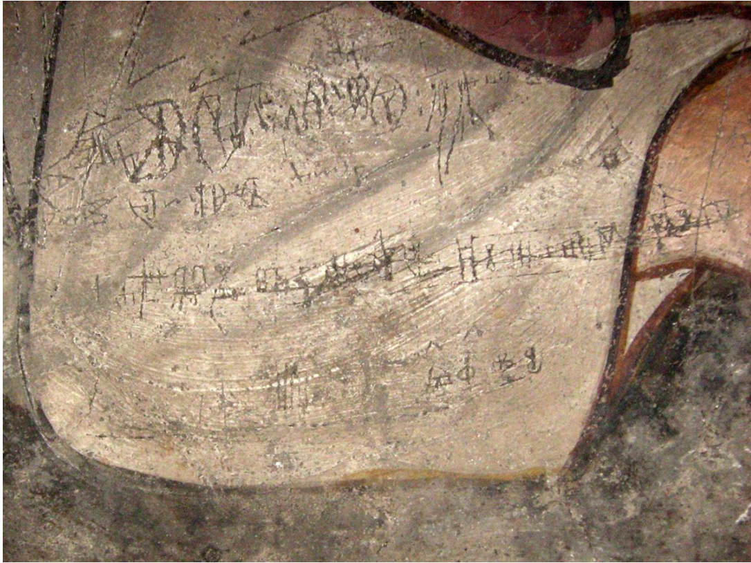
Slika 9. Nepotpuni glagoljski abecedarij