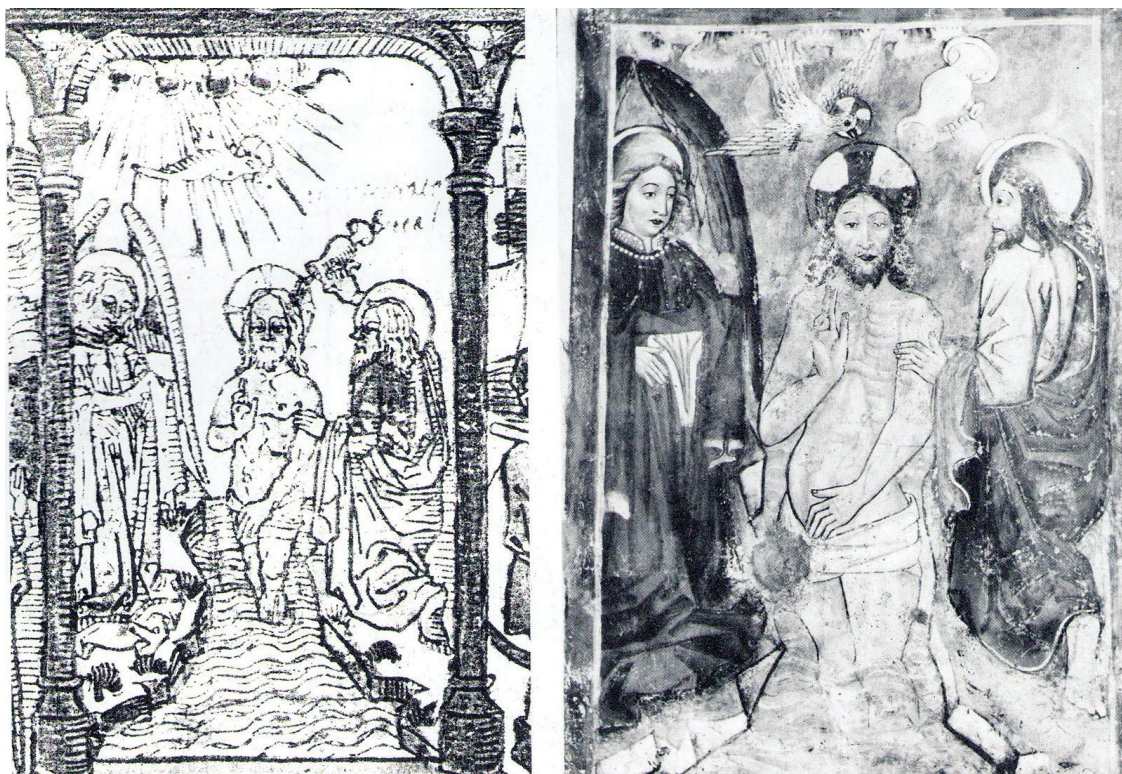
Slika 1. Usporedni prikaz „Krštenja Kristovog“. Grafički list broj 9 iz Biblie Pauperum (lijevo) prema kojem je naslikano Kristovo krštenje u crkvi Sv. Marije na Škrilinama kraj Berma (desno)