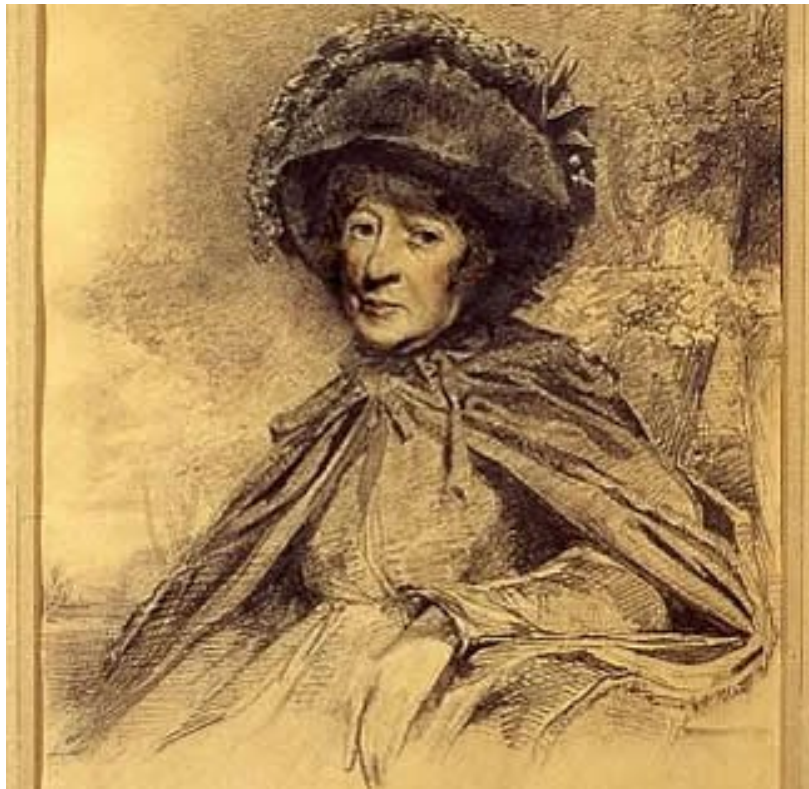
Slika 4 Crtež gospođe Piozzi (Reproducirano zahvaljujući povjerenicima kuće dr. Johnsona)

Izvor: https://www.drjohnsonshouse.org/picturelibrary.html (15. srpnja 2023.)