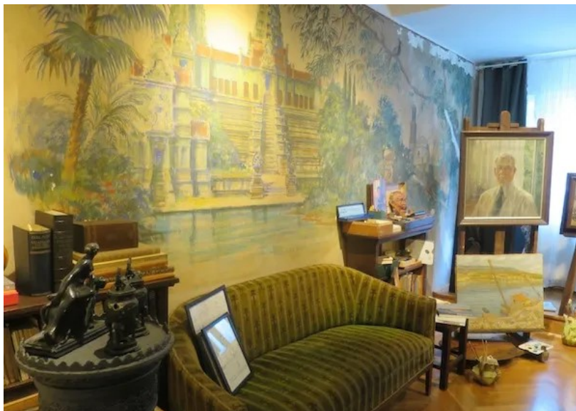
Slika 9 Brkan, B. (2016.), Oslikani zid Branka Šenoe

Izvor: https://proofed.com/writing-tips/how-to-cite-an-online-image-in-harvard-referencing/