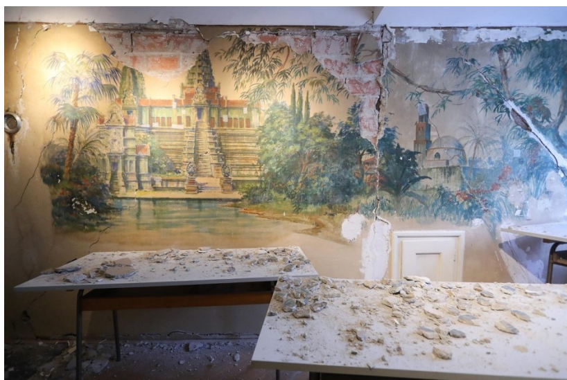
Slika 15 Stanzl, L. (2020.), Oštećeni mural Branka Šenoa