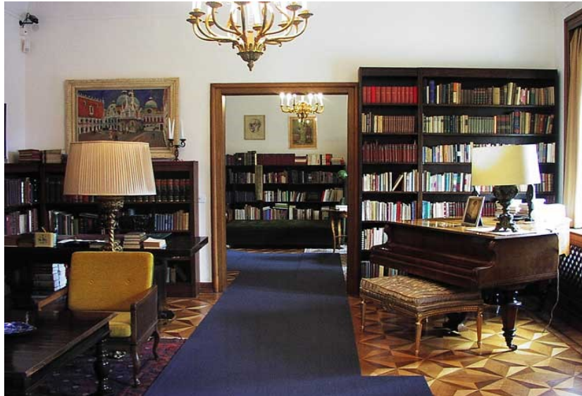
Slika 8 Krležina radna soba (n.d.)