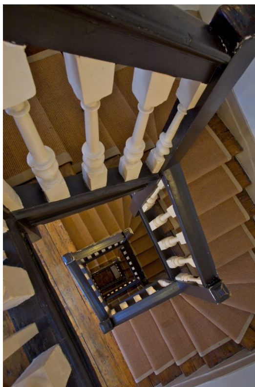
Slika 3 Otvoreno stubište