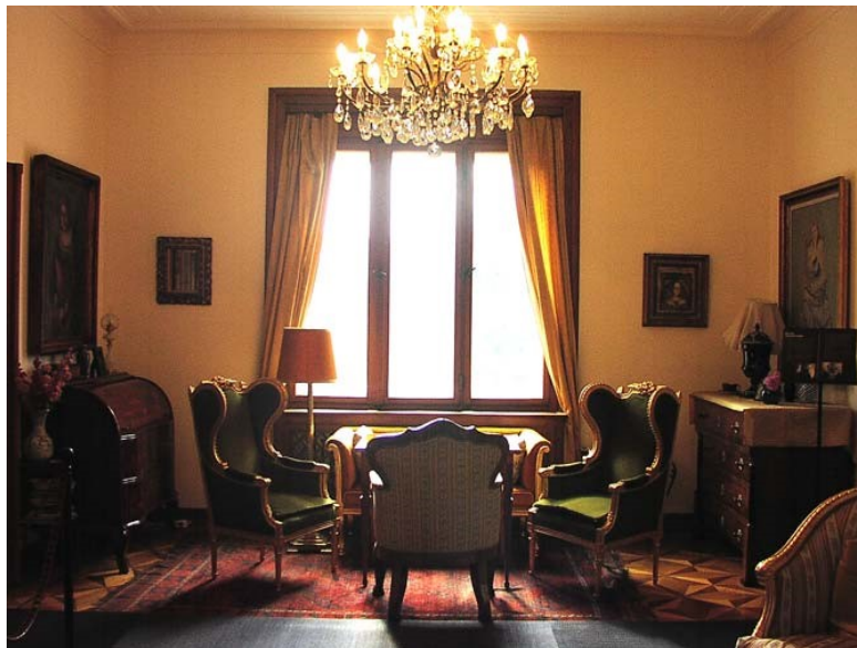
Slika 7 Žuti salon (n.d.)