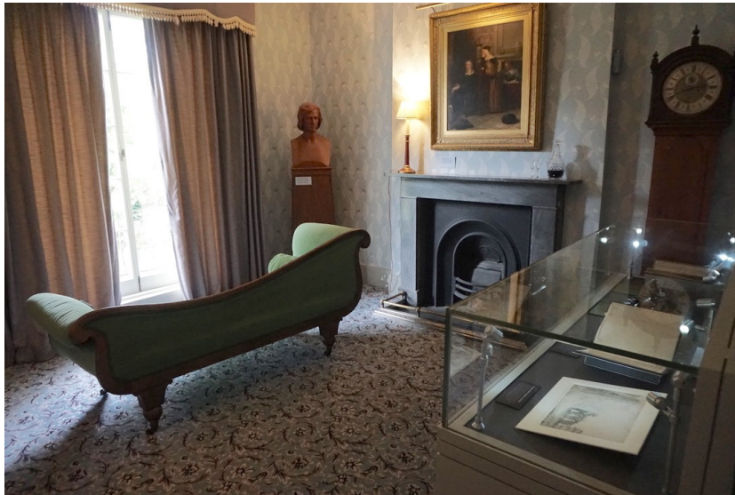
Slika 5 Zelena sofa u salonu (n.d.)