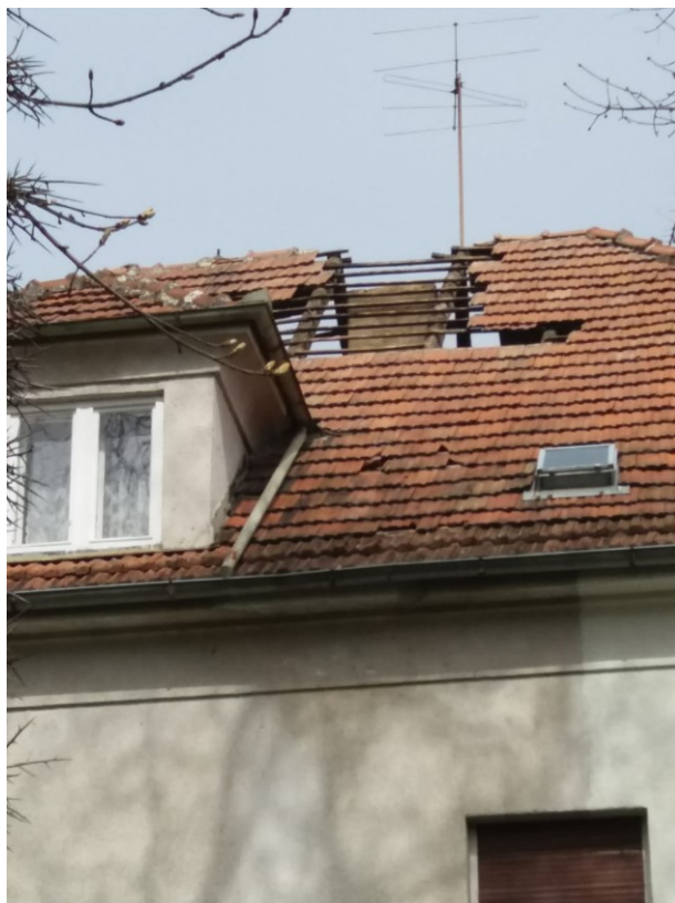
Slika 14 Posljedice potresa na Kući Šenoa (2020.)