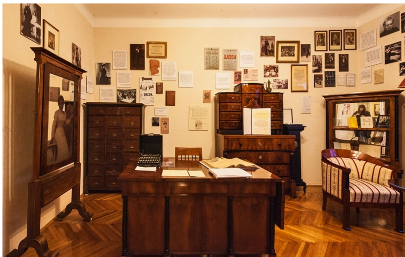
Slika 11 Stan Marije Jurić Zagorke (n.d.)