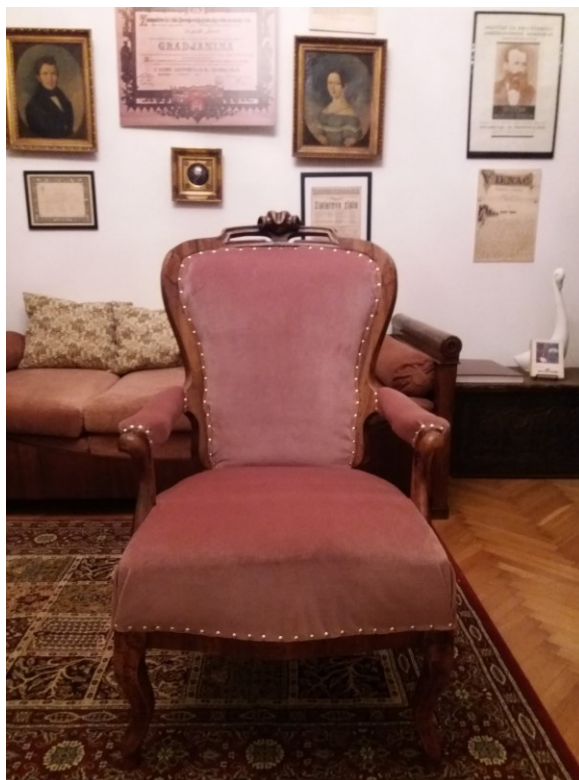
Slika 10 Naslonjač Augusta Šenoe (2022.)