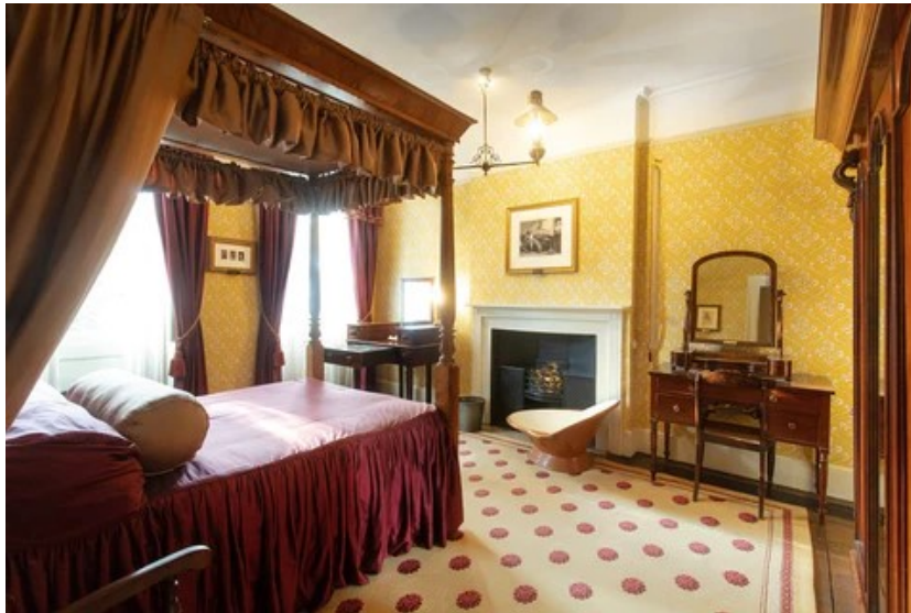
Slika 2 Spavaća soba bračnog para Dickens (n.d.)