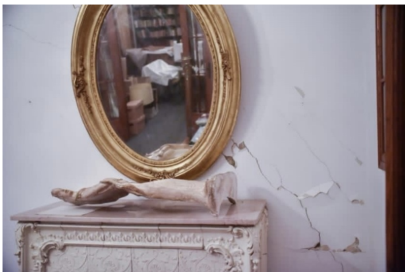
Slika 16 Ocko, L. (2023.), Oštećenja na zidu