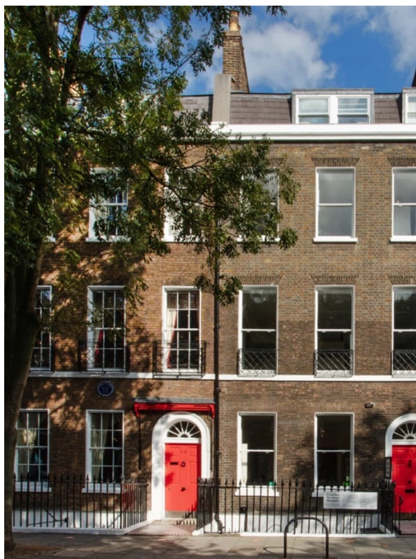
Slika 1 Ulica Dought 48 (n.d.)

Charles Dickens, rođen 7. veljače u Portsmouthu, najistaknutiji je i najčitaniji romanopisac viktorijanskoga razdoblja, jedan je od najpoznatijih engleskih pripovjedača realističkog stila. Ulica Doughty 48 (vidljiva na Slici 1) u Bloomsburyju jedini je preživjeli dom velikog viktorijanskog romanopisca. Stalni postav uključuje izvorne rukopise, portrete i prva izdanja te tri rekonstruirane sobe iz godina (1837.-39.) kada je Dickens boravio. Postoji i program privremenih izložbi, s predmetima iz muzejske zbirke, koja se smatra najvažnijom zbirkom Dickensove baštine u svijetu, i predmetima posuđenima s drugih mjesta. Muzej također ugošćuje čitateljsku grupu i prikazuje mnoge filmske verzije Dickensovih djela. Kustosi su koncipirali muzej kako bi izgledao kao kad ga je nastanjivao Charles Dickens od 1837. do 1839. Time nastojali uroniti posjetitelje u viktorijansko razdoblje. Muzej teži biti vodeći svjetski centar za proučavanje, uvažavanje i uživanje u životu i djelima Charlesa Dickensa. Viktorijanski stil života srednje klase prikazan u muzeju zaokuplja posjetitelje. Osjećaju se uronjeni u Dickensovu kuću, posebno u smislu dizajna zvuka u sobama za druženje i pažnje posvećene detaljima u namještaju. Zanima ih je kako je Dickens crpio inspiraciju iz svog stvarnog života kada je pisao svoje knjige. Posjetitelji vole zamišljati Dickensa kako sjedi za svojim pisačim stolom i stvara svoje čudesne priče (Castro, 2022).