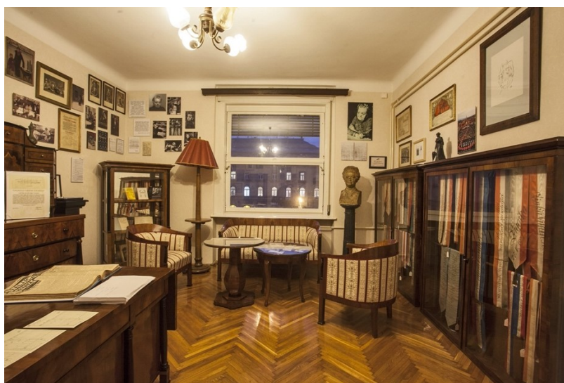
Slika 12 Dio Memorijalnog stana (n.d.)