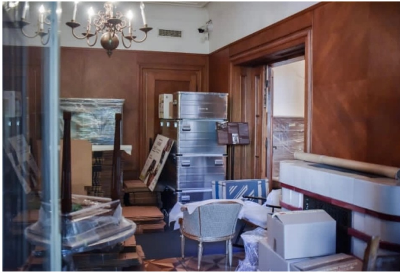
Slika 18 Ocko, L. (2023.), Namještaj i umjetnine zamotane folijom