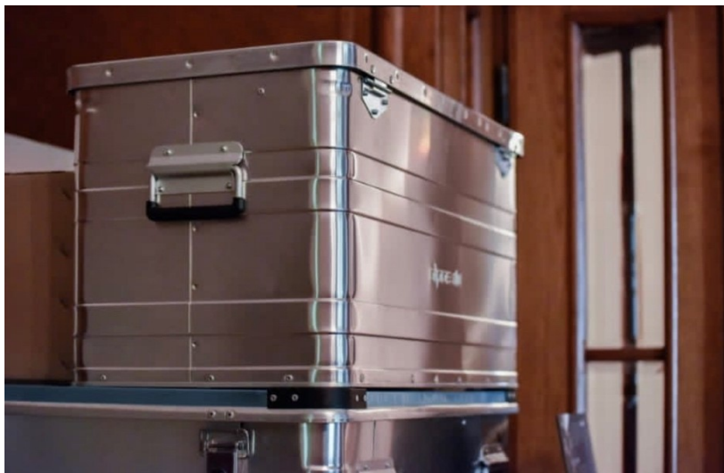
Slika 17 Ocko, L. (2023.), Aluminijski sanduci