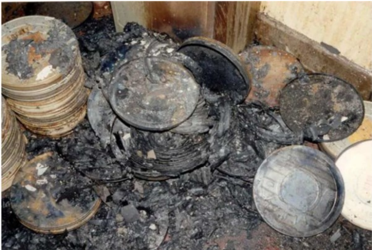
Slika 3. Izgoreni film s nitratnom bazom

dovesti do samozapaljenja filma s katastrofalnim posljedicama za ostali materijal, ljude i zgrade. 12 Film s nitratnom bazom vrlo je zapaljiv (može se samozapaliti na sobnoj temperaturi od oko 37 stupnjeva), ne može se ugasiti jednom kad se zapali te predstavlja ozbiljan rizik od požara. Film koji je na bazi ovog materijala je potrebno čuvati u što hladnijoj okolini i uvijek ispod 21 stupnja, održavati relativnu vlažnost između 30-40%, ne izlagati film izvorima topline, ukloniti iz neprozračnih spremnika za pohranu; koristiti prozračne spremnike za pohranu; držati područje za pohranu dobro prozračenim, izolirati od drugih predmeta u zbirci (nitratni film može emitirati plinove koji su štetni za ljude i druge predmete u zbirci) te na kraju potrebno je razmotriti digitalizaciju takvih filmova. 13