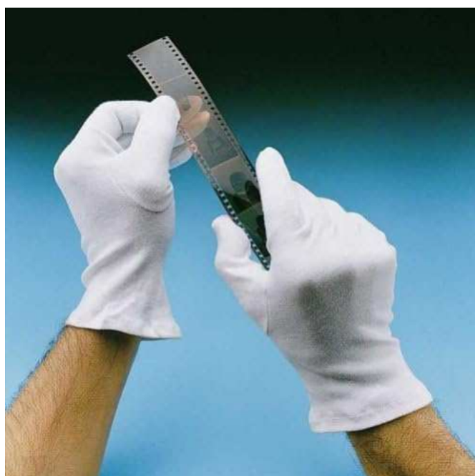
Slika 12. Rukavice za rukovanje s filmom

S filmom bi trebao rukovati samo stručnjak i trebao bi se projicirati ili kopirati samo od strane konzervatora filma. Rukovatelji bi trebali nositi rukavice od pamuka, rukovati samo s rubovima te raditi u čistom, dobro osvijetljenom i prozračenom području s dovoljno mjesta za obradu. Jedenje, pijeње ili pušenje nije dopušteno na području obrade i pregleda. Produljena izloženost propadajućim negativima može predstavljati opasnost za zdravlje, posebno kod velikih zbirki. 48