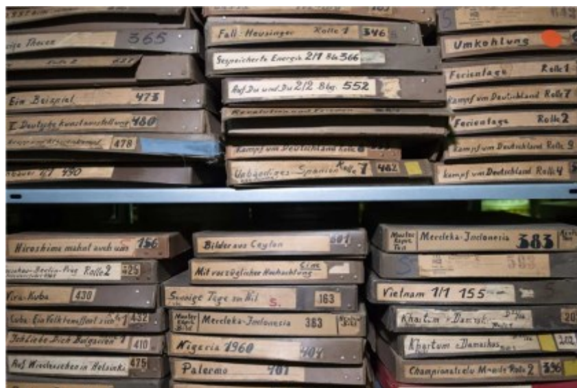
Slika 16. Filmske kutije

Film treba pohraniti u čistu arhivsku plastiku, arhivski tretirane limene kutije ili nove arhivske kartonske kutije. Važno je kutije nisu hermetički zatvorene i ne bi ih trebalo zatvarati osim ako se čuvaju u zamrzivaču. Zatvorena limena kutija koja nije zalijepljena je u redu i neće biti hermetički zatvorena. Hladno skladištenje je najbolje za kemijsku stabilnost filma. Film je uvijek potrebno pregledati prije projekcije. Limene kutije treba pohraniti vodoravno, bez da se na vrhu stavi nešto teško što bi pritisnulo poklopce i spriječilo cirkulaciju zraka u limenim kutijama. Prihvatljivo je stavljati limene kutije jednu na drugu. 56