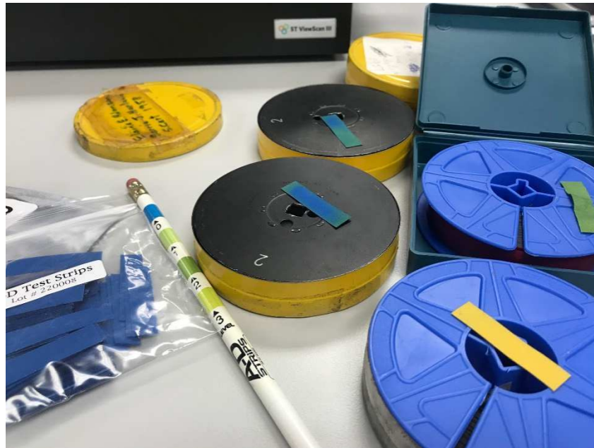
Slika 10. Testiranje filma uz pomoć traka za detekciju kiselosti