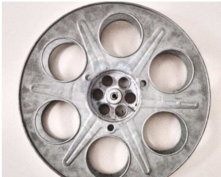
Slika 15. Metalna filmska rola