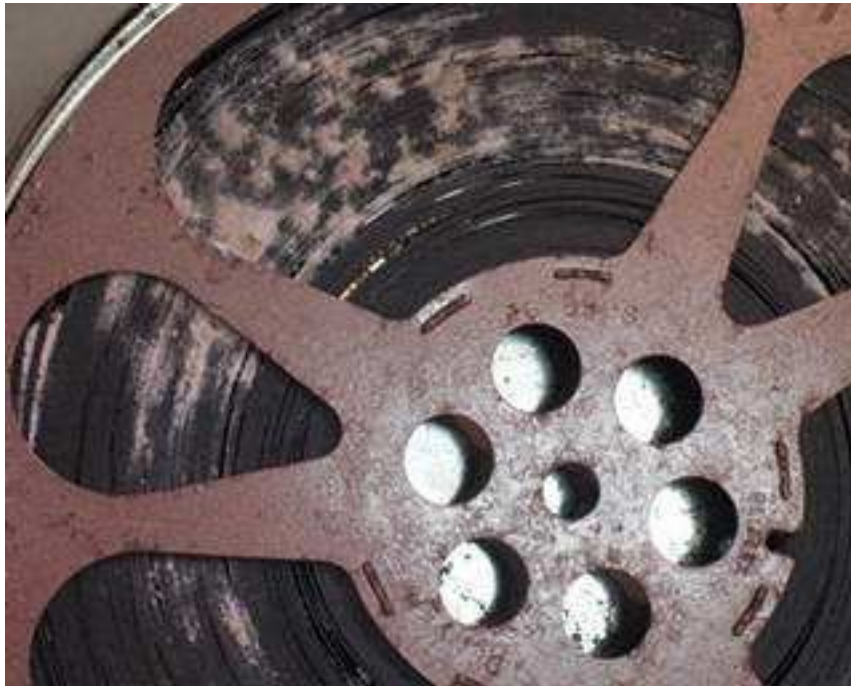
Slika 9. Plijesan na filmskoj vrpci