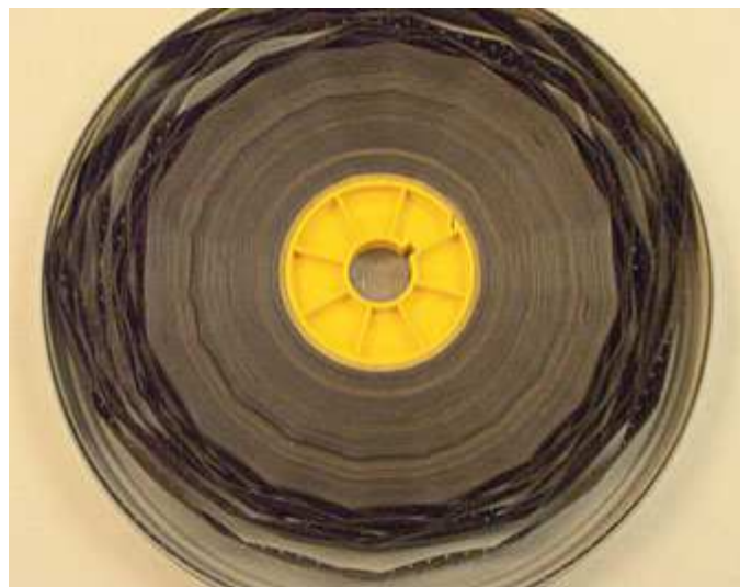
Slika 8. Propadanje acetatnog filma