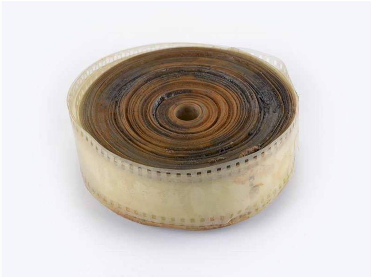
Slika 5. Film s nitratnom bazom u lošem stanju