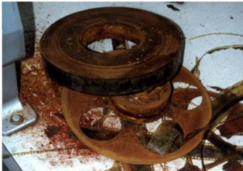
Slika 4. Film na bazi nitrata pretvoren u smeđi prah