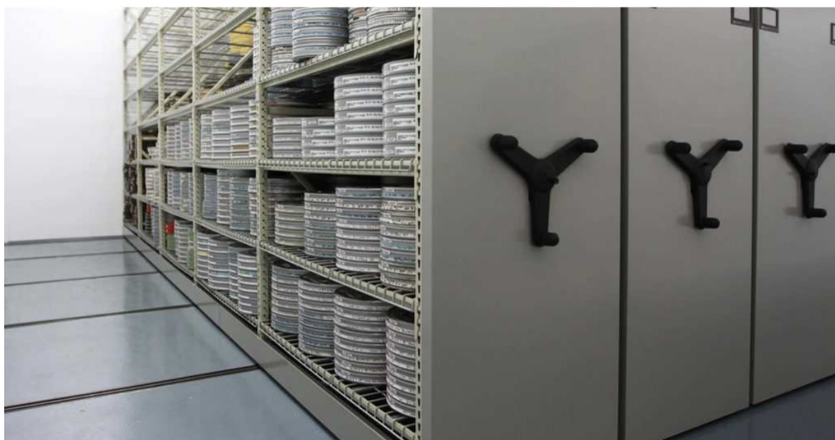
Slika 13. Pohrana filma

film na bazi acetata se prebrzo raspada za dugoročnu zaštitu materijala. Prilikom pohrane film se ne smije čuvati blizu grijača, vodovodnih cijevi, radijatora, prozora, izvora električne energije ili sudopera, ne smije se nalaziti na direktnom sunčevom svjetlu, potrebno je izbjegavati visoko vlažne prostore s toga se ne bi trebao čuvati u podrumima koji su vlažni i idealni za razvoj plijesni te također postoji opasnost od poplava. Također je potrebno izbjegavati pohranu u blizini kemikalija, boja ili ispušnih plinova. Kemijski plinovi, uključujući one koji se nalaze u svakodnevnom zagađenju zraka, u kombinaciji s visokom relativnom vlažnošću mogu uzrokovati propadanje filma i blijeđenje slika. 53