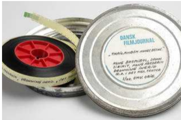
Slika 17. Označavanje filma

sustav označavanja bit će od koristi svakome tko dođe u kontakt s filmom uključujući laboratorije, arhiviste i ostale koji će doći u doticaj sa pohranjenim filmom. 57