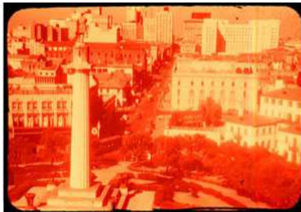
Slika 11. Blijeđenje boje