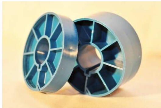
Slika 14. Filmske jezgre

da tvori čvrsti disk. Poželjno je uopće ne rukovati filmom, već koristiti limenke ili razdjelne role kao tanjуре za držanje diska filma. 54