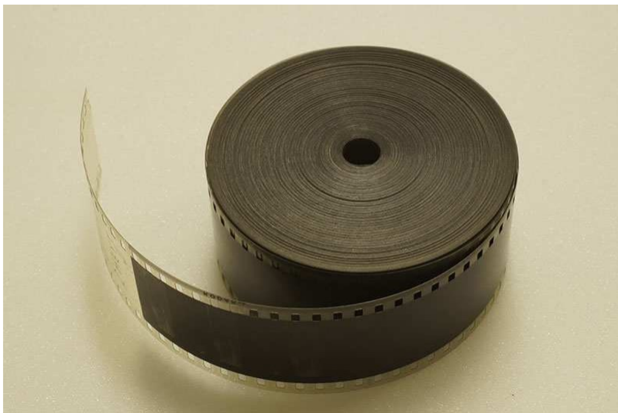
Slika 2. Filmska traka na bazi celuloznog nitrata

Godine 1887. amerikanac Hanibal Williston Goodwin, protestantski svećenik iz Newarka, prijavio je patent za celuloidnu "fotografsku opnu". Godinu dana kasnije, John Carbutt iz Philadelphije premazao je celuloid fotografskim kemikalijama. H. M. Reichenbach iz kompanije Eastman Kodak predstavio je ovu filmsku vrpcu svijetu 1889. godine. Bila je to prva plastika proizvedena sintetičkim putem koja je bila čvrsta i iznimno otporna na rastezanje te se mogla mehanički obrađivati poput metala. Korišten je u raznim plastičnim proizvodima od igračaka do telefona. Ispostavilo se da su filmske sirovine proizvedene od 1896. godine do 1950. godine u svjetskom filmu, zahvaljujući nitrocelulozi stabilniji od pojedinih kasnijih filmskih vrpca koje će ih naslijediti, posebice onih iz 1960-ih. 11