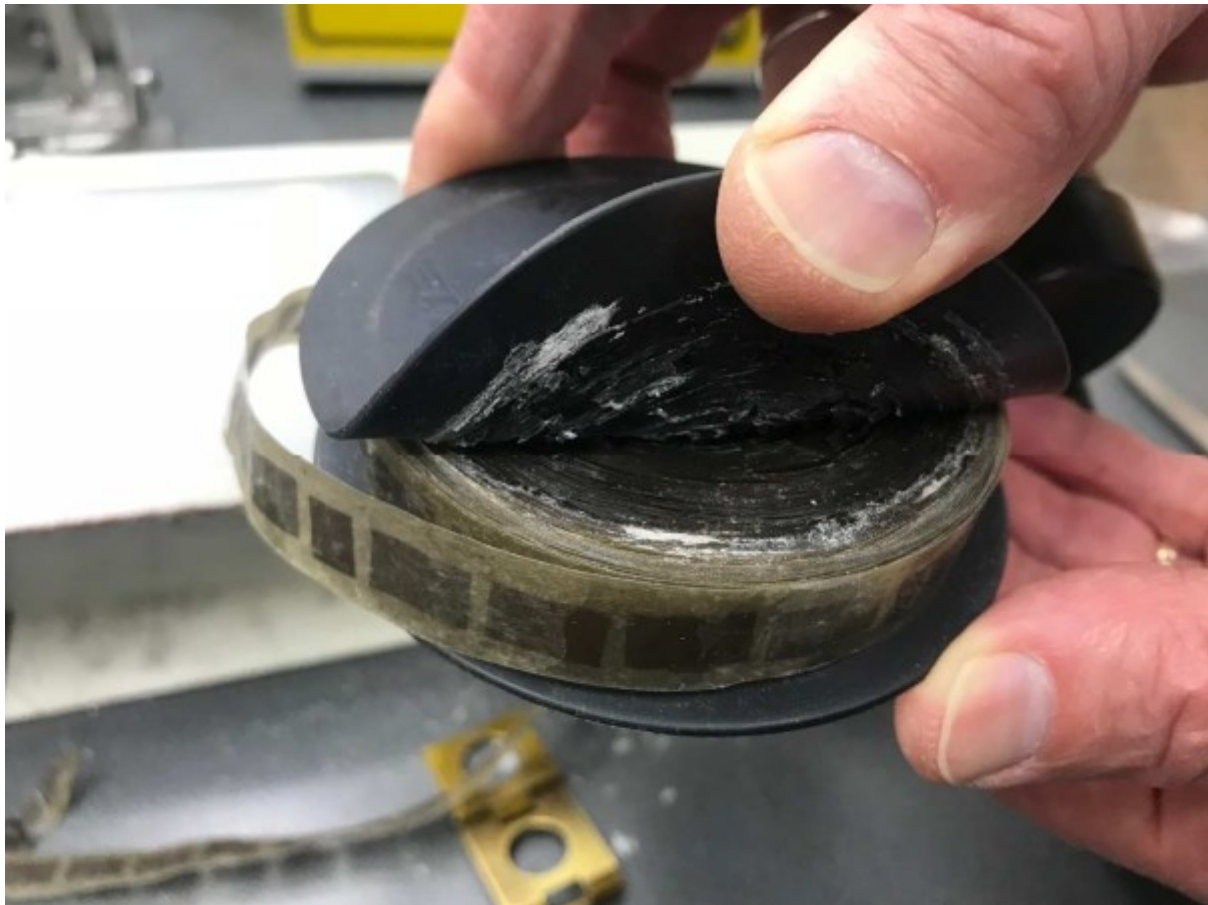
Slika 7. Sindrom vinskog octa na filmskoj vrpci

Uveden je 1935. godine, a od 1939. gotovo je potpuno zamijenio celulozni nitrat. Postupno se raspada na sobnoj temperaturi, ispuštajući plinove koji podsjećaju na miris octa - stoga se ovaj proces naziva "sindrom vinskog octa" (engl. vinegar syndrome ). Na kraju, potpuno se raspadne. Do nedavno su se filmovi na bazi celuloznog triacetata smatrali prikladnim za arhivske zapise; međutim, problemi stabilnosti postali su očiti i s ovim filmskim materijalom. 25