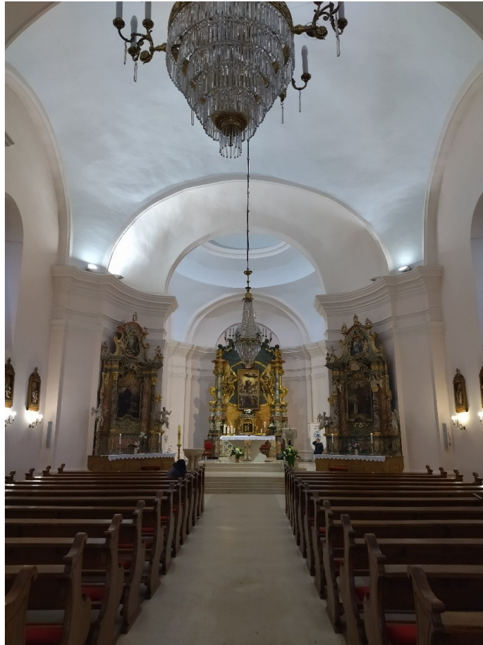
Slika 3. Unutrašnjost župne crkve Uznesenja Blažene Djevice Marije u Pakracu

Katarina Horvat-Levaj (2015.) pakračku župnu crkvu definira kao varijaciju na temu tipa crkve s travejima kupolastih svodova u odjeljku u kasnobaroknoj sintenzi centralnog i longitudinalnog prostora. 66 Pojavu ovakvog tipa crkve smješta u 50-te i 60-te godine XVIII. stoljeća, te ističe kako ona odražava nove tendencije u sjeverozapadnoj Hrvatskoj koje potom migriraju i u Slavoniju: »njome je prekinuta tradicionalna stroga podjela na longitudinalni i centralni tip te započinju različite varijacije njihove sinteze.« 67 Kao osnovne arhitektonske elemente ovog tipa navodi traveje kupolastih svodova (tzv. češke kape), dvodijelno svetište te svođeni slavluk pod utjecajem izgradnje crkve sv. Ladislava u Pokupskom. 68 Ističe izniman urbanistički smještaj same crkve na uzvisini u centru grada, 69 a do nje vodi čak pedeset osam stuba u osi ulaznih vratiju, 70 dodatno naglašavajući monumentalnost i evocirajući stubište crkve