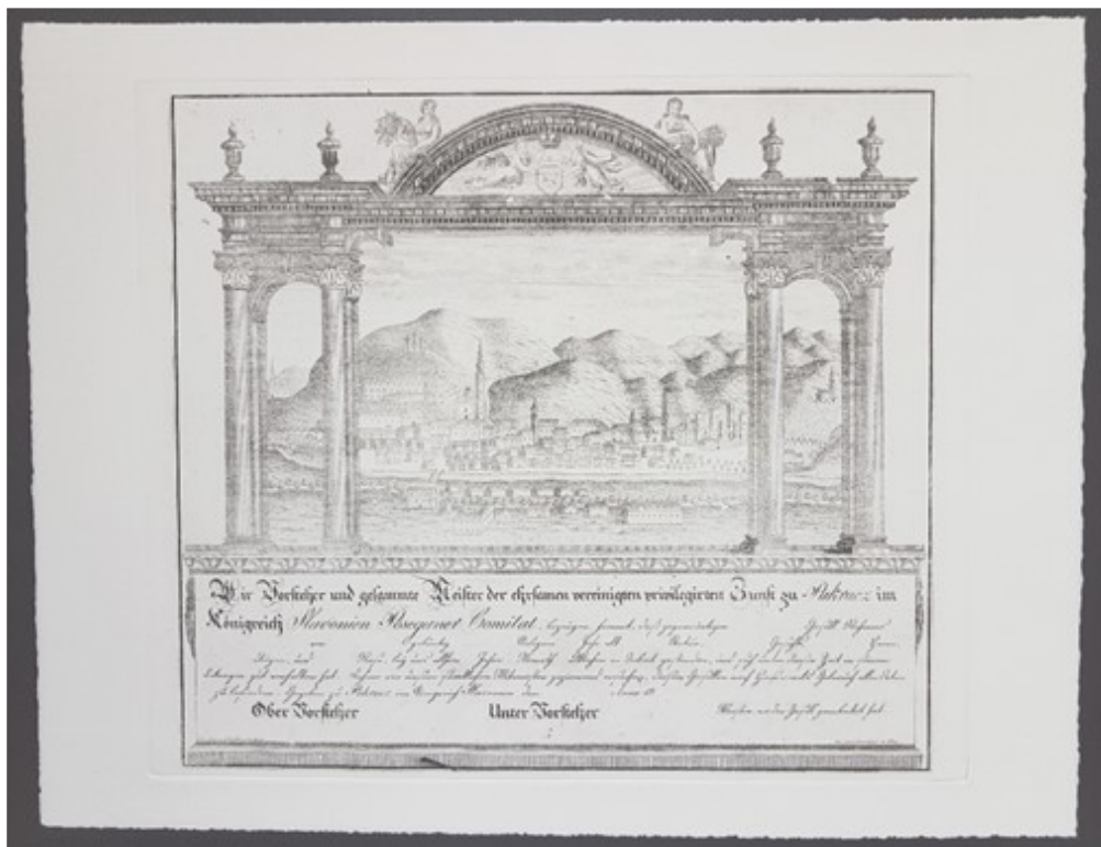
Slika 37. Bakrorez prema matrici majstorskog lista, početak XIX. st., Pakrac, Muzej grada Pakraca