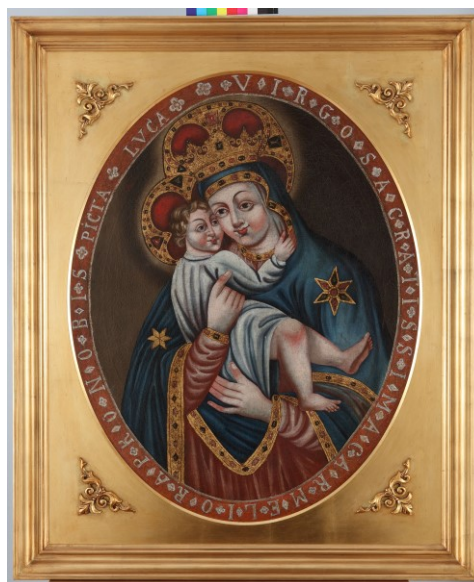
Slika 32. Nepoznati slikar, Karmelska Gospa (?), ulje na platnu, 112 x 92 cm, Dijecezanski muzej, Požega

Preostale dvije slike, danas također u Dijecezanskom muzeju u Požegi, sv. Joakim s djevojčicom Marijom i Karmelska Gospa , nalazile su se u sakristiji župne crkve. Identičnog su formata te su imena svetaca u obrubima ovala ispisana jednakim rupokisom i načinom. 202 Gospa od Karmela varijacija je ikonografskog tipa Glykofilouse ,