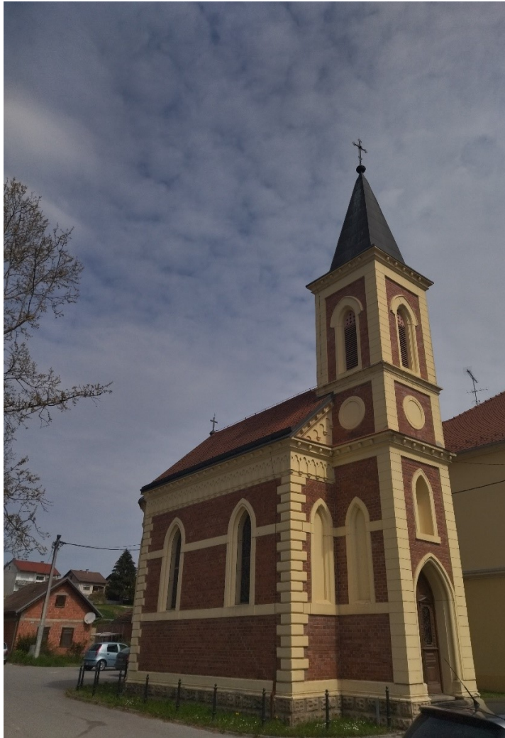
Slika 34. Kapela sv. Ivana Nepomuka, Pakrac