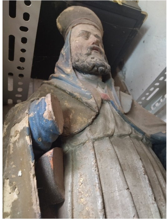
Slika 29. Nepoznati kipar, Neznani svetac , župni dvor, Pakrac

Od ostalih radova originalno namjenjenih i smještenih u župnoj crkvi odnosno sakristiji pronalazimo palu Sv. Antuna Padovanskog s Djetetom (oko 1770. godine) nepoznatog domaćeg