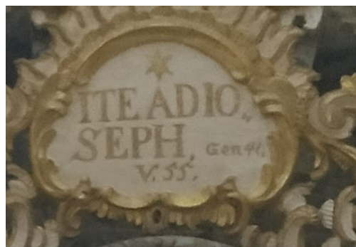
Slika 19. Nepoznata radionica, detalj bočnog oltara sv. Josipa, župna crkva Uznesenja Blažene Djevice Marije, Pakrac

Anđeli telamoni nose gređe na čijem su friznom polju izrezbareni, pozlaćeni rocaille elementi dekoracije. Ovdje je gređe također prekinuto velikim rocaille okvirom sa središnjim poljem u kojem se nalazi natpis: »ITE ADIO / SEPH Gen 41 / V.55. « Ova je inskripcija referenca na izjavu egipatskog faraona iz Knjige postanka koja u cijelosti glasi: »A kad je i sva zemlja egipatska osjetila glad, puk zavapi faraonu za kruh; a faraon reče Egipćanima: 'Idite k Josipu i što god vam rekne, činite!'« 178