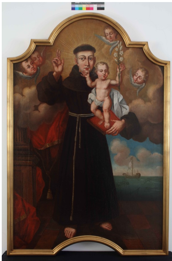
Slika 31. Nepoznati domaći slikar, Sv. Antun Padovanski s djetetom Isusom , oko 1770., ulje na platnu, 132 x 92 cm, Dijecezanski muzej, Požega.

Slika sv. Antuna Padovanskog , koja se također nalazila u župnoj crkvi i vrlo vjerojatno bila pala bočnog oltara, prikazuje frontalno pozicioniranog sveca u franjevačkom ornatu, koji u desnoj ruci drži crvenu knjigu Evanđelja na kojoj stoji dijete Isus, dok lijevu ruku podiže u gesti blagoslova. Dijete Isus ruke podiže prema nebesima a u desnoj ruci drži cvijet ljiljana, otprije spomenuti simbol čistoće. U usporedbi s prijašnjim primjerom sv. Josipa kao jednog od Kristovih zaštitnika na zemlji, vrlo je jasan drugačiji pristup izvedbi likova na ovome prikazu. Sv. Antun Padovanski i Dijete iznimno su statični i frontalni. Draperija koja se obavija oko Djeteta oštro je nabrana međutim doima se plošnom. Izduženim prstima i neproporcionalnim glavama, prikazi dvaju likova evociraju standardne ikone. Pozadina je asimetrična – s lijeve se strane naziru obrisi drvene strukture obavijene bogato nabranim,