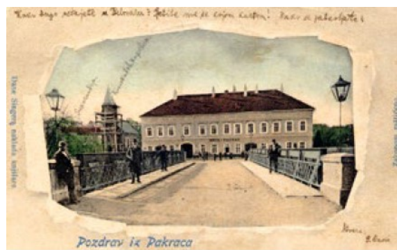
Slika 35. (lijevo) Razglednica iz 1899.