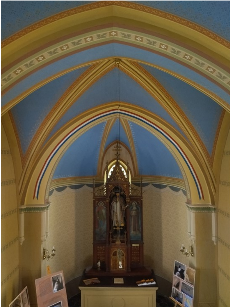
Slika 38. Unutrašnjost kapele sv. Ivana Nepomuka, Pakrac

šiljastim zaključkom u središnjem dijelu, s pozlaćenim floralnim i lisni motivima te križem na samom vrhu. Nad bočnim se dijelovima nalaze intrikatno izrezbareni polukružni završeci također s floralnim motivima, koji se sitim rokajnim elementima na volutama nadovezuju na središnji dio oltara.