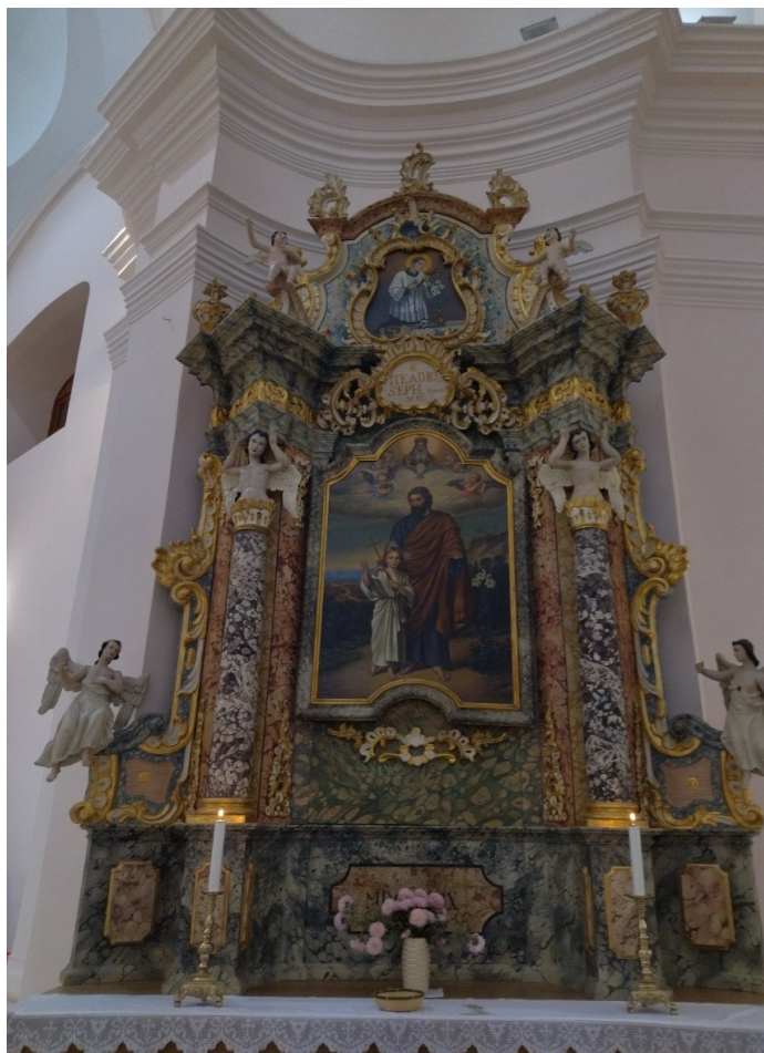
Slika 17. Nepoznata radionica, bočni oltar sv. Josipa, 1768. – 1769., župna crkva Uznesenja Blažene Djevice Marije, Pakrac

Na plavoj mramoriziranoj predeli nalazimo i dataciju oltara: »MDCCLXIX / Die 17. Marti.« odnosno 17. ožujak 1769. godine. Ponad predele i tik ispod pale sv. Josipa nalazi se dekorativni rocaille element te počinje dominantni središnji dio oltara. Arhitektonski okvir čine stupovi nedefiniranog reda s pozlaćenim postoljima i figurama anđela koji nose gređe po uzoru na telamone odnosno atlase, muške figure pandane karijatidama,