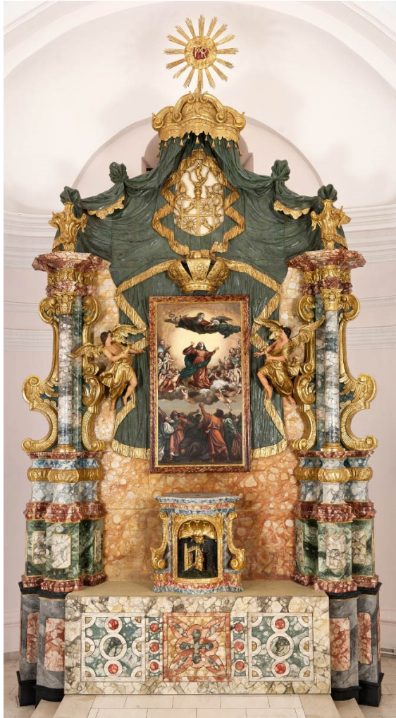
Slika 4. Radionica Franje Antuna Strauba, Glavni oltar, 1760., polikromirano i pozlaćeno drvo, župna crkva Uznesenja Blažene Djevice Marije, Pakrac

Kao glavni donator i naručitelj djela Franje Antuna Strauba spominje se zagrebački biskup Franjo Thauszy (Lipnik, 1698. – Zagreb, 1769.; zagrebački biskup od 1751. do 1769.). Thauszy je poseban trud ulagao u napredak i poboljšanje slavenskog dijela zagrebačke biskupije, 105 što objašnjava biskupov angažman u pitanju izgradnje pakračke župne crkve, te njezinog opremanja novim inventarom. Kako iznosi već Doris Baričević, biskup Thauszy ne samo da je bio donator glavnog oltara ove crkve, što je evidentno po njegovu grbu istaknutom na samom oltaru, nego je za isti donirao i sliku Majke Božje Częstochowske koju je nabavio iz Poljske. 106