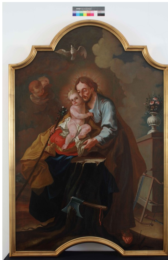
Slika 30. Johannes Glavitsch, Sv. Josip s Djetetom , 1768., ulje na platnu, 130 x 91 cm, Dijecezanski muzej, Požega

Djelo sv. Josip s Djetetom autora Johannes Glavitscha prijašnja je pala bočnog oltara župne crkve te je datirana u 1768. godinu prema signaturi u lijevom donjem kutu »Joh. Glavitsch pinx. Possega 1768.« 195 Na slici je u središtu kompozicije prikazan sv. Josip koji u naručju drži Dijete Isusa koji sjedi na bogato urešenom jastuku. Sv. Josip u lijevoj ruci koju obavlja oko Djeteta Isusa drži rascvjetali štap dok drugom nježno pridržava jastuk na kojemu sjedi Isus. Podno njih nalaze se simboli Josipova zanata – deblo u kojemu je zarivena sjekira, pila te dlijeto. Dijete Isus se rukama pridržava za sv. Josipa te gleda dirketno u promatrača dok je sv. Josipu pogled spušten prema dolje. Iznad njih se nalazi bijela golubica u letu prema gore, simbol Svetog Duha, te glave dvaju puta koji lebde promatrajući prizor. Scenografija ovog prizora relativno je nedefinirana – likovi su smješteni ispred