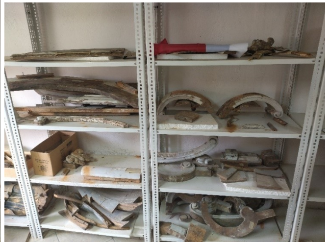
Slike 27 i 28. Nepoznati majstor, dijelovi propovjedaonice, župni dvor, Pakrac