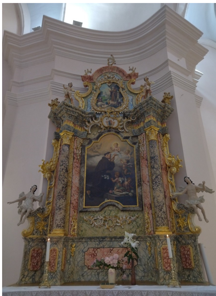
Slika 10. Nepoznata radionica, bočni oltar sv. Antuna, 1768. – 1769., župna crkva Uznesenja Blažene Djevice Marije, Pakrac

Oltar sv. Antuna s lijeve strane strukturalno je raspodijeljen na tri dijela; predelu, središnji dio pale sa slikom sv. Antuna Padovanskog te atektonski zabatni zaključak oltara sa slikom sv. Antuna Opata u nepravilnom zabatnom polju. Cijeli je oltar mramoriziran u plavim i crvenim tonovima, s pozlaćenim detaljima kojih je, doduše, znatno manje negoli na glavnom oltaru. Nadalje, za razliku od glavnog oltara, koji dinamizira strukturu primjenom baldahina i draperije, oltar sv. Antuna arhitektonski je stabilniji.