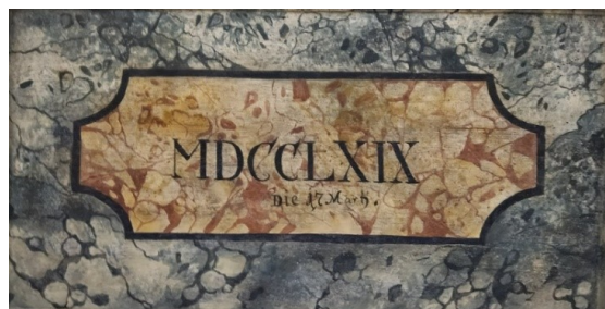
Slika 18. Nepoznata radionica, detalj bočnog oltara sv. Josipa, župna crkva Uznesenja Blažene Djevice Marije, Pakrac