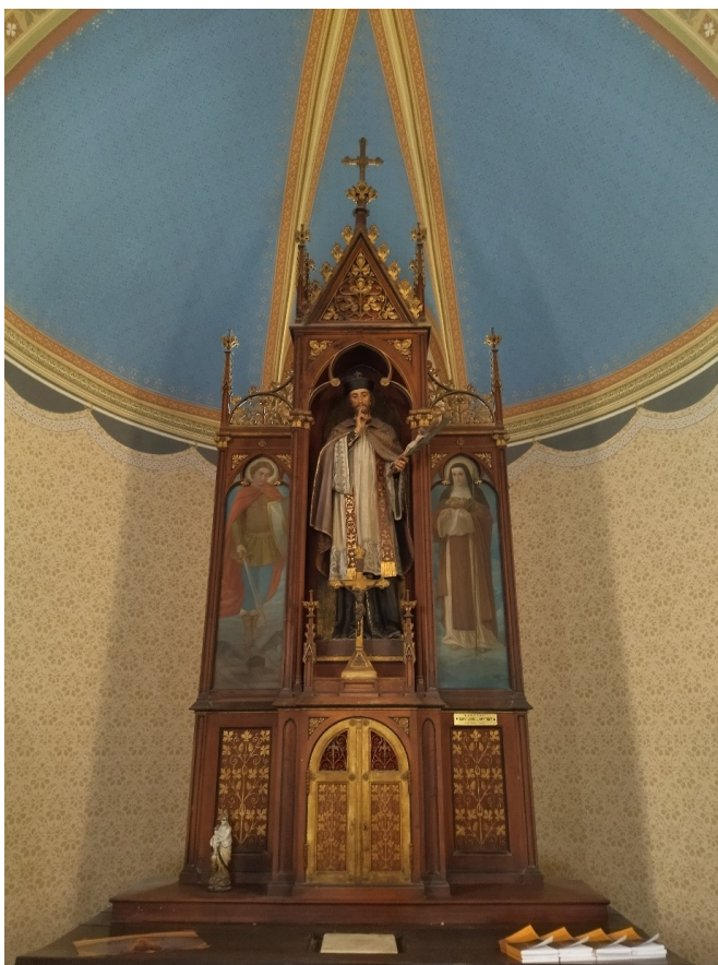
Slika 39. Radionica Ferdinanda Stuflessera, Oltar sv. Ivana Nepomuka, 1903., kapela sv. Ivana Nepomuka, Pakrac

U središtu oltara, u trolisno zaključenoj niši, nalazi se drvena skulptura sv. Ivana Nepomuka u svećeničkoj opravi, s dekorativnim detaljima izvedenima u zlatu, preko kojih nosi pelerinu. Nad glavom mu se nalazila aureola od metala na kojoj je, vrlo vjerojatno, bilo postavljeno pet zvijezda, već spomenutog svečeva simbola, međutim one trenutno nisu prisutne.