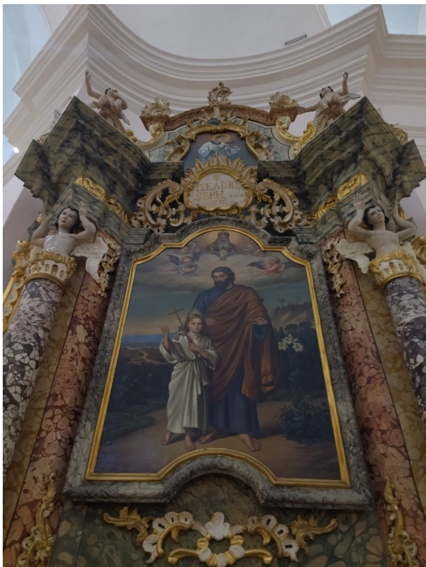
Slika 20. Nepoznati slikar, pala bočnog oltara sv. Josipa, župna crkva Uznesenja Blažene Djevice Marije, Pakrac

je iskoraku te smirene ekspresije gleda prema promatraču. On u desnoj ruci drži križ, dok lijevu diže prema nebesima. S desne strane nalazi se visoki bijeli ljiljan, već spomenuti simbol nevinosti. Ponad njih, među oblacima koji obuzimaju cijelu gornju trećinu platna, te u vertikalnoj osi sa sv. Josipom, nalaze se prikazi Boga Oca te Duha Svetoga, okruženi nekolicinom anđela. Uvrštavanjem prikaza Boga Oca te Duha Svetoga, na prikazu je vizualno objedinjeno Presveto Trojstvo, Isusovi nebeski i zemaljski oci.