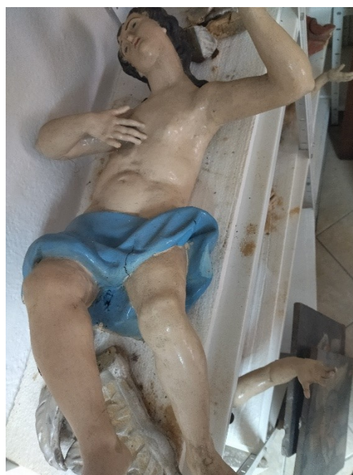
Slike 23 - 26. Nepoznati kipar, Andeli , župni dvor, Pakrac