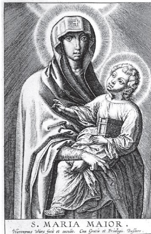
Slika 8. (lijevo) Salus Populi Romani , XIII. stoljeće, bazilika Santa Maria Maggiore, Rim