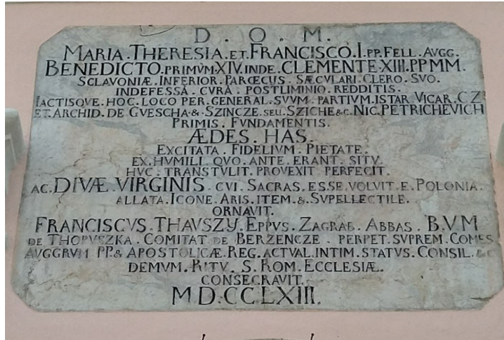
Slika 1. Ploča s latinskim natpisom na pročelju crkve, župna crkva Uznesenja Blažene Djevice Marije u Pakracu

Vijoleta Herman-Kaurić, prema Rudolfu Horvatu odnosno kanoniku Josipoviću, definira dimenzije crkve koje se ne podudaraju s onima navedenima u ranijim vizitacijama iz 1757. te 1761. godine: dužina je sada 16, a širina 8 hvati (30,35 x 15,18 m). 49 U vizitaciji iz 1780. godine spominje se i zvonik visine 16 ½ hvati (31,30 m) koji je pozicionaran paralelno pročelju na desnoj bočnoj strani, 50 te završava crveno obojenom drvenom