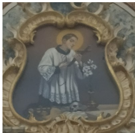
Slika 21. Nepoznati slikar, bočni oltar sv. Josipa, detalj – Sv. Alojzije Gonzaga, župna crkva Uznesenja Blažene Djevice Marije, Pakrac

Treći, ujedno i završni, dio oltarnog sklopa sastoji se od polukružno zaključenog zabatnog polja, obrubljenog konveksno-konkavnim, pozlaćenim rocaille elementima, na čijim se rubovima nalaze skulpture anđela, znatno manjih dimenzija od onih na donjim dijelovima oltara. Na samom polukružnom zaključku također nalazimo rocaille dekorativne elemente a u središtu polja, u intrikantnom rocaille okviru, nalazi se slika sv. Alojzija Gonzage. Isusovački je klerik, često nazivan »djevičanskim mladićem«, 185 prikazan u pobožnoj gesti, u klečećem položaju, kako u rukama drži krunicu i križ, dok se ispred njega nalaze vaza s ljiljanom (simbolom čistoće), lubanja (simbol preuranjene svečeve smrti, memento mori ) te kneževska krunom (simbol njegova plemićkog porijekla). Svi se ovi simboli