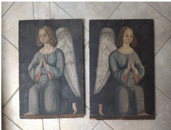
Slika 22. Nepoznati slikar, Andeli , župni dvor, Pakrac

Propovjedaonica, za koju se smatra da je nabavljena otprilike u isto vrijeme kao i ostatak inventara za novoizgrađenu župnu crkvu, trenutno je rastavljena te se u dijelovima čuva u župnom dvoru. Spominje se u vizitaciji iz 1780. godine, gdje ju se smješta na desnu stranu, između broda crkve i svetišta, te je opisana kao drvena, polikromirana i djelomično pozlačena. Na njoj su reljefi predaje ključeva sv. Petra i slika raskajanog Petra. 188 Izrada je sufinancirana sredstvima biskupa Ivana Paxyja, te župe. 189