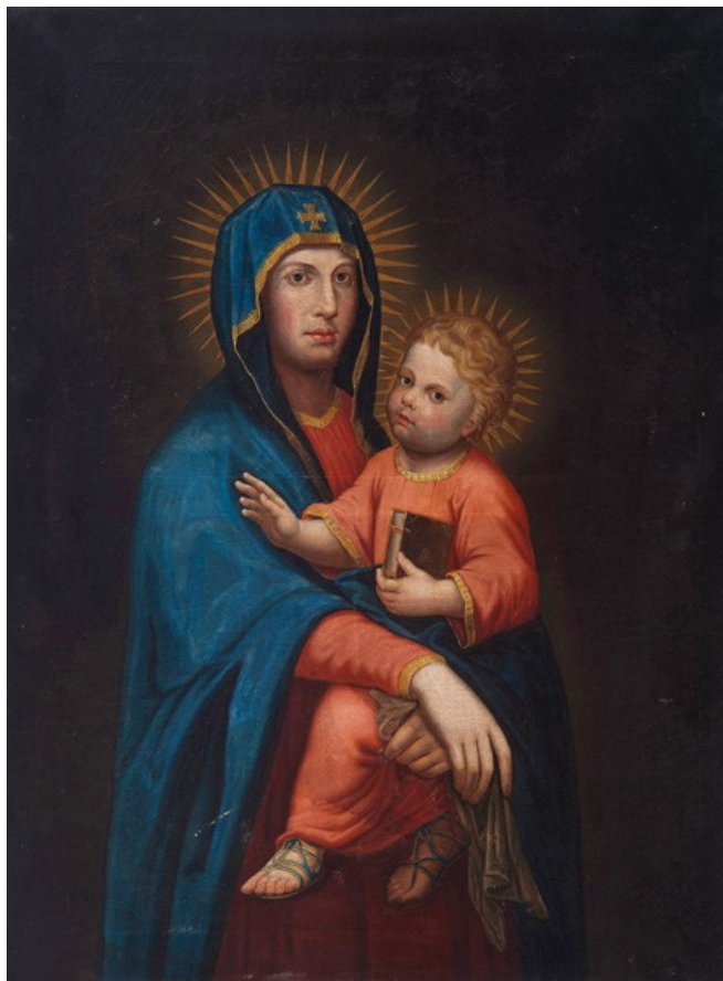
Slika 7. Peter Traber, Bogorodica s Djetetom , 1844., ulje na platnu, 135.5 x 104.5 cm, Dijecezanski muzej, Požega

Pakračka Bogorodica s Djetetom očekivana je interpretacija Hodegetrijskog tipa Salus Populi Romani – smještena u nedefiniranom, tamnom prostoru, frontalno pozicionirana figura Bogorodice ovijena u modri plašt, koji uvelike uniformizira tjelesne konture, u svome naručju drži dijete Isusa koje u jednoj ruci drži knjigu, dok drugom blagoslivlja promatrača. Na plaštu iznad Bogorodičina čela pronalazimo grčki odnosno pattée križ te se ponad njihovih glava, umjesto aureole u obliku kružnice koje krase prikaze originalne Salus Populi Romani , nalaze zrakaste aureole. Iako su sami likovi, shodno duhu i senzibilitetu razdoblja u kojem nastaju, elegantnijih pokreta, mekših kontura, zaobljenijih figura, te obavijeni u draperije čija formalna obrada evocira njihovu materijalnost i tjelesnost, izrazi lica pak nedvojbeno odražavaju dostojanstvenu ozbiljnost originalne ikone aproprirane izvan svog originalnog povijesnog konteksta. Kopiranje starih, populariziranih i općeprihvaćenih predložaka obično objedinjuje