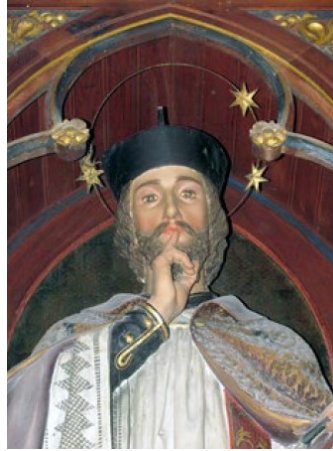
Slika 40. Radionica Ferdinanda Stuflessera, Sv. Ivana Nepomuk, detalj.

Fotografija koju Mario Barač prilaže u svom radu (slika 40) pokazuje kako se u tom trenutku na spomenutoj aureoli nalaze samo tri zvijezde, s praznim mjestima za još dvije. Svetac u desnoj ruci drži raspelo dok lijevu prinosi usnama u gesti prsta na usnama kao simbola ispovjedne tajne karakteristične za sv. Ivana Nepomuka. Pogled sveca uperen je prema dolje odnosno prema promatraču koji se nalazi podno oltara.