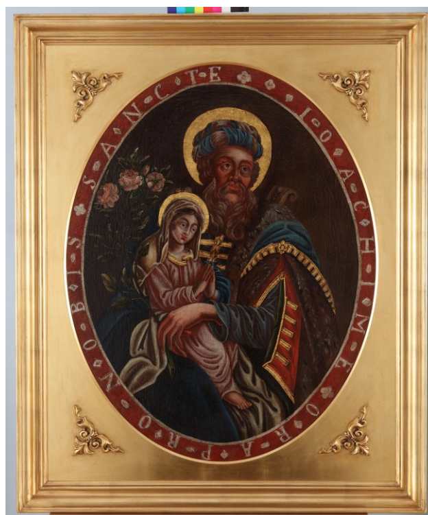
Slika 33. Nepoznati slikar, Sv. Joakim s djevojčicom Marijom , ulje na platnu, 112 x 92 cm, Dijecezanski muzej, Požega

Prikaz Sv. Joakima s djevojčicom Marijom također je opasan natpisom u crvenom obrubu te on glasi: »SANCTE IOACHIME ORA PRO NOBIS.« U usporedbi sa stiliziranim prikazom Karmelske Gospe, sv. Joakim i Marija na ovoj su slici prikazani gotovo realistično u pogledu lica, proporcija i položaja tijela. Iako lica još uvijek evociraju ikone, posebice po istaknutim linijama nosa i obrva, izrazi su individualiziraniji i prirodniji. Sv. Joakim, odjeven u bogatu odoru sastavljenu od teških, zlatom prošivenih draperija te krzna, u naručju drži mladu Mariju te skreće pogled prema