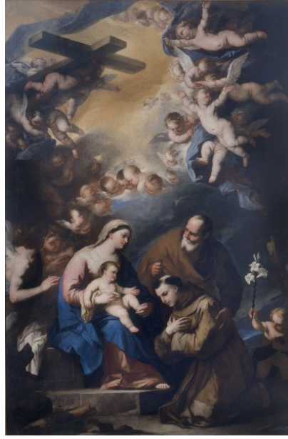
Slike 12 – 16. Djela s prikazima sv. Antuna Padovanskog (od gore, s lijeva na desno):

12. Luca Giordano, Sv. Antun Padovanski , 1634. – 1705., kreda i akvarel na papiru, 31.9 x 21.8 cm, National Gallery of Art, Washington