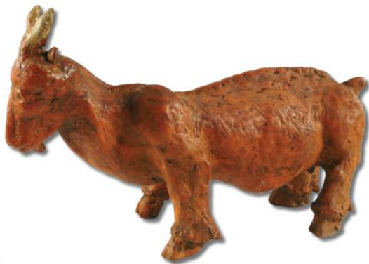
Slika 9 Jarac

tijelo mi je neproporcionalni i izduženo. Skulptura Seoskog dvorišta iz 1976. godine jedina je skulptura ovog tipa u autorovom opusu. Prikazuje likove devet životinja koje su grubo modelirane, bez razrađenih detalja, ali sa prepoznatljivim karakteristikama. Za razliku od ostalih Ferlanovih radova, ovo je jedini koji nije namijenjen za pregled sa svih strana. 20