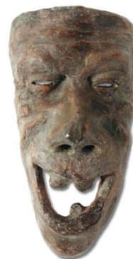
Slika 7 Maska II.