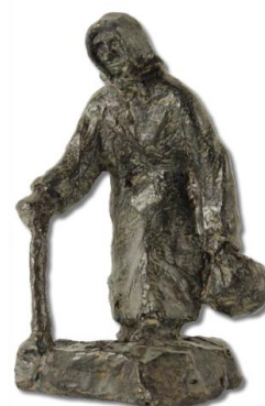
Slika 5 Starica