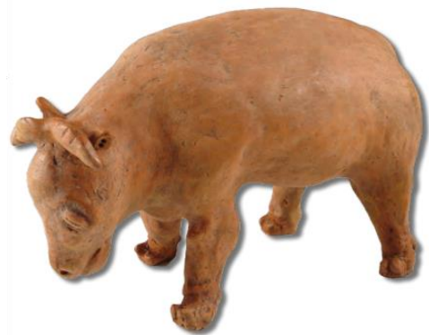
Slika 10 Krava