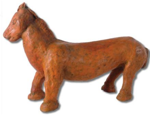
Slika 12 Konj