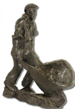
Slika 4 Radnik s tačkama