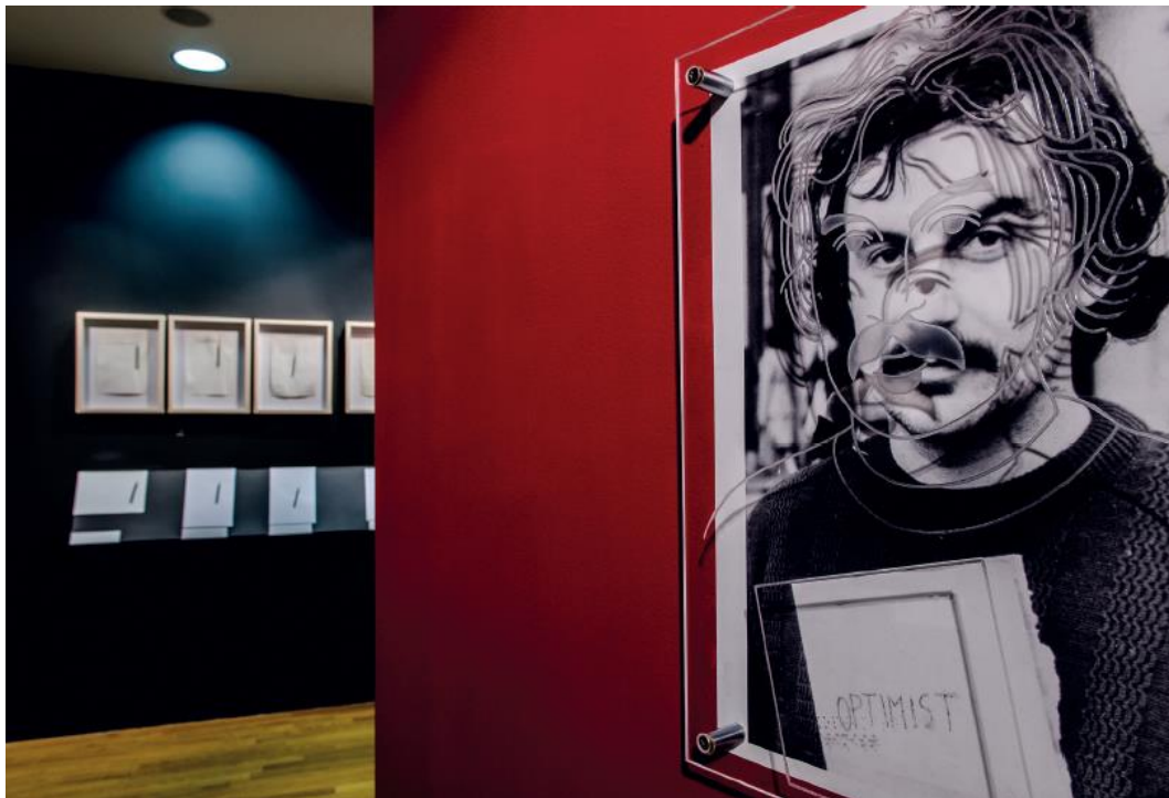
Slika 19 Izložba Vlado Martek – čitanje gledanje

fotografije. Svaki rad na izložbi je popratio zvučni opis, pri čijoj je izradbi sudjelovao i sam Vlado Martek tako de je s time doseguta visoka kvaliteta opisa rada. 28