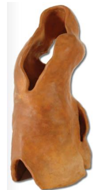
Slika 17 Pulena