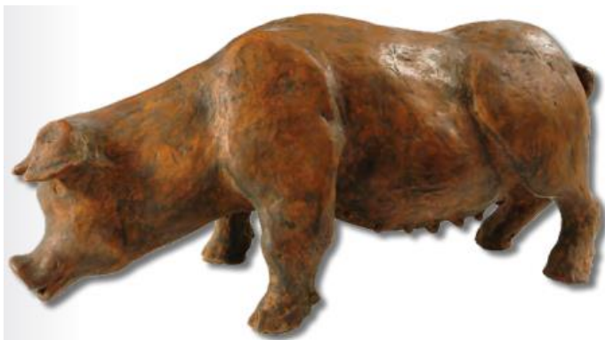
Slika 11 Svinja (izvor: Stalni postav, Katalog stalnog postava Tiflološkog muzeja)