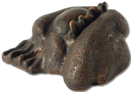
Slika 16 Stvaranje