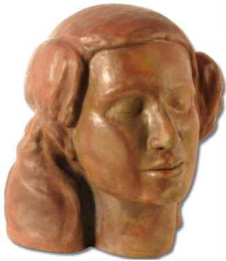
Slika 15 Modrica

skulptura izduženog valjkastog oblika sa šupljinom iznutra. Ova skulptura te Razgovor su izložene uz kopije od akristala koje su dostupne na dodir posjetiteljima. 22