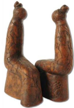
Slika 16 Razgovor