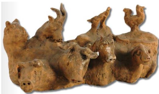
Slika 13 Seosko dvorište