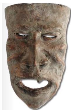
Slika 6 Maska I.