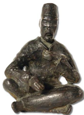
Slika 3 Rahat Efendija

Od radova Remzije Đumišića koji se nalaze u fundusu Tiflološkog muzeja, njih pet je izloženo u stalnome postavu – Rahat Efendija , Maska I. i Maska II. , Radnik s tačkama te Starica . Skulptura Rahat Efendija , nastala u drugoj polovici 20. stoljeća, izrađena od patinirane bronce, grublje je modelirana, s tragovima kiparovih prstiju, bez finih detalja. Maska I. i Maska II. , skulpture također iz druge polovice 20. stoljeća, izrađene od patinirane terakote, predviđene su da budu izložene u paru, a u stalnom postavu uz originale su izložene i njihove kopije izrađene od akristala te su dostupne za dodir posjetitelja. Vrlo realistična skulptura Radnika s tačkama iz 1960. godine, izrađen od patinirane terakote, grubo je modeliran cijelom površinom izuzev lica koje je izuzetno precizno obrađeno, do najsitnijih detalja fizionomije. U skulpturi Starice iz 1960. godine, izrađene od patinirane terakote, umjetnik je vrlo vjerno uspio prikazati tipičan lik svih starica koje su pogrbljene s godinama. Površina skulpture je nezaglađena te otkriva tragove prstiju i alata. Sve izložene skulpture su otkupljene od autora. 18