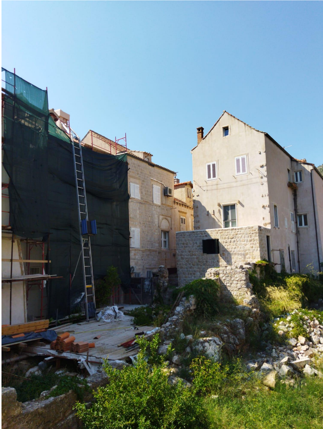
Slika 4: Pogled na Bandurevu 6 (zgrada desno od skele s četiri prozora) od strane bastiona Svetog Spasitelja