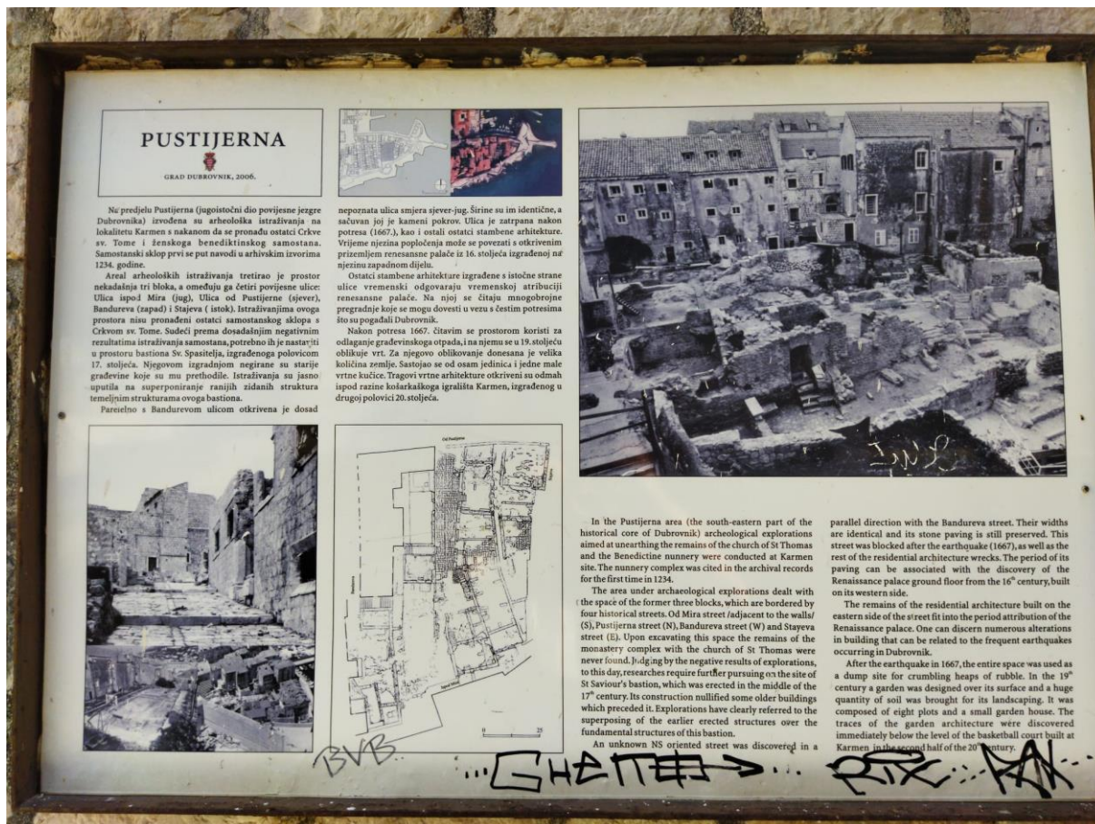
Slika 6: Ploča koju je postavio Grad Dubrovnik 2006. Ulici ispod Mira s objašnjenjem okolnosti nastanka i razvoja „ruševina“ na Pustijerni