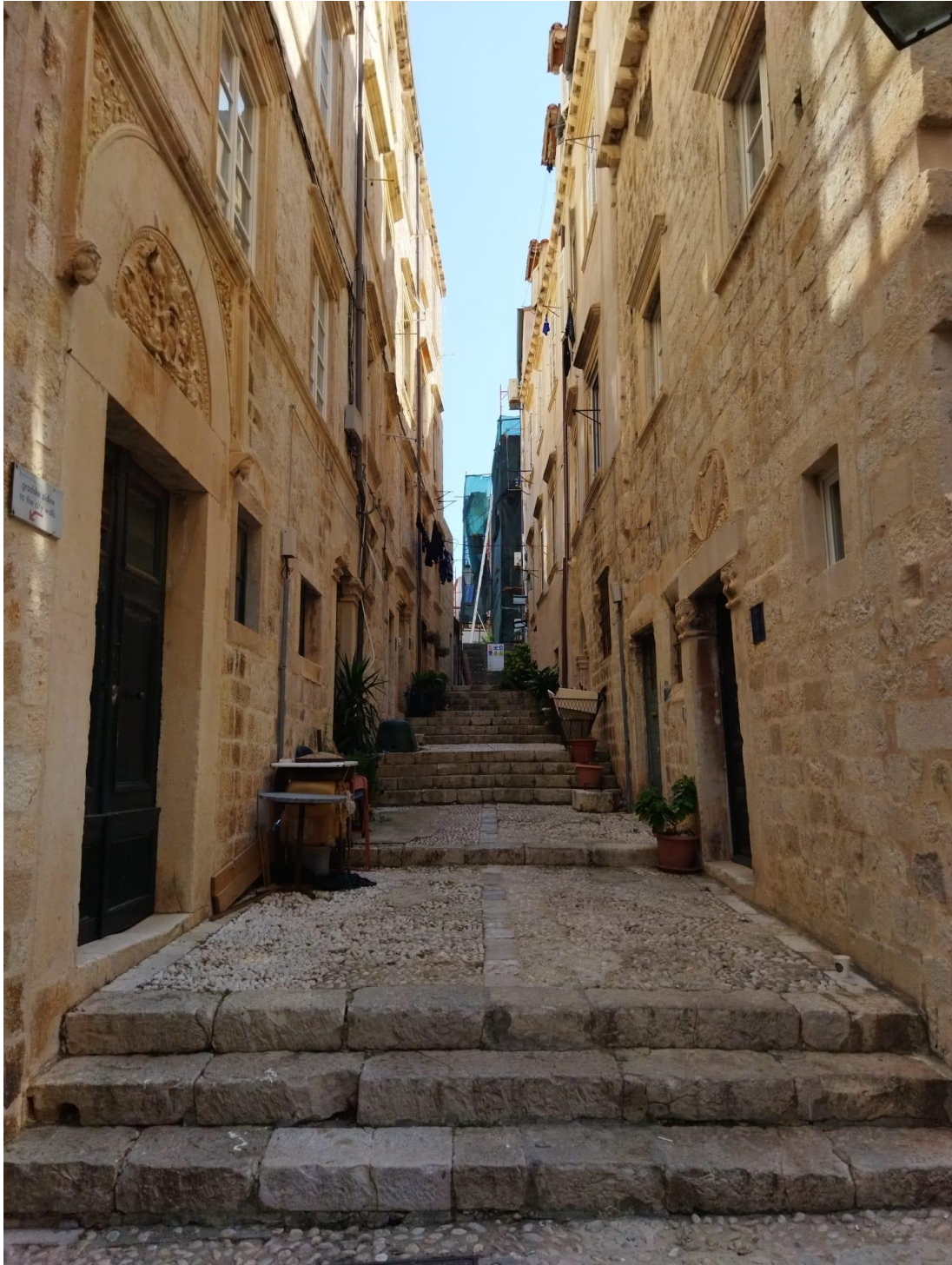
Slika 3: Bandureva, pogled s „dna“ ulice