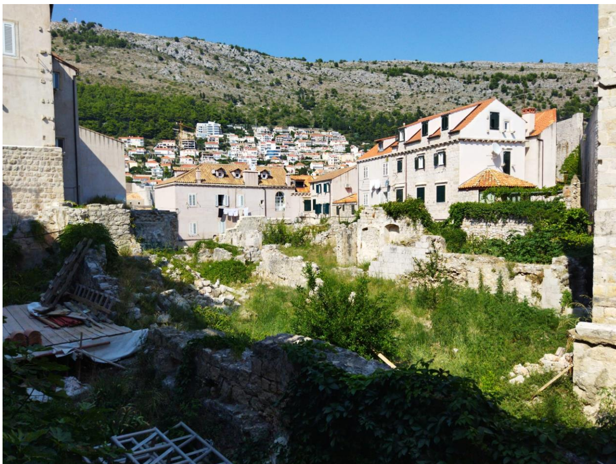
Slika 5: „Ruševine“ na Pustijerni - 22. 8. 2023.