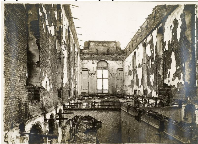
Slika 1. Velika dvorana knjižnice u Leuvenu nakon požara 1914. godine

Ova knjižnica je doživjela dva uništenja u 20. stoljeću. Prvi se dogodio u Prvom svjetskom ratu. Knjižnicu su zapalili njemački vojnici 25. kolovoza 1914. godine pomoću benzina (Ovenden, 2020) u šestodnevnim neredima diljem grada (slika 1) (Knuth, 2006). Uništen je skoro cijeli fond, od modernih tiskanih knjiga do rukopisa i rijetkih knjiga. U svega nekoliko sati uništeno je 300 000 jedinica građe (UNESCO, 1996); 1000 inkunabula, na 750 srednjovjekovnih rukopisa te druge rijetke i moderne knjige (Knuth, 2006). Nakon rata, knjižnica je obnovljena zahvaljujući mnogobrojnim donacijama koje su dolazile ponajviše iz Velike Britanije. Sjedinjene Američke Države pomogle su prikupiti novčana sredstva za izgradnju nove zgrade koja je 1925. godine počela s izgradnjom, a 1928. godine napokon je završena. Knjižnica je bombardirana 16. svibnja 1940. godine (Ovenden, 2020). Uništeno je 900 000 jedinica građe, od kojih 800 rukopisa te sve inkunabule (UNESCO, 1996). Svega 20 000 knjiga je preživjelo bombardiranje, a zgrada koja je trebala biti otporna na vatru pokazala se jednako krhkom kao i ona prethodna (Ovenden, 2020). Za oba napada odgovorni su Nijemci (UNESCO, 1996). Knuth (2006) smatra da je drugo uništenje bilo planirano jer se radilo o osveti za loše stanje njemačke ekonomije kao posljedice ratnih odšteta za Prvi svjetski rat.