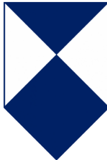
Slika 3. Znak Haške konvencije iz 1954. godine

Haška konvencija iz 1954. godine prvi je internacionalno prihvaćen sporazum čiji je sadržaj isključivo fokusiran na zaštitu kulturnih dobara za vrijeme oružanih sukoba (The Blue Shield, n.d.).