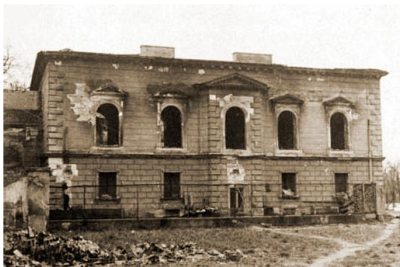
Slika 2. Knjižnica Zamoyski

Gubitci za Poljsku su bili neprocjenjivi. Tijekom rata je uništeno 70% knjiga. Od 22 500 000 svezaka koji su se prije rata nalazili u narodnim knjižnicama, samo je 7 500 000 preživjelo (Borin, 1993). Po nekim procjenama uništeno je 90% zbirki školskih i narodnih knjižnica. Sveučilišna knjižnica u Varšavi imala je gubitak od milijun knjiga, a Varšavska gradska knjižnica imala je gubitak od 300 000 knjiga koje su zapaljane u noći evakuacije (Knuth, 2006).