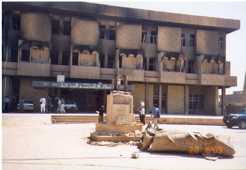
Slika 2. Nacionalna knjižnica Iraka

Po nekim procjenama uništeno je 25% knjiga iz Nacionalne knjižnice (Al-Tikriti, 2007). Uništeno je 500 000 knjiga i serijskih publikacija, uključujući 5000 rijetkih knjiga (K., 2003). Prema procjeni Báeza (2008), iz knjižnice je nestalo oko milijun knjiga. Točne procjene nestalih knjiga iz iračkih knjižnica su teško moguće zbog nepotpunih kataloga (Kam, 2004).