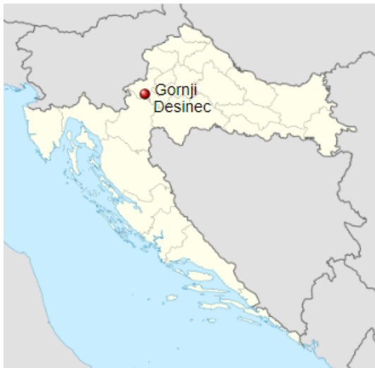
Lokacija Gornjeg Desinca