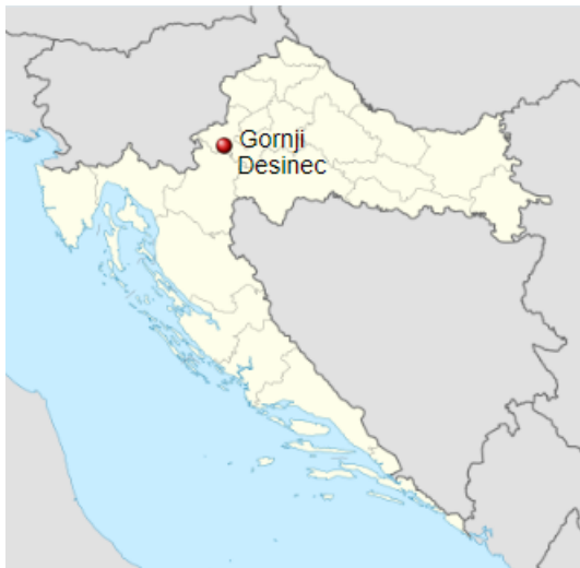
Lokacija Gornjeg Desinca (Wikipedia, URL 5)