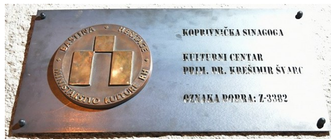
Slika 11. Spomen-ploča (Marko Posavec, 2019.)