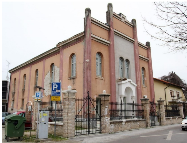
Slika 10. Sinagoga danas