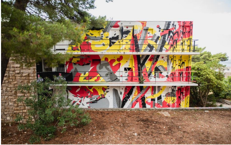
Prilog 14. Druga strana vanjskog zida istočnog paviljona. Izgled nakon završetka ovogodišnjeg festivala.

Na fotografiji iz 2011. može se primijetiti loše stanje vrata od kojih su neka i razbijena, kao i hrđa na pojedinim mjestima. Na novijoj fotografiji vizualno se ponovno gube stara obilježja paviljona, vrata i prozori vide se samo izbliza, a umjetnički motiv murala s jedne strane zida nastavlja se i na drugoj te se vide i pojedina sponzorska obilježja festivala koja su tu samo za trajanja festivala. Boje su kod drugog murala slične kao i kod prvog. Iako su dva dijela paviljona odnosno dva murala odvojena kamenim zidom osjećaj kontinuiteta između dva umjetnička djela svejedno je prisutan.