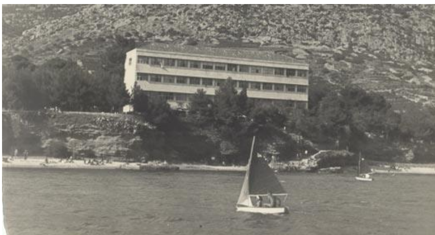
Prilog 3. Stara fotografija Bijele kuće. Datum nepoznat.

gimnazije, pogotovo zbog sve većeg broja učenika koji su u Bol dolazili i iz područja izvan Brača i Dalmacije. Gradnja nove školske zgrade počinje 1934., a završava 1936. godine.