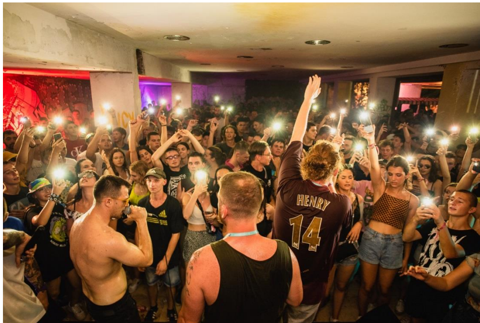
Prilog 8. Položaj izvođača u odnosu na publiku tijekom jednog od glazbenih nastupa. Tri muške osobe pri dnu slike spadaju među izvođače, dok ostatak pripada publici.

jedna gotovo uniformirna masa ljudi bez neke separacije po akterima. Bijela kuća kao prostor i festival zajedno s njom utječu i na način na koji festivalska publika i izvođači uzajamno djeluju unutar prostora, što je vidljivo i u Prilog 8. Položaj izvođača u odnosu na publiku tijekom jednog od glazbenih nastupa. Tri muške osobe pri dnu slike spadaju među izvođače, dok ostatak pripada publici. Izvođači i publika nalaze se u neposrednoj blizini i nastup izvode unisono, tvoreći jedinstvenu ljudsku masu koja za izvedbu zajednički koristi isti prostor.