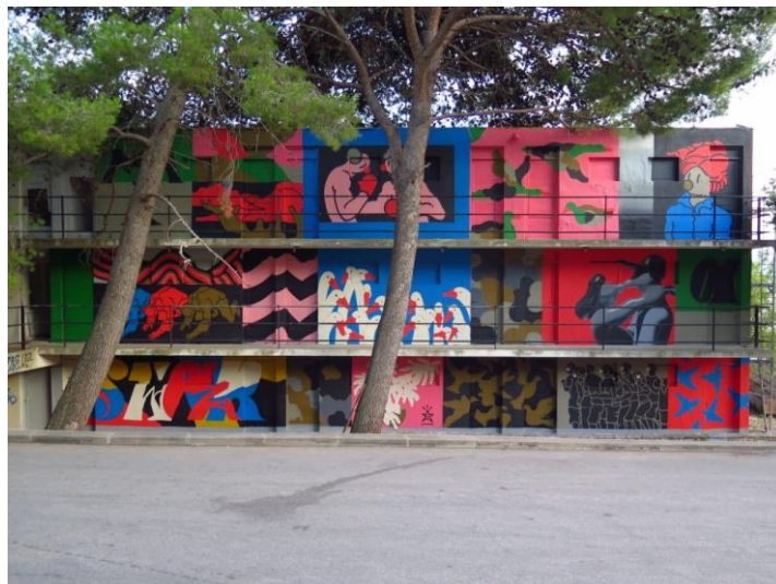
Prilog 16. Mural na vanjskom zidu najzapadnijeg od tri paviljona okrenut prema cesti koja vodi do Bijele kuće, nakon završetka ovogodišnjeg festivala.

Svi paviljonski zidovi prikazani na prethodnim fotografijama se u pravilu iznova prebojaju svake godine. Graffiteri prije početka festivala prvo okreće zid gdje se nalazio stari mural te zatim počnu s radom na novom muralu. Isti proces se onda ponovi sljedeće godine. Organizator mi je rekao da je to programska „strategija kako ne bi došlo do neke monotonije“ i da „to njima [graffiterima] nije problem jer sami žele svakog lita probat nešto novo“. Festival putem njih svoj trag trajno ostavi na prostoru, jer jedan mural samo zamijeni drugi. Taj proces traje već pet godina, otkad se festival služi prostorom Bijele kuće. Velika razlika između izgleda paviljona prije dolaska festivala na prostor i njihovog izgleda danas rezultat je utjecaja festivala i njegovih izvođača. Organizatori su prostor zatekli u stanju u kojem se i