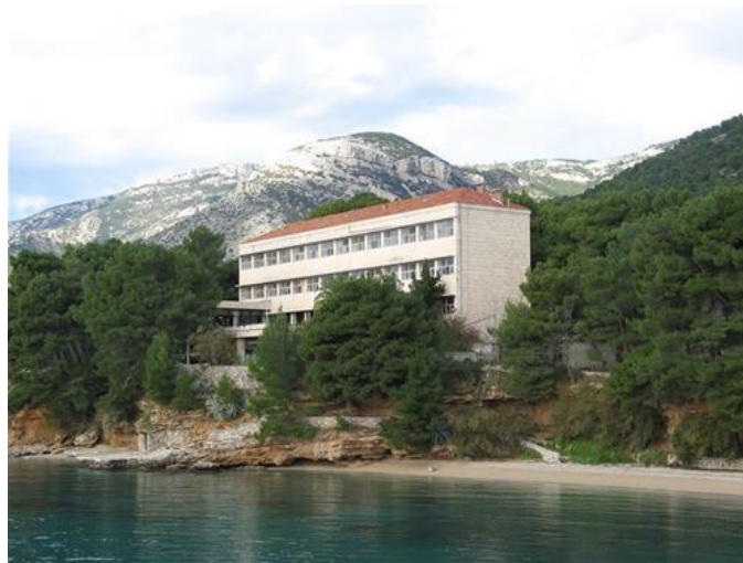
Prilog 7. Današnji vanjski izgled Bijele kuće, pogled s mora.