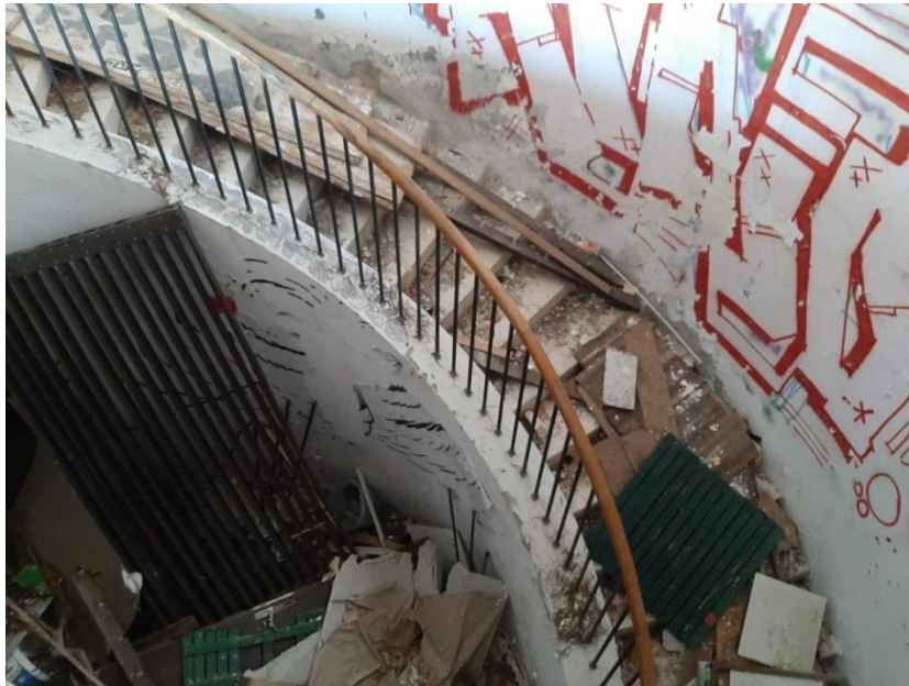
Prilog 6. Današnji izgled unutrašnjosti Bijele kuće. Izvor: