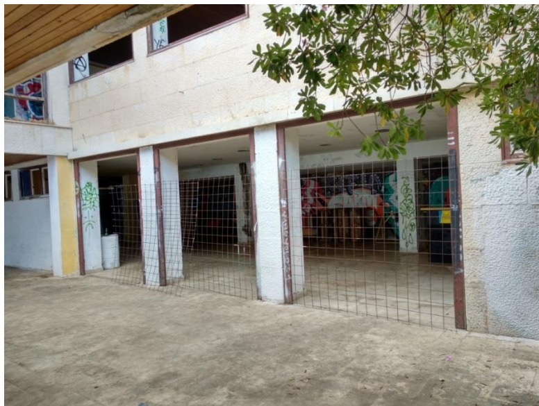
Prilog 10. Prostor unutar Bijele kuće gdje se nalazila pozornica, koji su organizatori nakon završetka ovogodišnjeg festivala ogradili ogradom.

Nakon službenog završetka festivala organizatorima i volonterima još ne predstoji vrijeme za upijanje dojmova, već prije svega rad koji ponovno karakterizira njihovo korištenje prostora. Zatvara se krug između društvene proizvodnje koja prethodi otvaranju festivala i one koja na red dođe kad se festival zatvara. Budući da je program gotov, sva oprema i sadržaji se trajno premještaju, i gotovo odmah nakon završetka glazbenog programa počinje se s čišćenjem Bijele kuće, koje s prekidima traje i tjedan dana nakon završetka festivala. Nakon zadnjeg nastupa gasi se razglas i poslije glazbe čuje se isključivo razgovor posjetitelja. Nagla promjena u decibelima stvara zanimljiv doživljaj. Koliko god brzo se prostor znao napuniti prije nekog nastupa, toliko brzo se sad isprazni. Sa svakom minutom odnos festivala i prostora sve više blijedi jer nedostatak publike to najviše dočarava. Iako festival više ne nudi program ili prodaju pića, u trenucima nakon završetka festivala i dalje mnogobrojni posjetitelji uglavnom se premještaju na plažu ispod Bijele kuće ili u lokacije u kojima su smješteni. Pogotovo plaža ispod Bijele kuće kao prostor koji ne ovisi toliko o programu kao Bijela kuća nudi mogućnost za nastavljanje festivalskih praksi za publiku i nakon službenog završetka festivalskog programa.