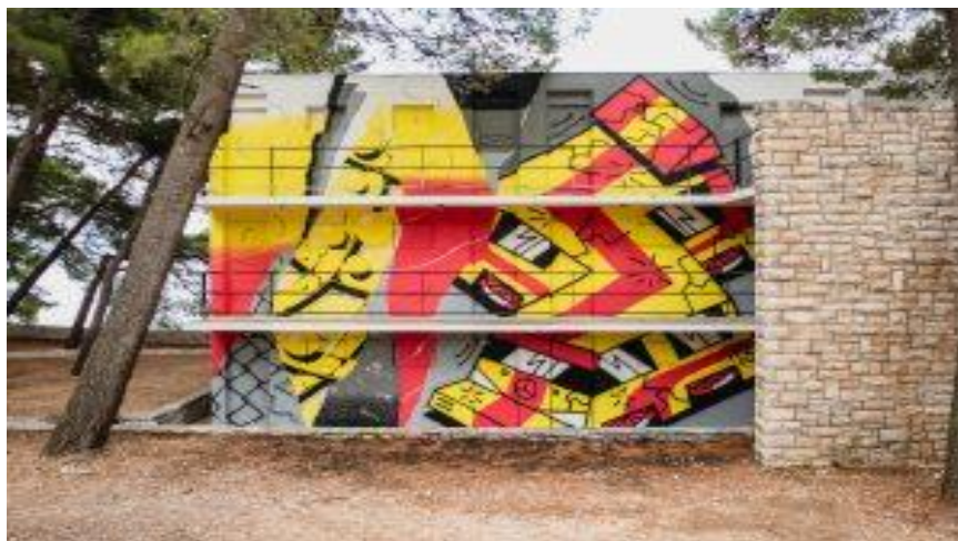
Prilog 12. Mural na zidu istočnog paviljona. Izgled nakon završetka ovogodišnjeg festivala.

Prostor je promijenjen do te mjere da se vrata i prozori više ne prepoznaju. Arhitektonski je to i dalje isti prostor, no on estetski i dekoracijski šalje dvije potpuno različite poruke i kod