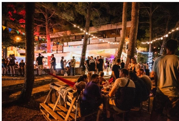
Prilog 19. Festivalski prostor uz glavnu zgradu Bijele kuće tijekom prvog festivalnog dana/večeri, 26. srpnja 2019.