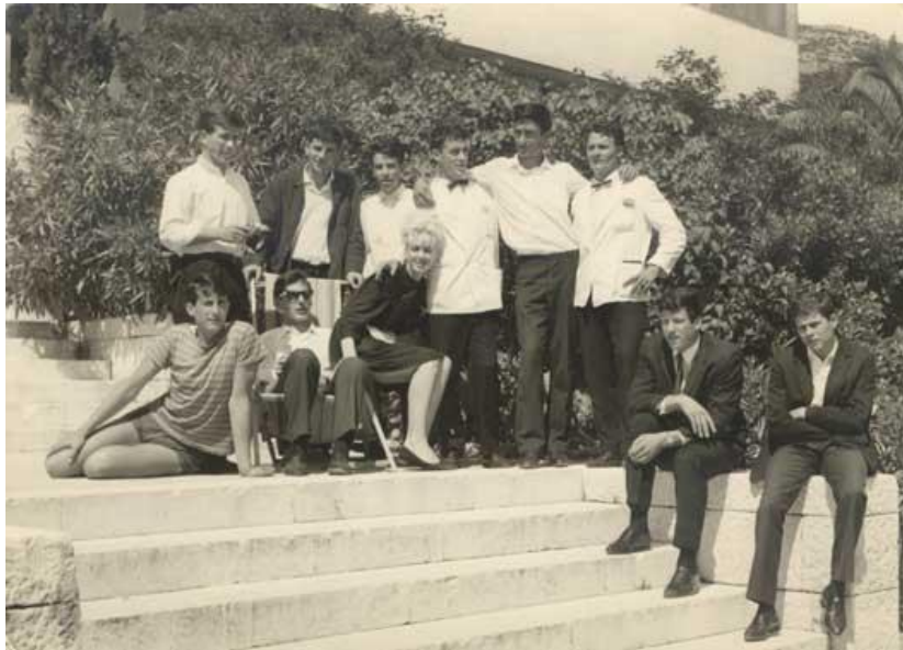
Prilog 5. Osoblje hotela „Bijela kuća“ 1964. godine.

rat. Tijekom 1967., 1968. i 1969. izgrađene su sjeverno od „Bijele kuće“ i dvije nove dependanse: „Martinica“ i „Tamaris“ 22 .