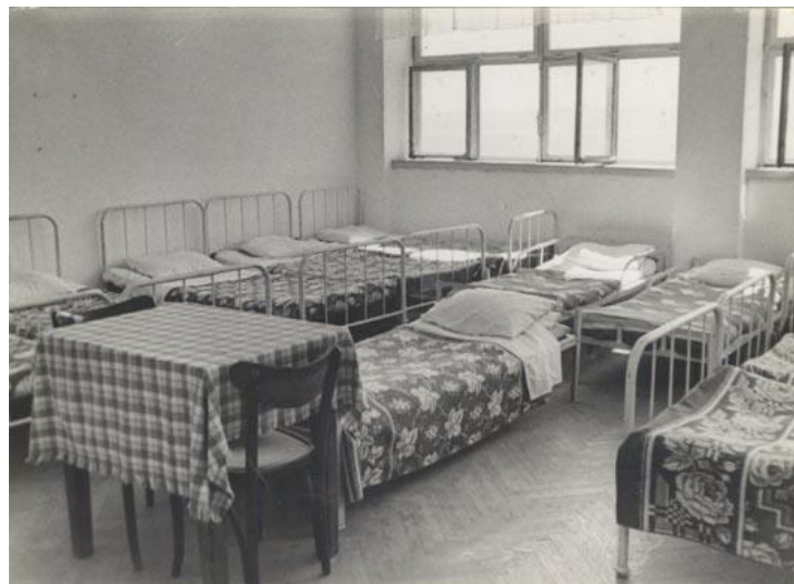
Prilog 4. Spavaonica Đačkog doma u kojoj su ljeti tijekom 1960-ih godina boravili studenti iz Francuske.