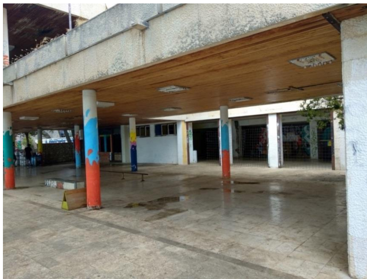
Prilog 23. Glavni plato Bijele kuće nakon završetka festivala.

https://www.facebook.com/GraffitiNaGradele/photos/a.2401473819968023/2401474436634628 (pristup 24. 10. 2019.)