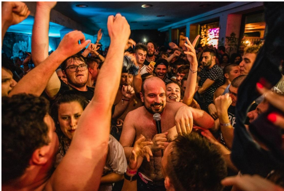
Prilog 9. Izvođač (u sredini slike) i publika tijekom jednog od nastupa zadnjeg festivalskog dana.

Zaključujem da se pridržavanjem određenih satnica tijekom godina (iako su satnice često uključivale i kašnjenja) stvorila određena navika korištenja prostora kod publike. Posjetitelji imaju iskustvo festivalskog pridržavanja satnica te shodno tome planiraju i organiziraju vlastito vrijeme. Prostor i njegova popunjenost i publika i njene navike kreiraju odnos koji se međusobno uvjetuje.