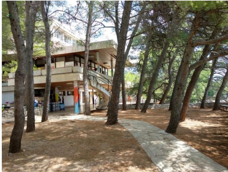
Prilog 18. Prostor uz glavnu zgradu Bijele kuće dan nakon završetka festivala. 29. 7. 2019.

sam prostor Bijele kuće odaje dojam novostvorene funkcionalnosti. Osim prve očite razlike koja se odnosi na broj ljudi u prostoru, primjetna je i razlika u dekoracijama i osvjetljenju koji su obilježje festivala.