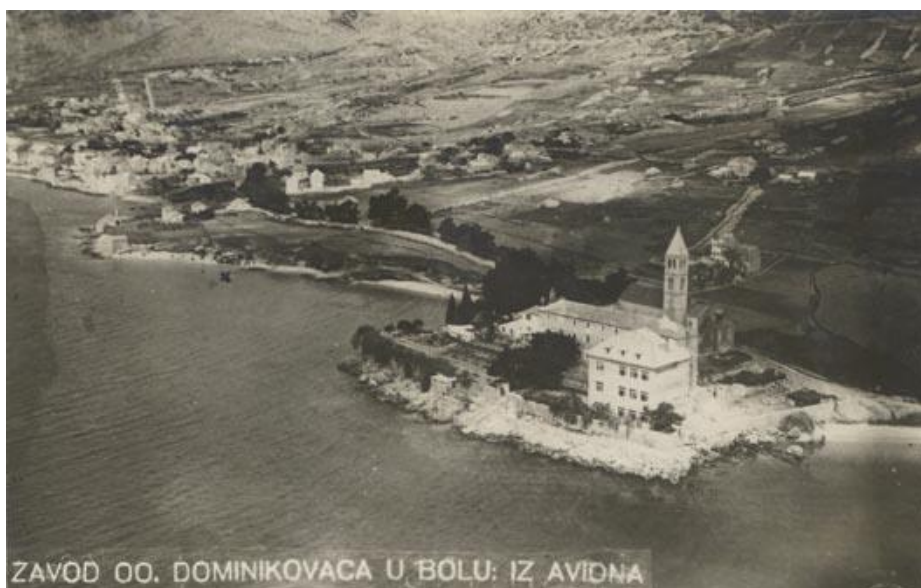
Prilog 2. Dominikanski samostan i crkva u Bolu. Budući prostor Bijele kuće nalazi se na lijevoj strani fotografije. Godina fotografije nepoznata.