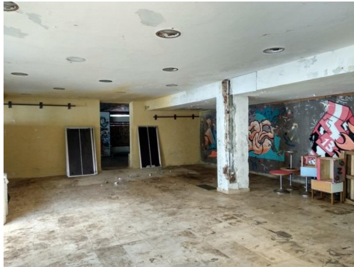
Prilog 20. Unutrašnji prostor Bijele kuće gdje se odvijaju nastupi fotografiran jedan dan nakon završetka festivala.

grupa. Osim što je teza o „festivalu bez pozornice“ ponovno vidljiva, budući da se izvođač (u žutim hlačama po sredini fotografije) nalazi između publike, prostor je ispunjen mnogobrojnim posjetiteljima i fanovima, što pojačava kontrast u odnosu na Prilog 20. Tu sam fotografiju snimio 29. srpnja, jedan dan nakon završetka festivala. Vidi se pozornica koja je rastavljena i čeka odvoz. Isto tako je s prolaza koji je vodio u backstage prostor maknuta GNG zastava koja je služila kao zastor. Stolovi u desnom kutu fotografije izneseni su iz backstagea . Na stropu prostorije vidljiv je manjak rasvjete, a na stupu oštećena žbuka i instalacije koje se nalaze uz njega. Ti detalji u masi posjetitelja nisu vidljivi niti se na njih obraća pažnja, no kad se prostor isprazni, pogled automatski seže prema tim segmentima prostora. Vidljivi su i graffiti kojih inače nema mnogo u unutarnjem prostoru Bijele kuće, barem ne onih naslikanih za vrijeme festivala.