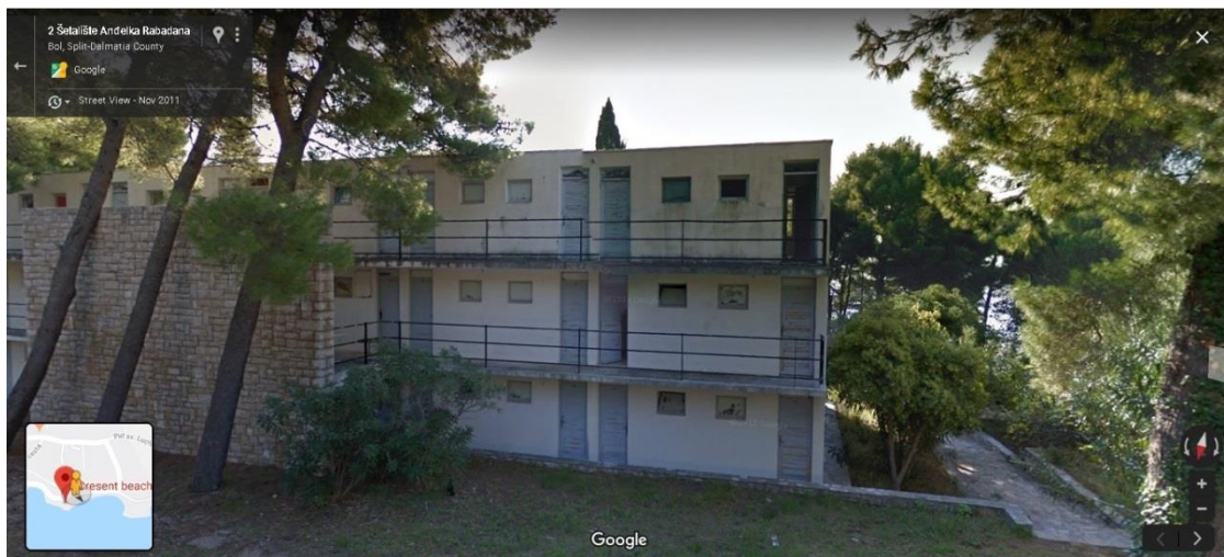
Prilog 13. Druga strana vanjskog zida istočnog paviljona. Stanje iz studenog 2011. godine.

Sljedeće dvije fotografije prikazuju drugi dio istog zida paviljona koji odvaja samostojeći kameni zid koji se nalazi ispred paviljona 2011. godine i nakon završetka ovogodišnjeg izdanja festivala.