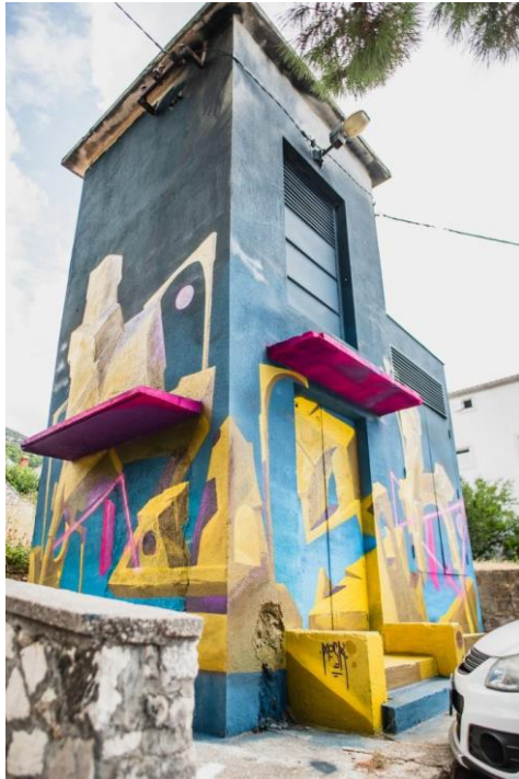
Prilog 25. Trafostanica u blizini Bijele kuće oslikana od strane jednog od izvođača.