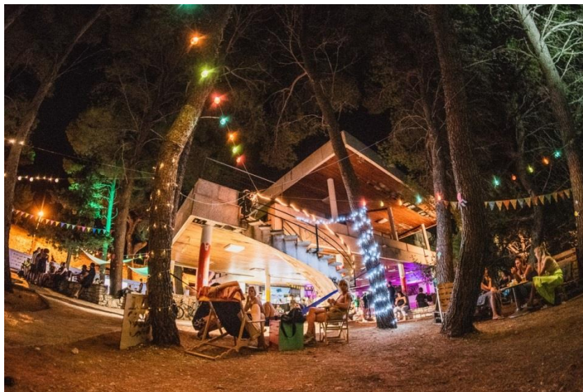
Prilog 17. Glavni festivalski prostor za vrijeme „nultog“ dana. Izvor:

za vrijeme „nultog“ dana. Izvor: https://www.facebook.com/GraffitiNaGradele/photos/a.2394552563993482/2394557990659606 (pristup 24. 10. 2019.). Nultog festivalskog dana prostor Bijele kuće već je očišćen i dekoriran odnosno spreman za festivalski program i publiku.