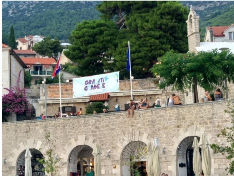
Prilog 24. Festivalski banner vidljiv iz bolske luke.

Nastavljajući šetnju šetnicom uz more prema zapadnoj strani Bola, u smjeru autobusne stanice, turističkih brodova i vlakića i plaže Zlatni rat, uočio sam drugi promotivni materijal festivala. Radilo se o plakatu unutar samostojećeg okvira. Za razliku od prije navedenog bannera , na ovom posteru nalazi se puni popis glazbenih izvođača i graffitera, zajedno s datumima tijekom kojih se festival održava i popisom sponzora i partnera festivala. Ovaj plakat je i preko dva tjedna nakon završetka festivala i dalje bio postavljen na istoj lokaciji te je organizator smatrao da se plakat neće micati minimalno do neke sljedeće manifestacije.