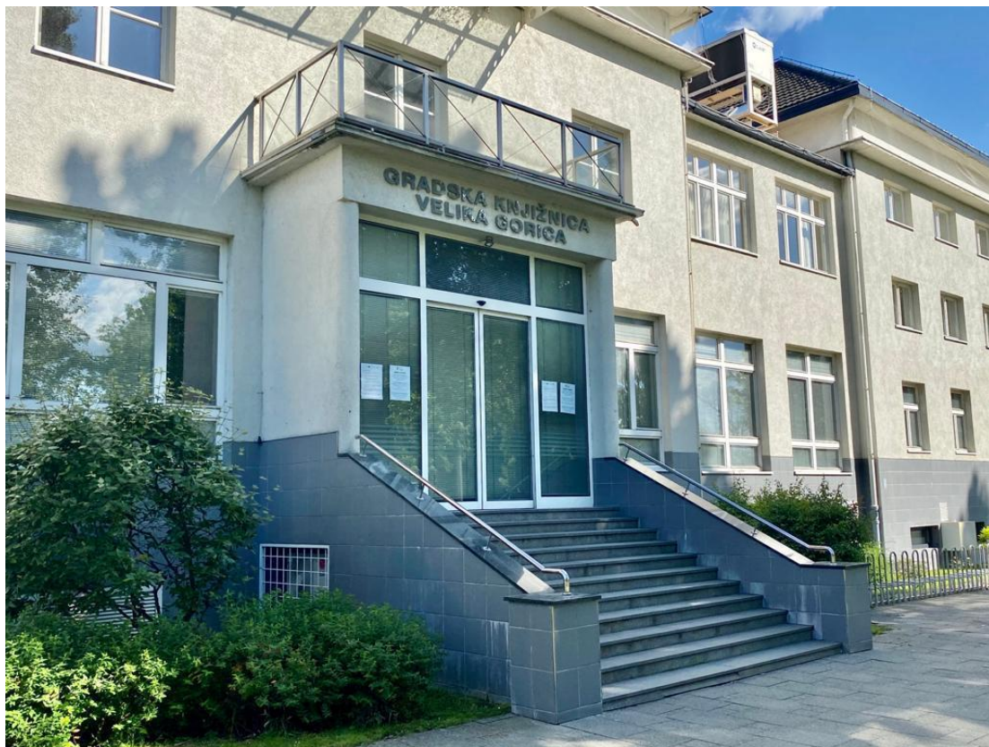
Slika 2: Središnji odjel za odrasle Gradske knjižnice Velika Gorica koji je nositelj svih događanja u službi promicanja čitanja

U Središnjem odjelu za odrasle organiziraju se razna događanja: književni susreti i predavljanja knjiga, znanstvene tribine, obilježavanje raznih obljetnica, izložbe, sastanci književnih klubova i manifestacije sa ciljem informiranja korisnika, poticanja na kvalitetno druženje s knjigom i promicanja čitanja, stoga je Središnji odjel za odrasle rasadnik informacija za svoje korisnike i centar promicanja čitanja.