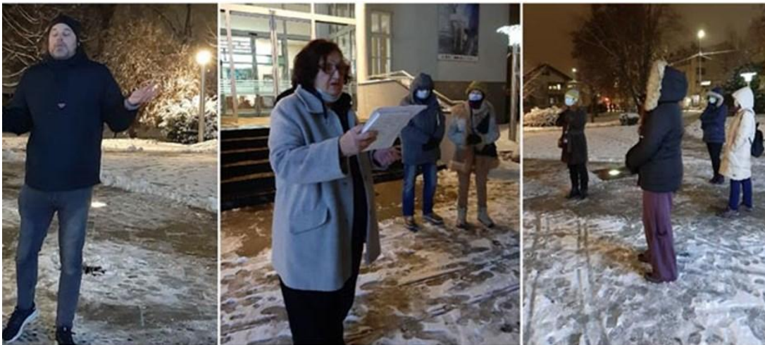
Slika 9: 50 poems for snow ispred GKVG 3.12.2020.