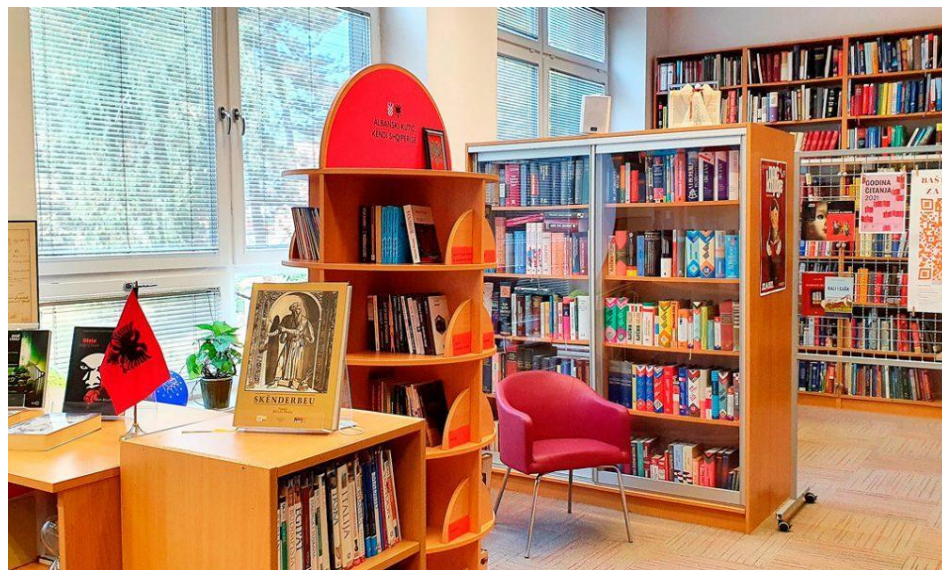
Slika 12: Albanski kutić u Gradskoj knjižnici Velika Gorica, otvoren 2021. godine