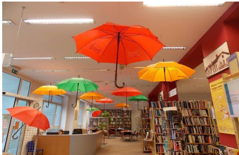
Slika 7: Prigodno ukrašena Središnji odjel knjižnice povodom MHK 2016.

Mjesec hrvatske knjige velika je manifestacija tijekom koje se u knjižnicama diljem cijele Hrvatske posvećuje posebna pažnja knjizi i čitanju, a održava se u drugoj polovici godine, od 15. listopada do 15. studenog. „Knjižnice grada Zagreba, na zamolbu Ministarstva kulture Republike Hrvatske, u svibnju 1995. godine preuzimaju organizaciju manifestacije Mjesec hrvatske knjige.“ 30 Kroz raznolike programe knjižnica se trudi lokalno uključiti i svoje korisnike i ostale građane. Cilj ove državne manifestacije je istaknuti iznimnu važnost knjige, ali i knjižnica kao mjesta javnog i slobodnog pristupa koja se sve više približavaju građanima. 31 Gradska knjižnica Velika Gorica tijekom Mjeseca hrvatske knjige intenzivno radi na promicanju i poticanju na čitanje u obliku različitih književnih susreta, tribina, predavanja i izložbi. „Mjesec hrvatske knjige također je razdoblje u kojem smo intenzivnije prisutni u medijima i kada se češće obraćamo našim korisnicima i ostalim sugrađanima kako bi oni upoznali svoju knjižnicu ne samo kao mjesto posudbe knjiga, nego i kao mjesto zanimljivih susreta, kao mjesto na kojemu mogu učiti i stjecati nove spoznaje, upoznati zanimljive domaće autore i doći do različitih korisnih informacija.“ 32 Mjesec hrvatske knjige prilika je i da se obilježe važne obljetnice rođenja i smrti naših velikana hrvatske, ali i svjetske književnosti.