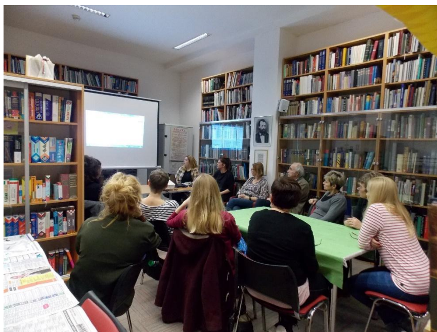
Slika 4: Četrni četrtak, 2020. godina