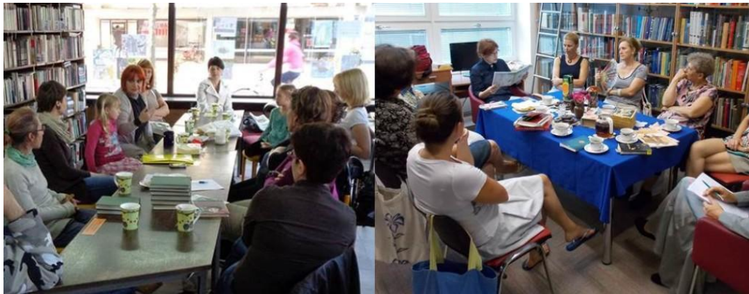
Slika 11: Susret čitateljskog kluba „Književni sladokusci“

a ocjene su se znale i značajno promijeniti, ponekad na višu, a ponekad i na nižu ocjenu. Prilikom svakog susreta knjižničarke i pojedine članice bi donijele čaj, kavu, kolačiće i kekse kako bi im druženje bilo što ugodnije. Osim toga, za članice čitateljskog kluba organizirano je nekoliko kraćih izleta i susreta s čitateljskim klubovima iz drugih knjižnica, kako bi se razmijenila iskustva i potaknulo moguće buduće članove na čitanje i suradnju jer su takvi susreti bili odlično medijski popraćeni.