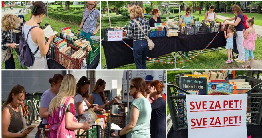
Slika 6: Akcija „Sve za pet“ 2021. godine

i pisane riječi čemu svjedoči sve veća potražnja za knjigama koje se sakupljaju tijekom cijele godine, a rasprodaju već u prva tri dana akcije. Radi se o domaćim i stranim naslovima, stručnim knjigama i slikovnicama koji privlače čitatelje koji nerijetko upravo na Proljetnom sajmu kupe dugo traženu knjigu ili pak popune svoj privatni knjižni fond. Najtraženije su osnovnoškolske i srednjoškolske lektire i hit naslovi koji se najbrže prodaju.