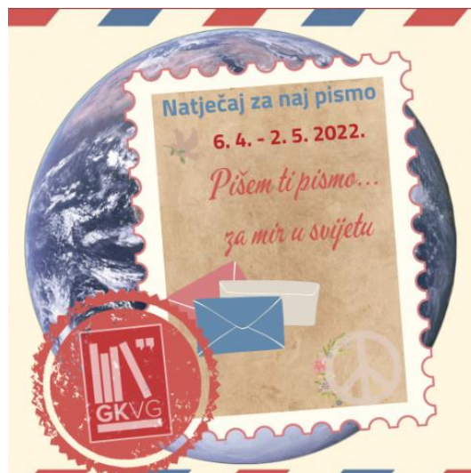
Slika 10: Plakat za natječaj „Pišem ti pismo“ iz 2022. godine (preuzeto sa www.knjiznica-vg.hr )

natječaju sudjeluju građani svih dobnih skupina, iz različitih krajeva hrvatske, pišući na svom dijalektu ili standardnim književnim jezikom, šaljući pisma pisana rukom i naliveperom koja bude nostalgiju na neke davne dane ili pak šalju svoja pisma e-mail-om, tzv. elektronskom poštom . Ova akcija i njeni rezultati pokazatelj su koliko je važna pismenost i koliko je važno pismeno izražavanje, posebice u današnjim sve užurbanijim vremenima kada vještina pisanja sve više pada u drugi plan zbog digitalnog doba i prisustva drugih medija i načina izražavanja.