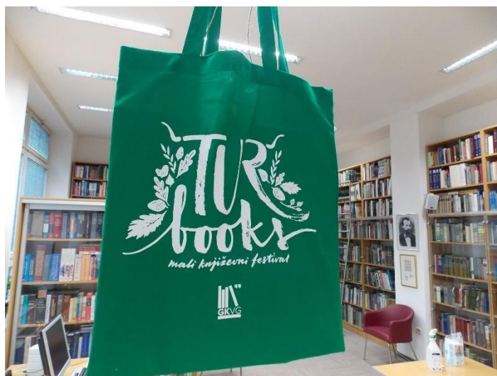
Slika 8: Platnene vrećice kao promotivni materijali Turbooksa (autorica Marija Cvetnić Hubak)

Tri književne matinee održavaju se na Dječjem odjelu knjižnice u suradnji s vrtićima i osnovnim školama velikogoričkog područja. Prvašićima je omogućen besplatan upis u knjižnicu, a učenici dobivaju Čitatovnicu – čitalačku putovnicu u koju će pri svakoj posudbi knjiga dobiti žig, a kada sakupe sve žigove, dobivaju pohvalnicu. 34 Uz to, svake se godine održavaju prigodne radionice u kojima učenici dobivaju priliku za razvijanje vlastitih vještina čitanja i pisanja, kao što je projekt „Kako napisati priču“ koji se održavao pod vodstvom Brune Mezića. Prošle je godine vrtićance i školarce na Dječjem odjelu posjetio Zoran Vakula i predstavio im svoje Vremenaste priče na opće oduševljenje. Plod suradnje sa velikogoričkim vrtićima i školama jesu i razne izložbe. Radovi prigodne ili zadane tematike vrtićanaca i učenika krasi Dječji odjel knjižnice i područnu knjižnicu Galženica tijekom Turbooksa i cijelog Mjeseca hrvatske knjige.