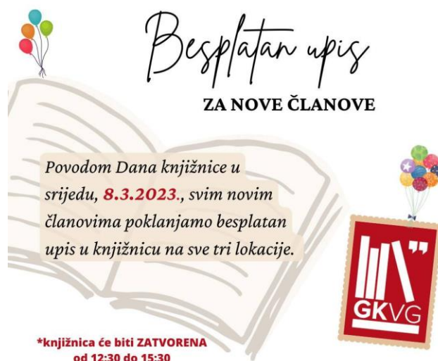
Slika 5: Plakat s pozivom na besplatan upis povodom Dana knjižnice 2023. godine (preuzeto sa www.knjiznica-vg.hr )

Besplatan upis omogućen je i učenicima prvih razreda tijekom Mjeseca hrvatske knjige, povodom Dječjeg tjedna, te pobjednicima u natjecajima u organizaciji knjižnice i slično.