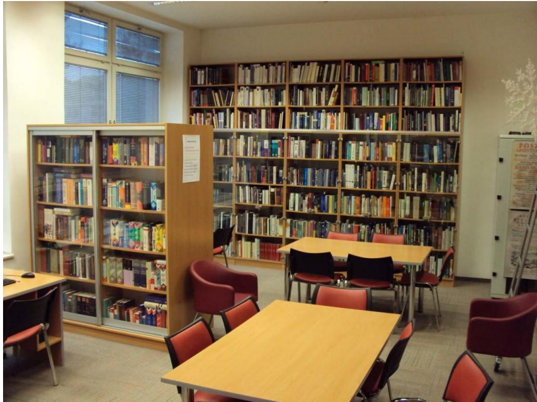
Slika 13: Mjesta za rad na Središnjem odjelu za odrasle

nego upravo suprotno; nadopunjuju se na način da korištenje jednih potiče korištenje drugih, stoga je svaka narodna knjižnica mjesto za pristup kako tiskanoj, tako i elektronskoj građi.