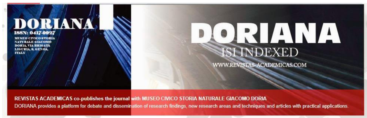
Slika 6. Dio početne stranice lažnog časopisa Doriana na kojoj su i podaci o pravom časopisu 57

Slika 6. prikazuje primjer otetog časopisa (engl. hijacked journal ). Naslov pravog časopisa je Doriana i izdaje ga Museo Civico di Storia Naturale Giacomo Doria u Genovi, u Italiji. Izdavač koji je oteo časopis, iskoristio je činjenicu da ugledni pravi časopis nije imao mrežnu stranicu. Na svojim stranicama koristi naziv uglednog časopisa i njegovu oznaku ISSN-a kako bi zavarao čitatelje i potencijalne autore i ostvario financijsku korist od objavljivanja radova. Pravi časopis pokriva područje prirodnih znanosti, a lažni časopis pokriva sva znanstvena područja 58 . U časopisu je objavljen samo jedan rad – u ožujku 2018. godine dostupan je samo rad objavljen u najnovijem broju iz 2014. godine.