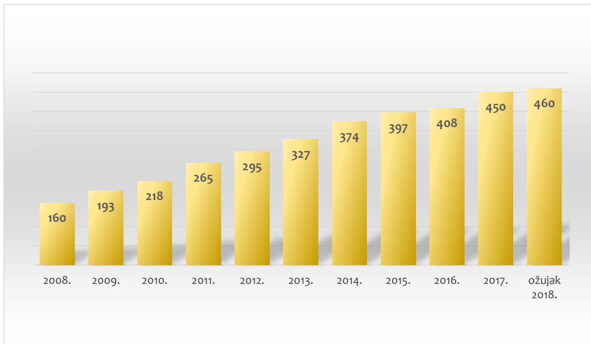
Grafikon 1. Porast broja hrvatskih znanstvenih časopisa na portalu Hrčak od 2006. do ožujka 2018. godine

Hrvatski znanstveni časopisi uglavnom su dostupni putem portala Hrčak i provjerene su kvalitete. Hrčak je portal (zapravo repozitorij) hrvatskih znanstvenih časopisa i omogućava pristup sve većem broju hrvatskih časopisa. 41