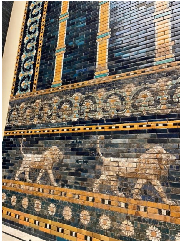
Slika 2. Rekonstrukcija Procesijskog puta s motivima lavova, prikazano u Pergamskom muzeju (autorski rad, slikano 22.02.2023.g. u Pergamskom muzeju)