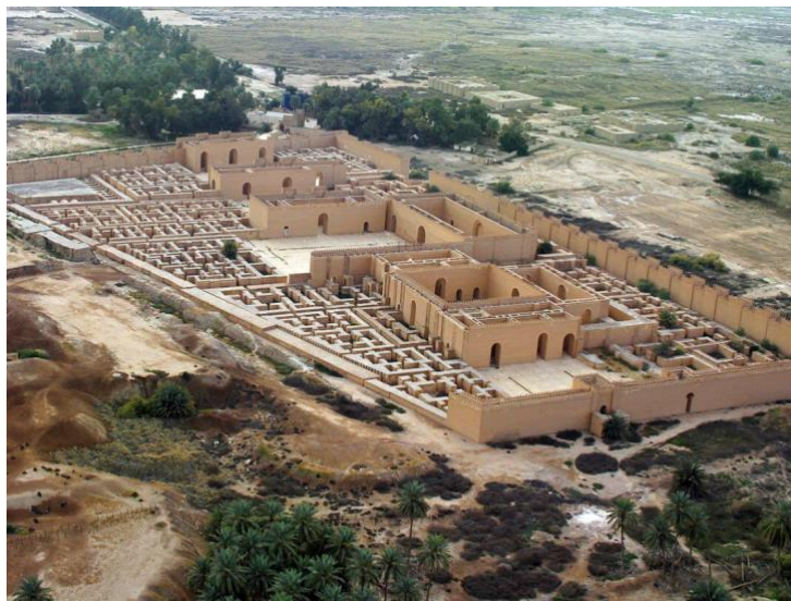
Slika 3. Pogled iz zraka na rekonstruiranu palaču Nabukodonozora II., izgrađenu 1987. godine u Babilonu

Stanje u samome Iraku se poboljšava te je razumljivo da s njihove strane traže povrat baštine za koju možda ne bi nikada dali odobrenje početkom 20. stoljeća. Za njih Ištarine dveri i ostali predmeti imaju povijesno i društveno značenje jer se oni mogu više s njima identificirati, nego recimo Europljani. Stoga im je zasigurno bolno kada ne mogu posjedovati svoju baštinu i prezentirati onako kako smatraju najprikladnijim. Budući da je vlada Osmanskog Carstva davne 1903. godine odobrila napuštanje sanduka s fragmentima opeke iz Babilona, danas ovaj povijesni događaj otežava proces traženja povrata baštine za Iračane. Zbog toga Iračani neće vidjeti dugoočekivani povrat Ištarih dveri i ostatak predmeta.