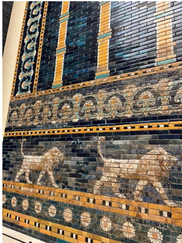
Slika 2. Rekonstrukcija Procesijskog puta s motivima lavova, prikazano u Pergamskom muzeju (autorski rad, slikano 22.02.2023.g. u Pergamskom muzeju)