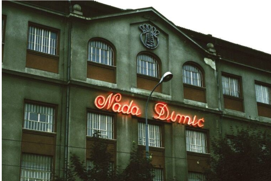
Slika 9. Tvornica Nada Dimić s umjetničkom intervencijom Sanje Iveković („Sanja Iveković: Nada Dimić File 2023 / Nada Dimić – Rekonstrukcija Industrijskog Nasljeđa, Izložba - SVIJET KULTURE,” 2023)