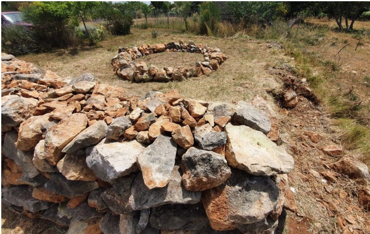
Slika 14. Josip Zanki, land art instalacija ("Land Art Instalacije Suhozida Na Pagu," 2021)