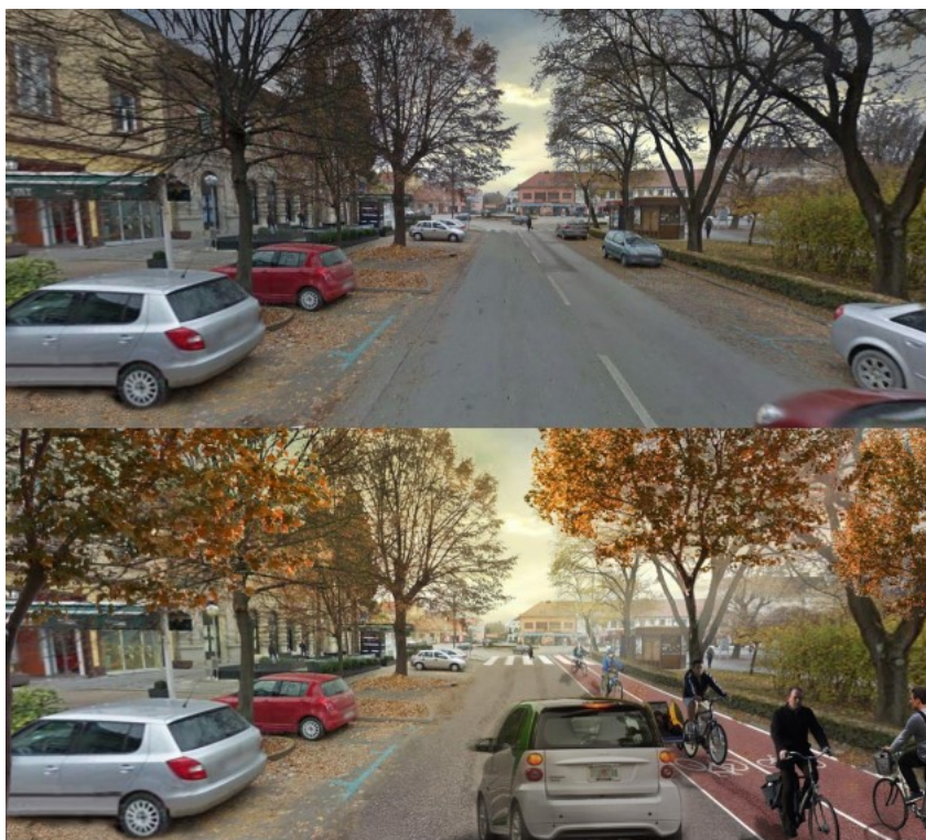
Slika 5. Primjer prije/poslije rješenja za Nemčićevu ulicu

Nadodaju kako pametni gradovi mogu unaprijediti kvalitetu života zbog uštede vremena u birokratskim poslovima, ali da je prije svega važno staviti naglasak na komunikaciju s građanima i participativno planiranje.