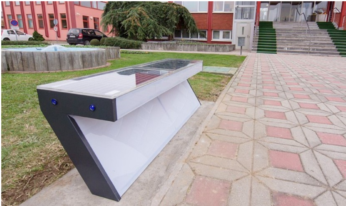
Slika 6. Primjer pametne klupice u Koprivnici

Što se tiče pametnih rješenja na području mobilnosti sugovornici su poprilično izražavali nezadovoljstvo. Još na pitanje zadovoljstva kvalitetom života mogli smo utvrditi kako im ne odgovara što Koprivnica nije adekvatno povezana glavnim gradom te što državna cesta, naglašavaju, prolazi kroz sami centar grada. Pojedini smatraju da okolica grada nije dovoljno povezana sa središtem grada što prema njihovom mišljenju izaziva probleme kod starijeg stanovništva. Prisutna je varijabilnost između zadovoljstva biciklističkim stazama. Dio sugovornika na temu pametnih rješenja posebno izdvaja biciklističke staze uz pozitivan naglasak, dok dio ih izražava nezadovoljstvo zbog njihove tehničke izvedbe i rasprostranjenosti. Što se tiče pametnih rješenja BicKo i BusKo smatraju da im se sviđa sama ideja jer bi mogla koristiti stanovnicima, ali da se po njihovom iskustvu i mišljenju ljudi skoro ni ne koriste time. Dio ih ističe da je uzrok tome manjak informiranosti, a dio ih ističe manjak dostupnih dnevnih linija. Na pitanje koliko su zadovoljni s prometom u Koprivnici ističu prije svega kako imaju premalo semafora na križanjima te da to zna izazvati velike gužve.