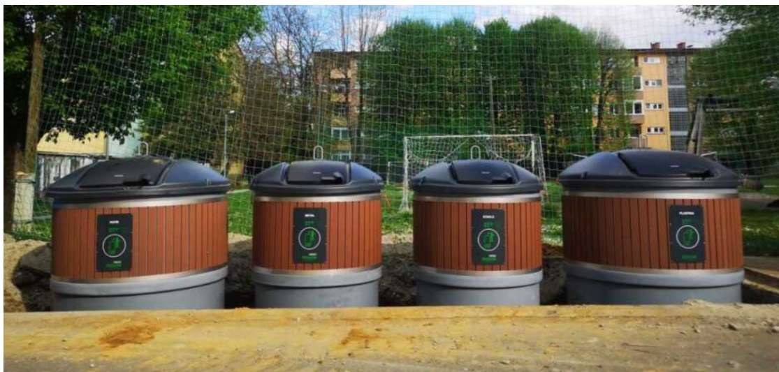
Slika 2. Polupodzemni kontejneri za odvajanje otpada na području Koprivnice

“(...) tipa jedno od pametnih rješenja je odvoz smeća i ako to idem uspoređivat sa Zagrebom kod nas je to bolje organizirano, puno je jednostavnije.”