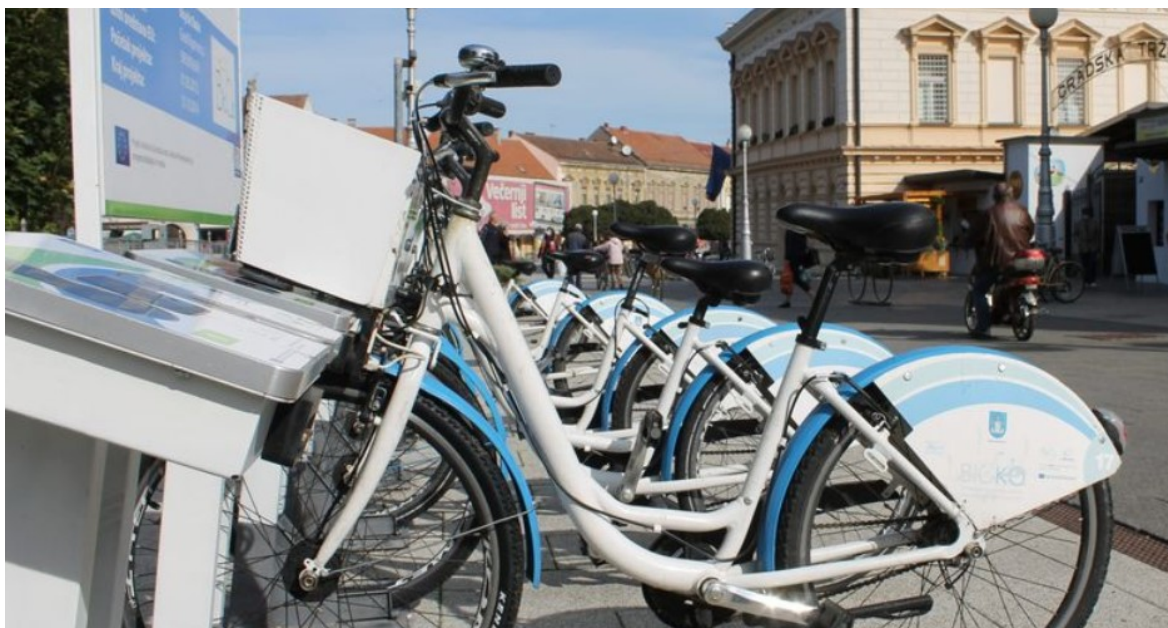
Slika 4. Sustav javnog servisa za prijevoz biciklima BicKo, preuzeo s: https://koprivnica.hr/novosti/bicko-sustav-krece-u-novu-sezonu-5/

Kao što smo već spomenuli, važna stavka unaprjeđenja pametne mobilnosti prema stručnjacima je povezivanje centra grada s okolnim područjima.