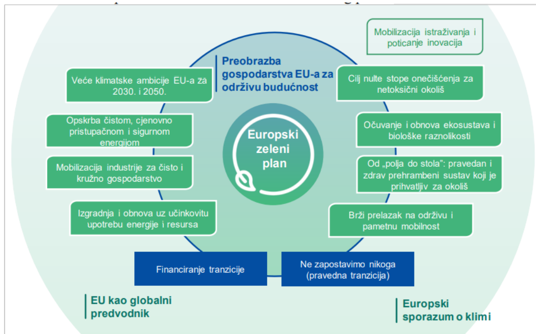
Slika 1. Elementi Europskog zelenog plana, preuzeto s: https://eur-lex.europa.eu/legal-content/HR/TXT/HTML/?uri=CELEX%3A52019DC0640&from=EN

Kada analiziramo dokumente Europske komisije, nacionalne i lokalne strategije, svima je zajedničko da sadržavaju mjere za ostvarivanje zelenih i održivih ciljeva. Preduvjet za takav pristup je odmak od dosadašnjeg načina iskorištavanja resursa te oslanjanje na inovativne tehnologije. Još 2020. Europska komisija objavljuje Europski zeleni plan kojem je jedan od glavnih ciljeva smanjiti neto emisije stakleničkih plinova za barem 50% do 2023. i postati neutralna sve do 2050.