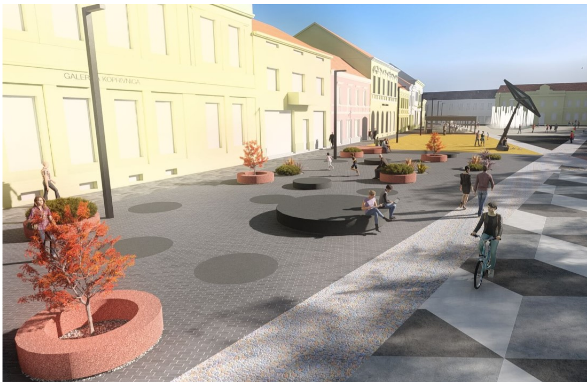
Slika 3. Projekt uređenja središnjeg trga Koprivnice