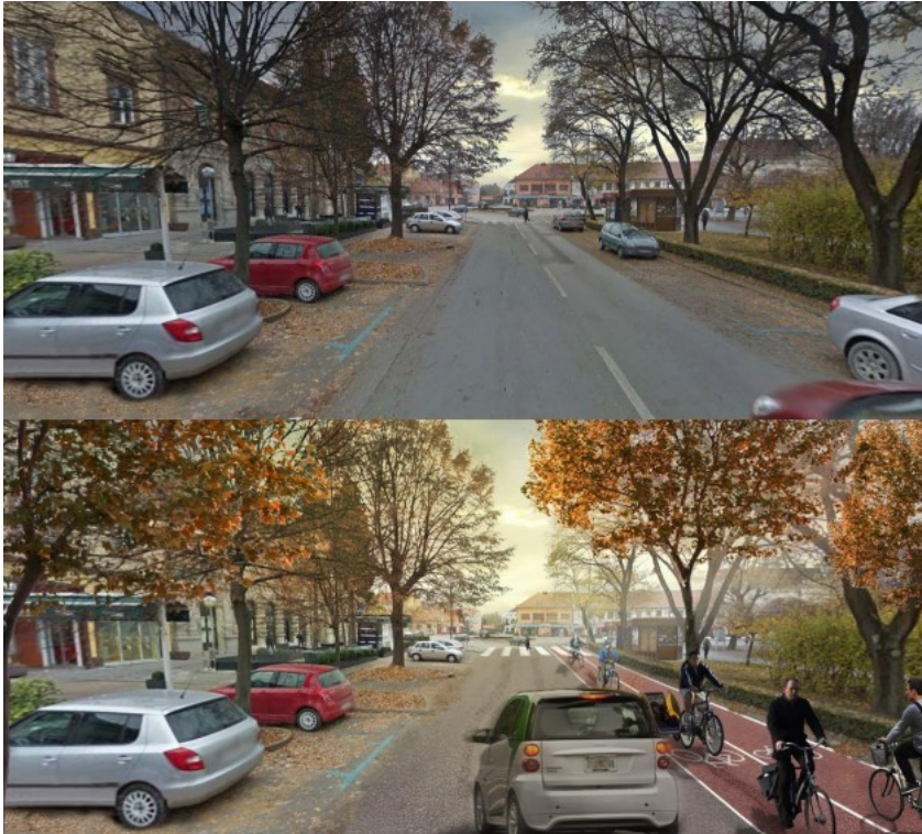
Slika 5. Primjer prije/poslije rješenja za Nemčićevu ulicu

Nadodaju kako pametni gradovi mogu unaprijediti kvalitetu života zbog uštede vremena u birokratskim poslovima, ali da je prije svega važno staviti naglasak na komunikaciju s građanima i participativno planiranje.