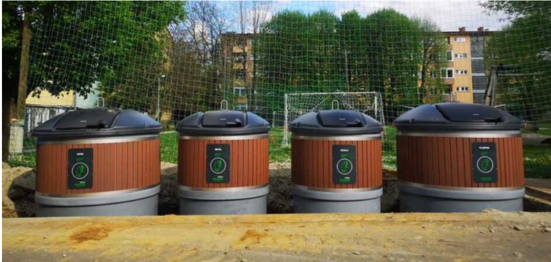
Slika 2. Polupodzemni kontejneri za odvajanje otpada na području Koprivnice, preuzeto s: https://shorturl.at/dgBN4

“(...) tipa jedno od pametnih rješenja je odvoz smeća i ako to idem uspoređivat sa Zagrebom kod nas je to bolje organizirano, puno je jednostavnije.”