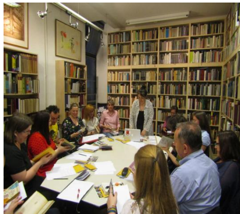
Slike 1.i 2. Radionica kreativnog pisanja „Piči!” - čitaj i piši ” u Gradskoj knjižnici Vladimira Nazora u Zagrebu

Nadalje, primjer projekta koji je proveden 2018. godine je „Vrata nepoznatog”, koji je organizirala Čitaonica i knjižnica grada Daruvara. Ovaj projekt je bio dio međunarodnog projekta "Biti pisac" koji se paralelno provodio u Češkoj, Slovačkoj, Poljskoj i Hrvatskoj, a Čitaonica i knjižnica grada Daruvara bila je jedina knjižnica koja je sudjelovala u ovom projektu. Na kraju svake radionice, šest najboljih radova odabranih na radionici uvršteno je u međunarodne književne zbirke. 32