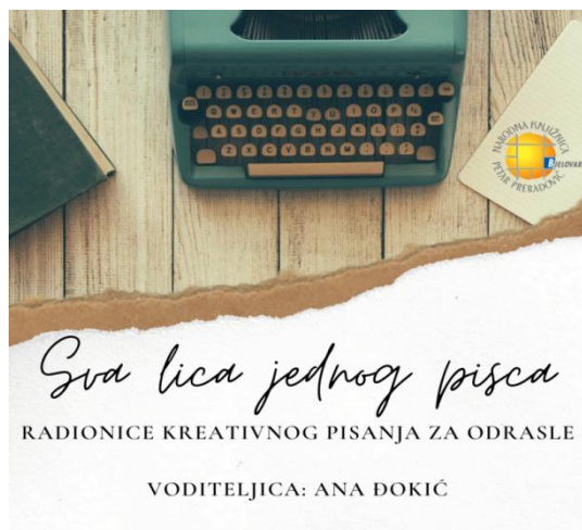
Slika 7. Radionica kreativnog pisanja „Sva lica jednog pisca” u Narodnoj knjižnici Petar Preradović

U Narodnoj knjižnici Petar Preradović u Bjelovaru, povodom Mjeseca hrvatske knjige 2020. godine pod vodstvom književnice Ane Đokić održana je (preko platforme Zoom) i radionica kreativnog pisanja za odrasle pod nazivom „Sva lica jednog pisca”. 43