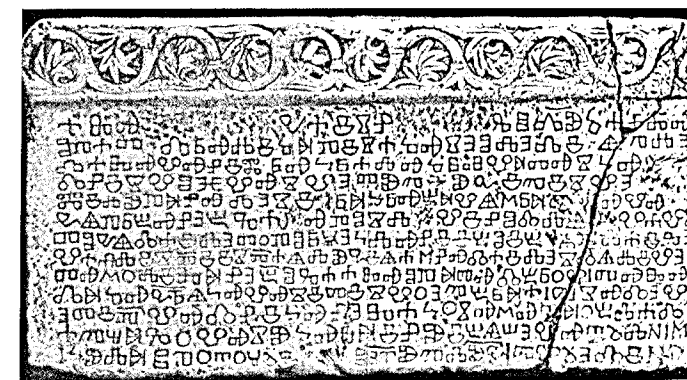
Bašćanska ploča (rekonstrukcija i odljev)

kraljevskoj tituli, ističe se suverenitet hrvatskoga kralja kao donatora zemljišnoga posjeda, donosi se niz imena i titula hrvatskih dostojanstvenika i samostanskih opata. Bašćanska ploča izvanredno je važan izvor za glagoljičnu paleografiju, za razvoj hrvatskoga jezika, ali isto tako i za političku i kulturnu povijest Hrvata. A Fučićevo viđenje Bašćanske ploče danas nam služi kao jedno od mogućih, ali i neizmjerljivo važnih polazišta za daljnje proučavanje ovoga našeg kulturnog spomenika.