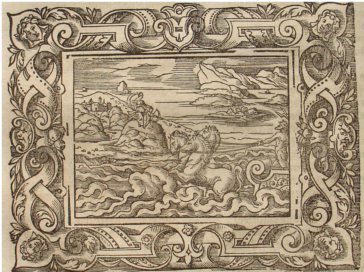
SLIKA 21. Virgil Solis, Kupid strijelom gađa Plutona , drvorez, iz: P. OVIDII METAMORPHOSIS, izdavač Sigmund Feyerabendt, Frankfurt, 1581.

djelomično, no njen prednji dio nosi volutu identičnu volutama s okvira, što je zanimljiv primjer povezivanja vanjske i unutarnje dekoracije grafike. Pluton je prikazan nag te je sjena na njegovim leđima izvedena pomoću kratkih crtica. Venera i Kupid su prikazani izrazito sitni, no strateški izvedenim linijama njihovih malenih figura može se uočiti Venerino naređivanje Kupidu da potajice gađa boga Podzemlja. Solis na ovom drvorezu vrsno definira atmosferu scene dugim, ravnim paralelnim linijama koje su tako oštra suprotnost divljem moru iz kojeg Pluton izlazi.