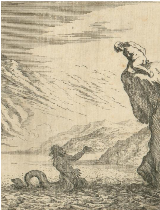
SLIKA 2. Johann Willhelm Baur, Glauk i Scila , detalj, 1641.?, bakropis, Grafička zbirka Nacionalne i sveučilišne knjižnice u Zagrebu

Unutar okvira definiranog elementima manirističke dekoracije u prvom prostornom pojasu se nalaze Glauk i Scila s ispisanim imenima. Glauk se izdiže iz mora prilikom čega se vidi njegov riblji rep te je pogledom usmjeren prema Scili koja silazi s kamena i dijeli pogled s njim. Iza njih se prema dubini prostora razvijaju scene iz ostatka Knjige XIV. Detalj Baurova prikaza Glauka i Scile (SL. 2) je u odnosu na Francovo rješenje monumentalniji, ali i jednostavniji. Glauk je kod Baura također smješten u more s vidljivim repom, s pogledom prema Scili koja je u ovom slučaju na visokoj kamenoj gromadi te je za razliku od Francove uspravne te odjevene Scile, Baurova posjednuta i naga.