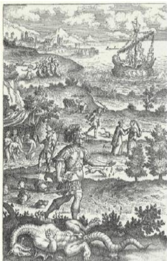
SLIKA 3. Matthäeus Merian, Naslovnica. Knjige III. Metamorfoza , 1619., bakropis, detalj. Preuzeto iz: Stachel, Eva. Johann Wilhelm Baur – Seine Illustrationsserie zu den Metamorphosen des Ovid, Universität Wien: diplomski rad, 2013., str. 111.

Usporedbom naslovnice treće knjige Metamorfoza Matthäusa Meriana (SL. 3) s naslovnicom Giacoma Franca (SL. 4) prema kojoj je nastala, primjećuju se razlike u detaljima. Najviše se primijeti različita izvedba neba, odnosno oblaka, koji su kod Franca punašni i zgusnuti u sredini, dok su kod Meriana raštrkaniji te istaknuti paralelnim linijama neba. Iako je kompozicija jednaka, različitosti se vide na obradi tekstura i detalja grafike.