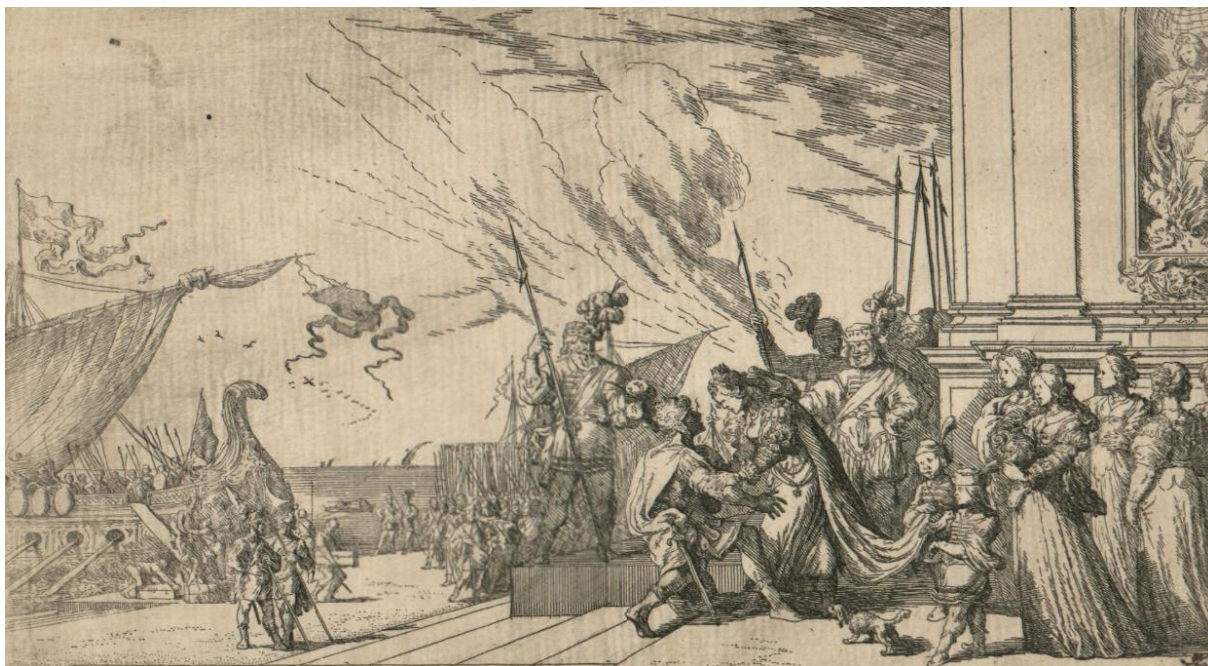
SLIKA 34. Johann Wilhelm Baur, Didona dočekuje Eneju , bakropis, 1641.?, Grafička zbirka Nacionalne i sveučilišne knjižnice u Zagrebu.