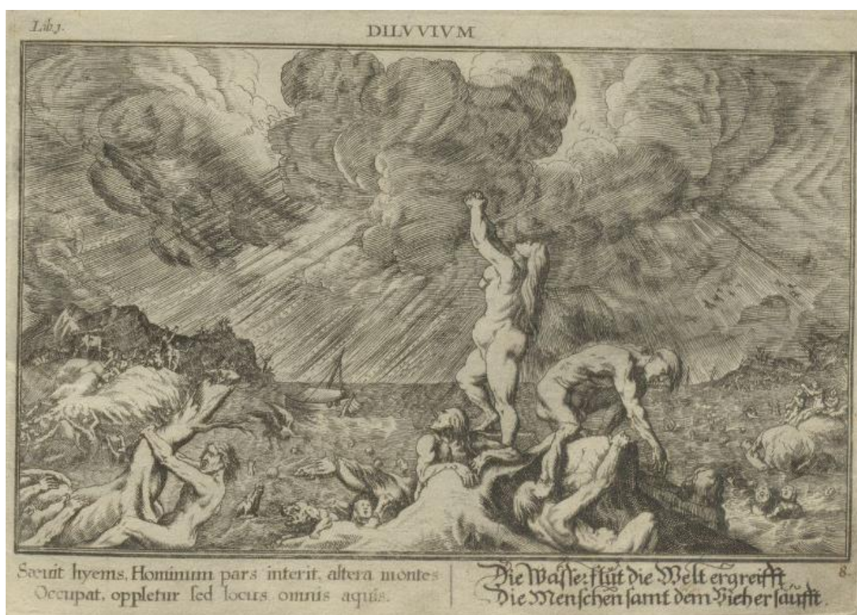
SLIKA 15. Abraham Aubry, Poplava , Sveučilišna knjižnica Erlangen-Nürnberg.