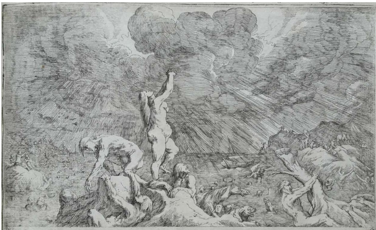
SLIKA 14. Johann Wilhelm Baur, Poplava , British Museum.