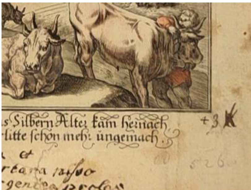
SLIKA 12. Abraham Aubry, Aetas Argentea , verzija iz Grafičke zbirke Nacionalne i sveučilišne knjižnice u Zagrebu, detalj.

Verzija iz NSK nažalost nema naslovnice, no iz prethodnih primjera se da zaključiti da prije grafika u Aubryjevom izdanju Metamorfoza uvijek idu dvije naslovnice. Tomu u prilog ide i činjenica da je prijašnji vlasnik albuma iz NSK na prvom listu u albumu pokraj brojke 4 albuma dopisao broj 3 (SL. 12), uzimajući u obzir postojanje prethodne dvije naslovne stranice.