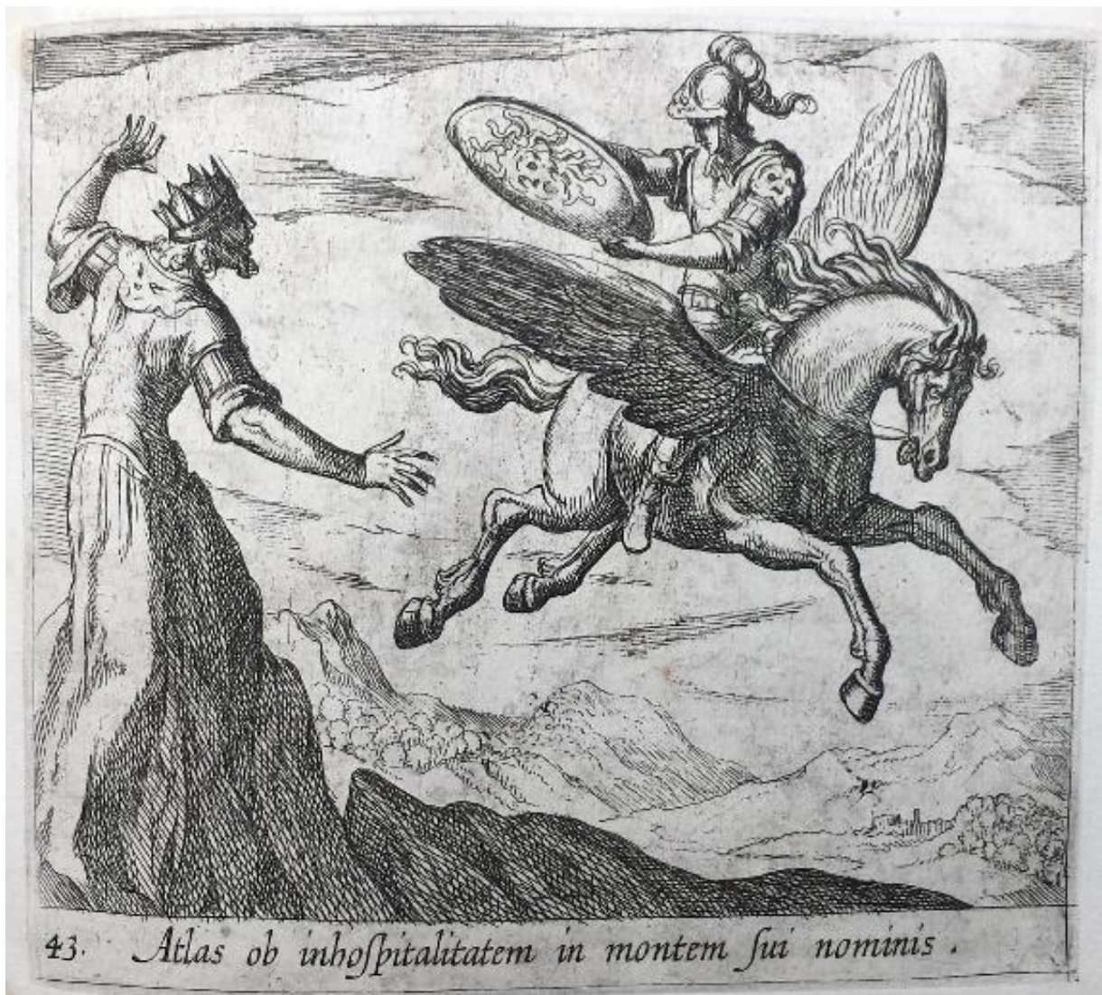
SLIKA 19. Antonio Tempesta, Atlasova preobrazba u planinu , bakrorez, 1606., The British Museum

konjskih mišića na prednjem dijelu konjskoga tijela, već i dinamičnost njegova poleta u zraku. Donji dio desnog krila izveden je prvo finim potezima koji definiraju pojedinačna krila, dok su potom rezane guste ravne paralelne linije kako bi se ostvarila sjena pod krilom. Perzejevo lice je isto tako definirano tankim konturnim linijama, dok je sjena koja mu pada na gornji dio lica zbog kacige izvedena ponovno gustim paralelnim linijama. Način na koji pada svjetlo na lik Atlasa oštro je definiran te zbog toga doprinosi osjećaju dramatičnosti situacije. Bijeli, neobrađeni dijelovi njegovog tijela, u kontrastu su sa sjenovitim dijelovima koji su gusto šrafirani okomitim ravnim linijama. Najvidljivije je to na njegovoj glavi, gdje je stražnji dio glave obasjan svjetlošću i s time definiran samo konturnim linijama, dok je lice rezano ravnim linijama. Takvim postupkom je Tempesta postigao ne samo kontrast svjetla i sjene, nego i osjećaj tmurnosti koje pada na lice osobe koja proživljava strašnu preobrazbu.