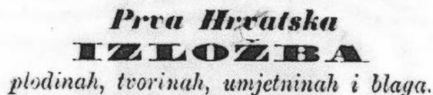
Slika 2. Naslov koji izvještava o Izložbi u Sidru 29.8.1864