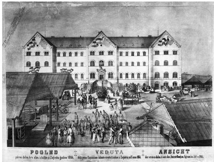
Slika 4. Prikaz Izložbe 1864. godine

listopada navodi da je jednoglasno odlučio brzojavom pozvati I. Mažuranića na otvorenje izložbe. 182 Zašto Mažuranić nije sudjelovao na otvorenju, nije poznato.